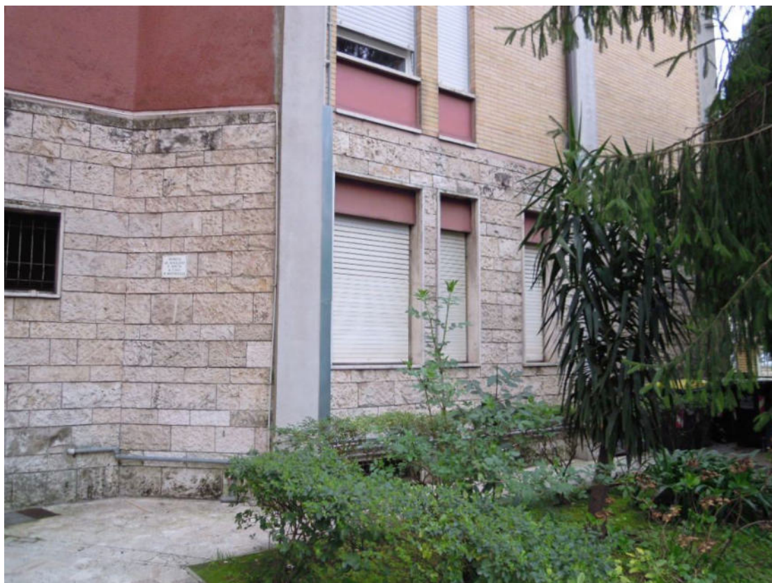
Foto 04 – Vista delle finestre, lato nord, del cespite in oggetto, aggettanti sullo spazio esterno condom.