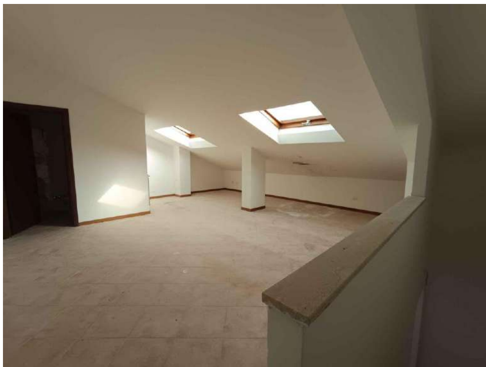
10 – Visione zona notte e soffitta P.- Sottotetto - appartamento (sub. 15)