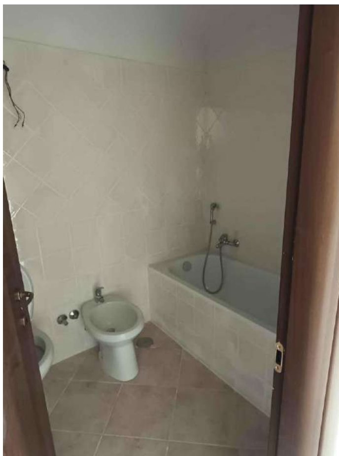
12 – Visione Bagno P.- Sottotetto - appartamento (sub. 15)