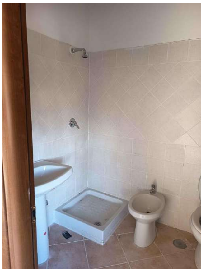
7 – Visione Interna Bagno P. 1° - appartamento (sub. 15)