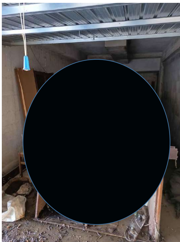
14 – Visione interno Autorimessa – P. interrato - (sub. 24)