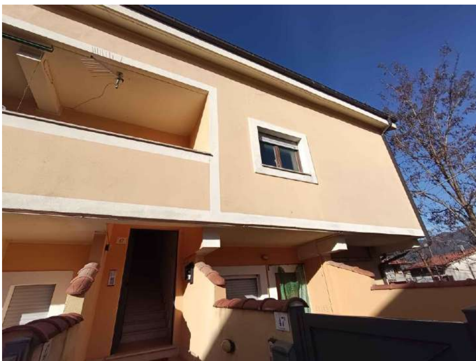
3 – Visione Esterna dell'appartamento (sub. 15)