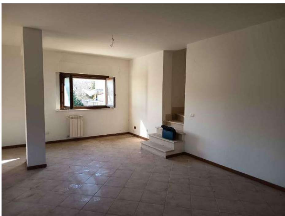
4 – Visione Interna zona Ingresso-Soggiorno P. 1° - appartamento (sub. 15)