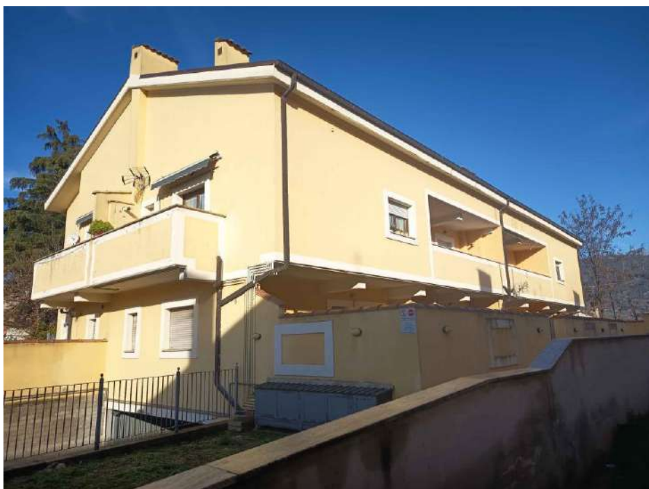
1 – Visione Esterna del Fabbricato