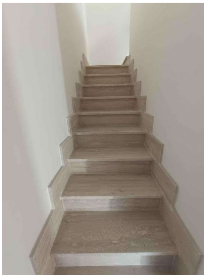
9 – Visione Scala di collegamento P. 1°- Sottotetto - appartamento (sub. 15)