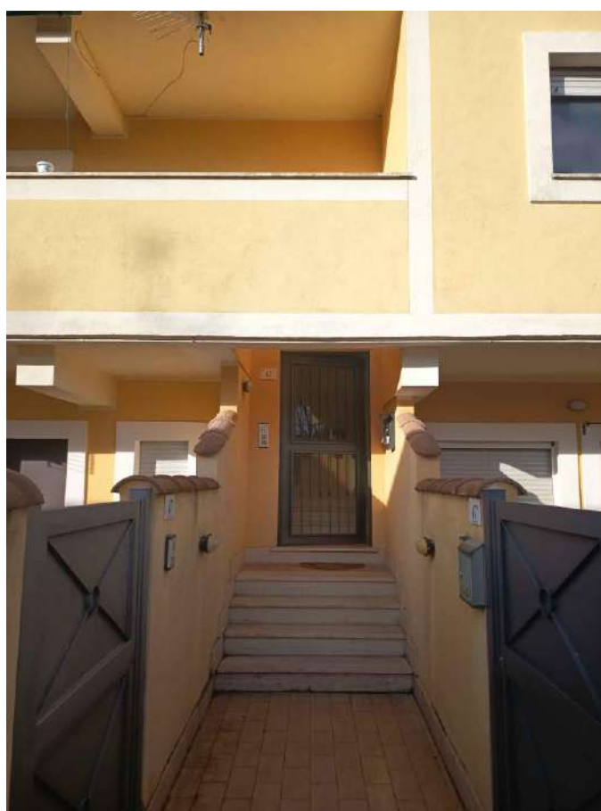
2 – Visione Esterna dell'ingresso (Civico 47)