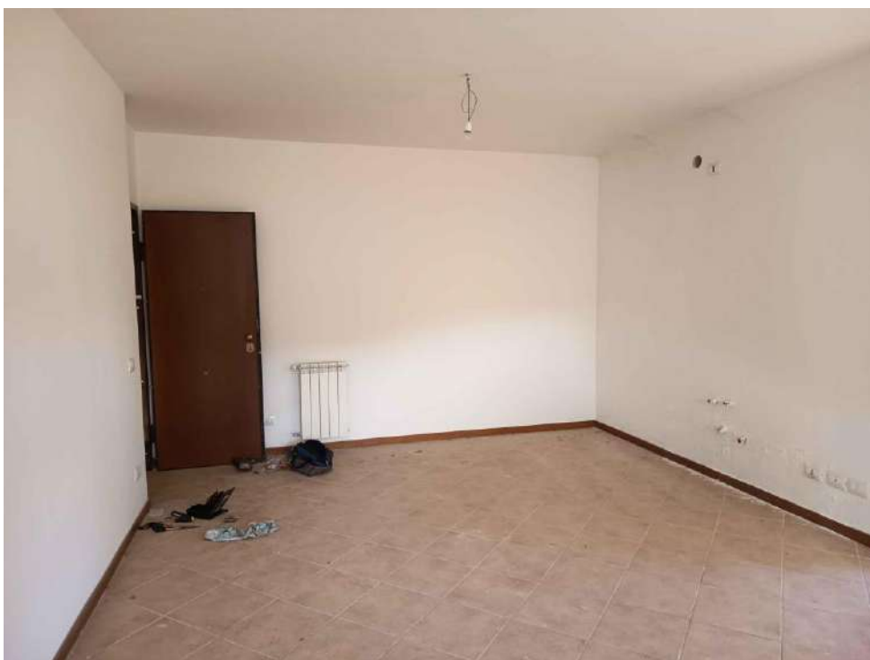
5 – Visione Interna zona Ingresso-Soggiorno P. 1° - appartamento (sub. 15)