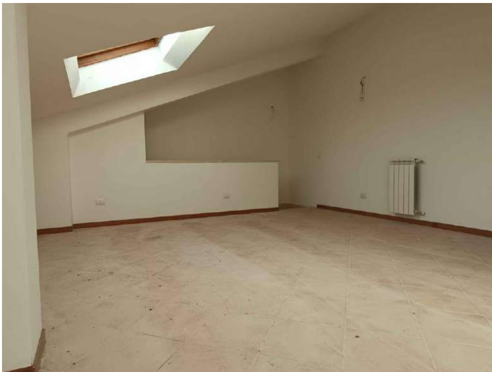
11 – Visione zona notte e soffitta P.- Sottotetto - appartamento (sub. 15)