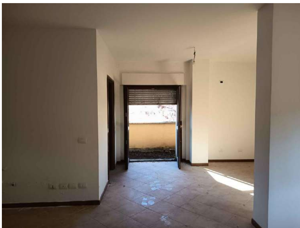
6 – Visione Interna zona Ingresso-Soggiorno P. 1° - appartamento (sub. 15)