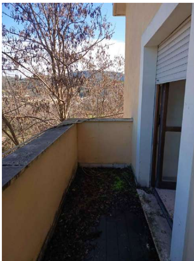
8 – Visione Terrazzo P. 1° - appartamento (sub. 15)