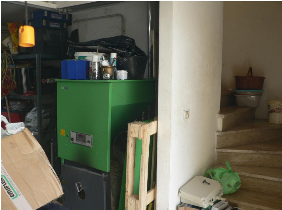
Fotogramma n. 42 Garage Piano Seminterrato