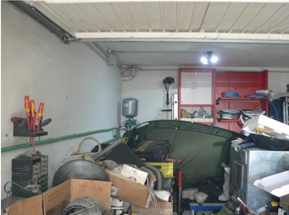
Fotogramma n. 41 Garage Piano Seminterrato