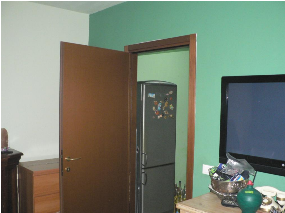
Fotogramma n. 18 Soggiorno - Disimpegno