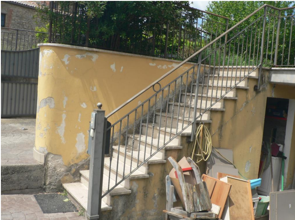
Fotogramma n. 4 Scala di accesso