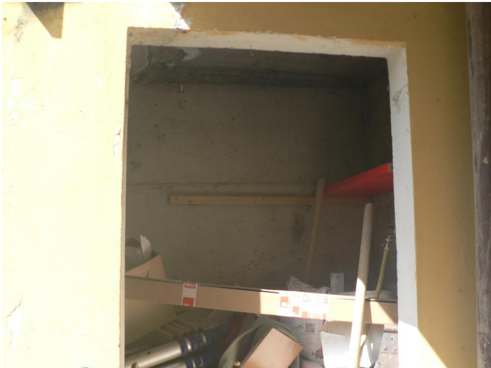
Fotogramma n. 8 Sottoscala