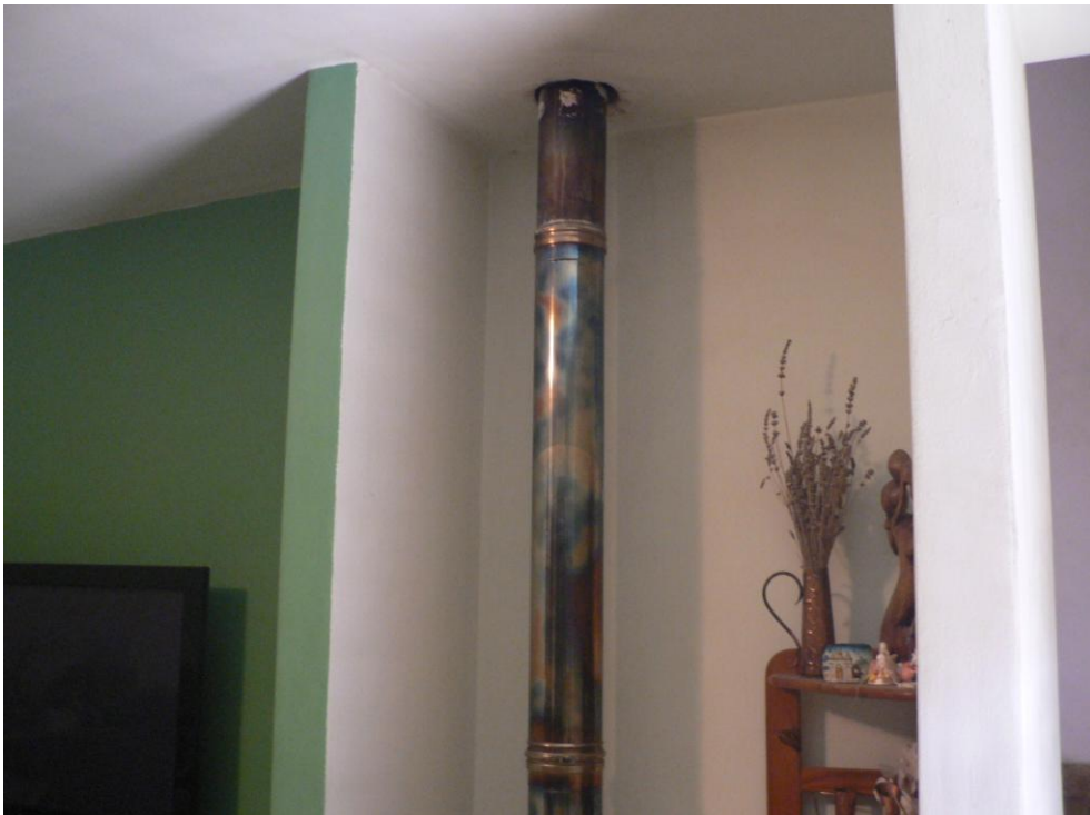
Fotogramma n. 16 Soggiorno