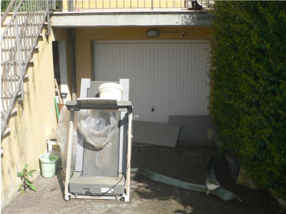
Fotogramma n. 7 Garage Lato Sud