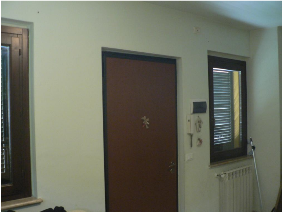
Fotogramma n. 15 Ingresso Soggiorno