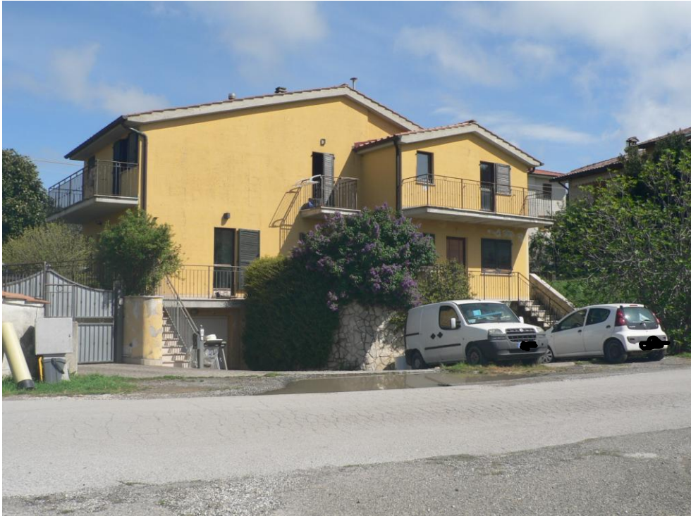
Fotogramma n. 3 Prospetto Lato Sud