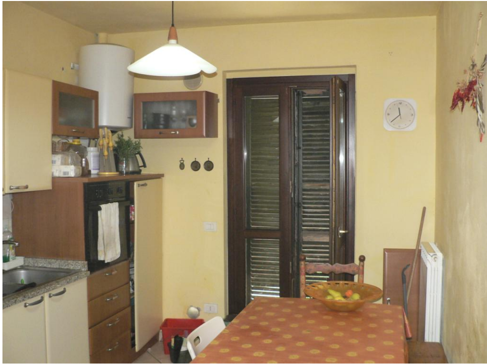
Fotogramma n. 33 Cucina Piano Terra