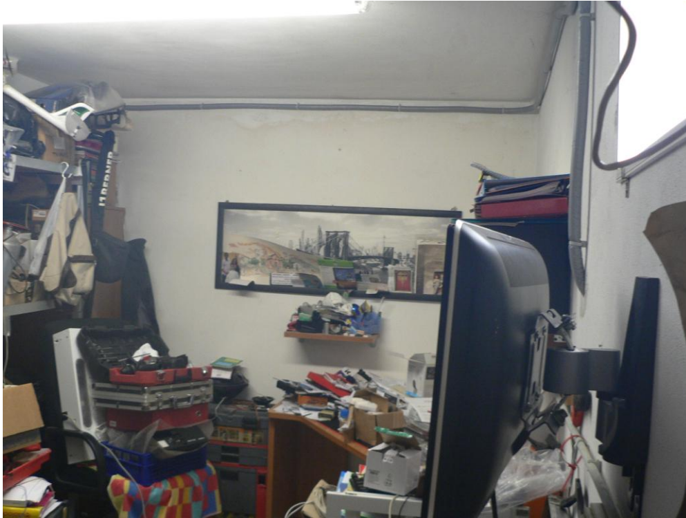
Fotogramma n. 43 Cantina Piano Seminterrato