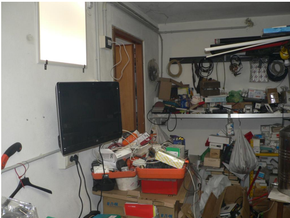
Fotogramma n. 44 Cantina Piano Seminterrato