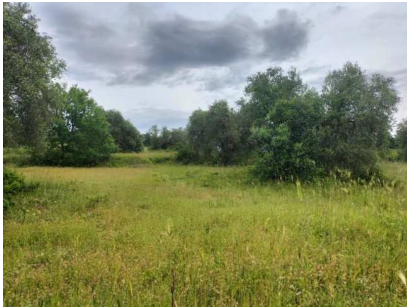
FOTOGRAMMA n° 7