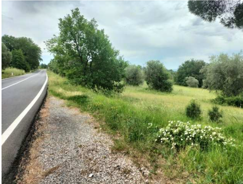
FOTOGRAMMA n° 9