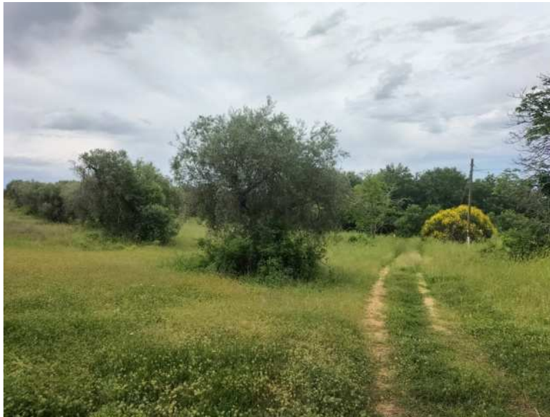
FOTOGRAMMA n° 3