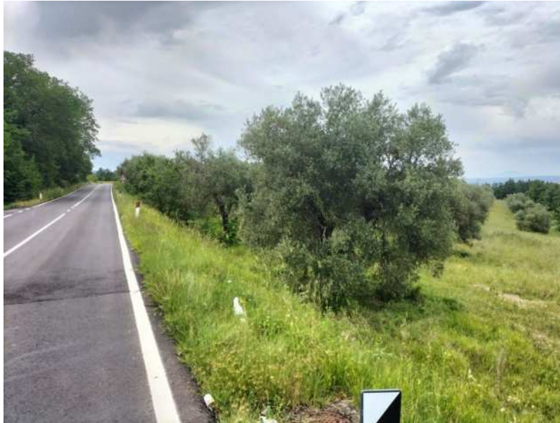
FOTOGRAMMA n° 11