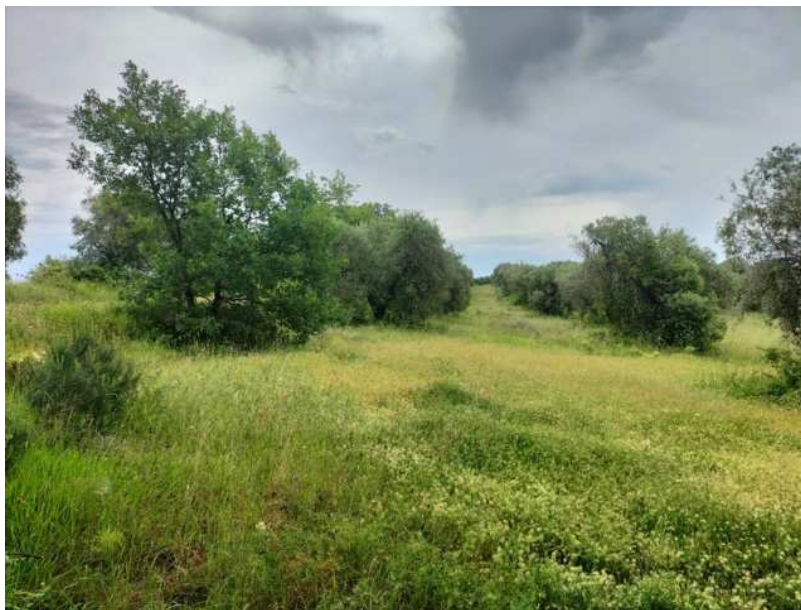
FOTOGRAMMA n° 4

TRIBUNALE DI TERNI - ES. IMM. N° 148/2024 OMISSIS contro OMISSIS LOTTO UNICO