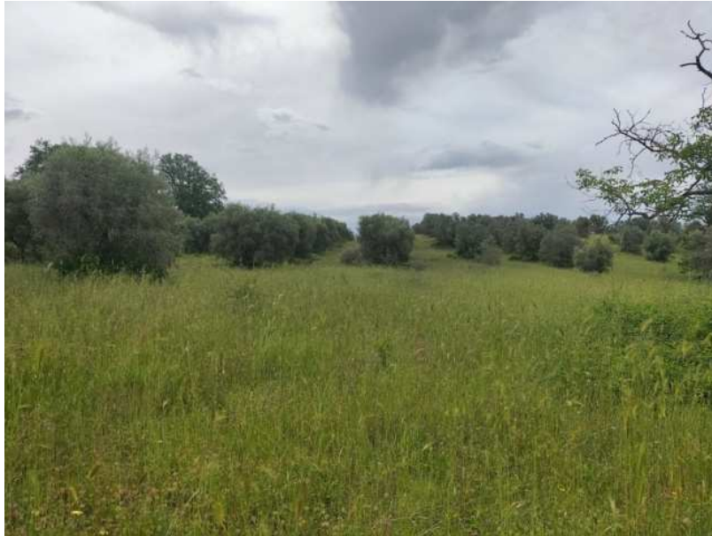
FOTOGRAMMA n° 5