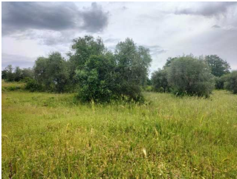
FOTOGRAMMA n° 6

TRIBUNALE DI TERNI - ES. IMM. N° 148/2024 OMISSIS contro OMISSIS LOTTO UNICO