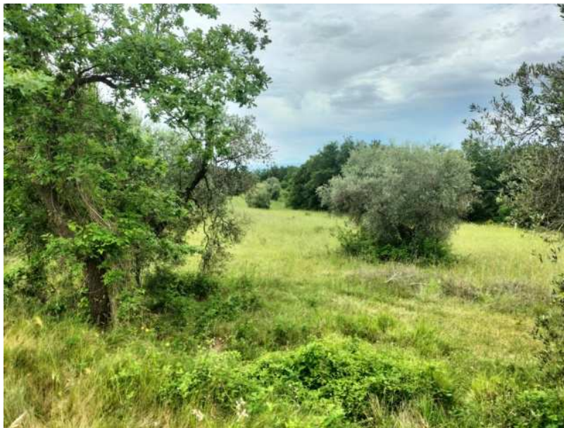
FOTOGRAMMA n° 10

TRIBUNALE DI TERNI - ES. IMM. N° 148/2024 OMISSIS contro OMISSIS LOTTO UNICO