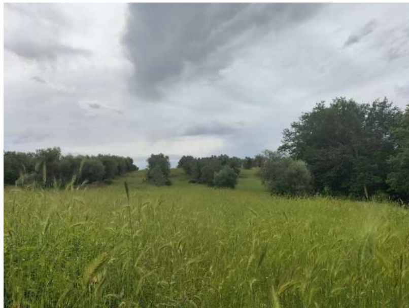
FOTOGRAMMA n° 8

TRIBUNALE DI TERNI - ES. IMM. N° 148/2024 OMISSIS contro OMISSIS LOTTO UNICO