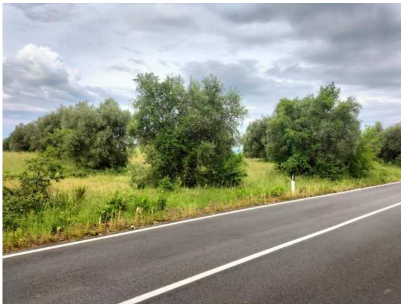
FOTOGRAMMA n° 16

TRIBUNALE DI TERNI - ES. IMM. N° 148/2024 OMISSIS contro OMISSIS LOTTO UNICO