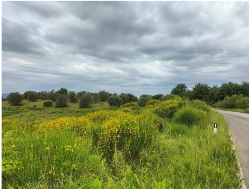
FOTOGRAMMA n° 17