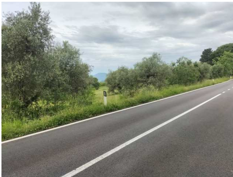
FOTOGRAMMA n° 14

TRIBUNALE DI TERNI - ES. IMM. N° 148/2024 OMISSIS contro OMISSIS LOTTO UNICO