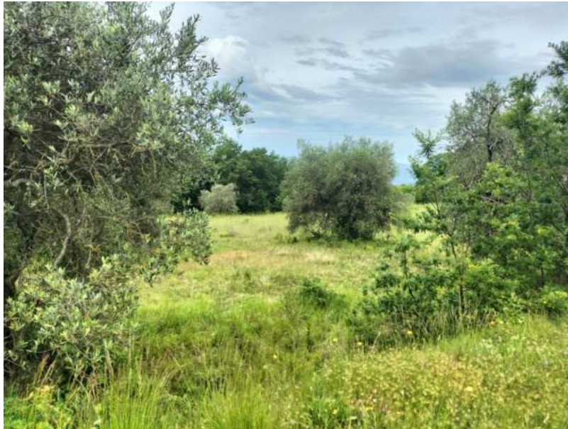
FOTOGRAMMA n° 13