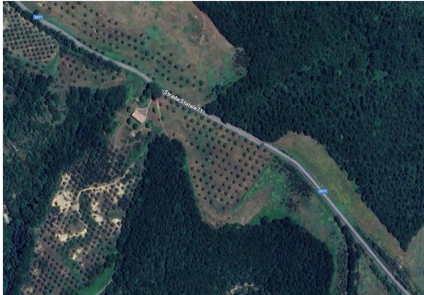
FOTOGRAMMA n° 1