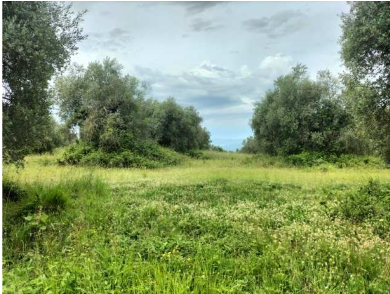
FOTOGRAMMA n° 15