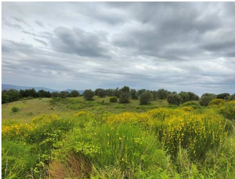
FOTOGRAMMA n° 18

TRIBUNALE DI TERNI - ES. IMM. N° 148/2024 OMISSIS contro OMISSIS LOTTO UNICO