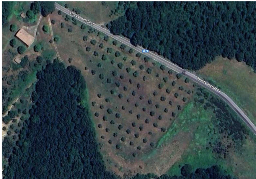
FOTOGRAMMA n° 2

TRIBUNALE DI TERNI - ES. IMM. N° 148/2024 OMISSIS contro OMISSIS LOTTO UNICO