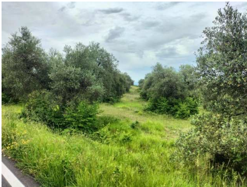
FOTOGRAMMA n° 12

TRIBUNALE DI TERNI - ES. IMM. N° 148/2024 OMISSIS contro OMISSIS LOTTO UNICO