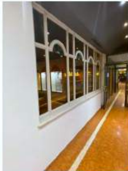
38_corridoio di collegamento tra la hall e la zona dedicata alla ristorazione