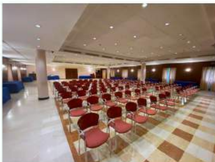
35_sala convegni, vista in direzione dell'ingresso