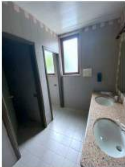
47_anti latrina tipo, ala Sud Ovest