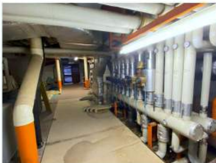
97_particolare condutture impianto di riscaldamento