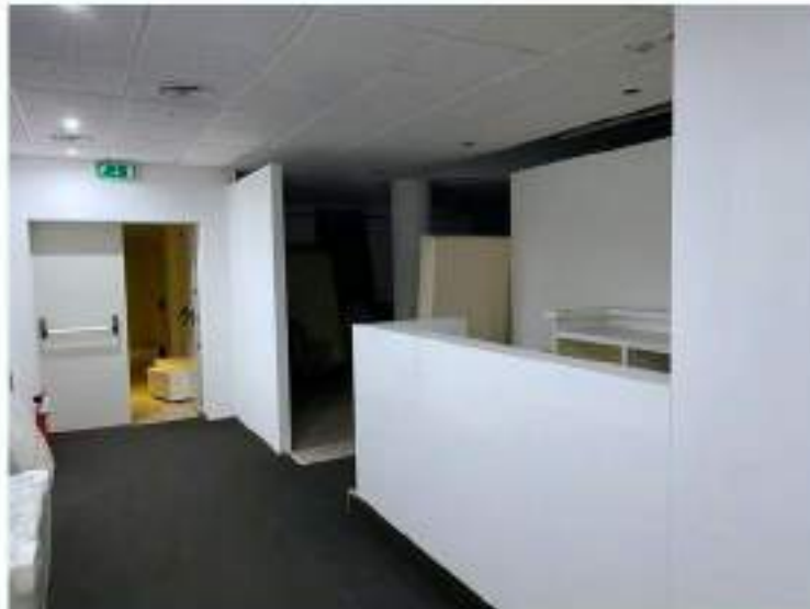
54_particolare sala centrale per riunioni e trattenimenti