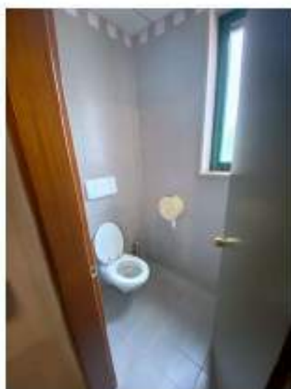
31_servizio igienico tipo, ala Nord Est