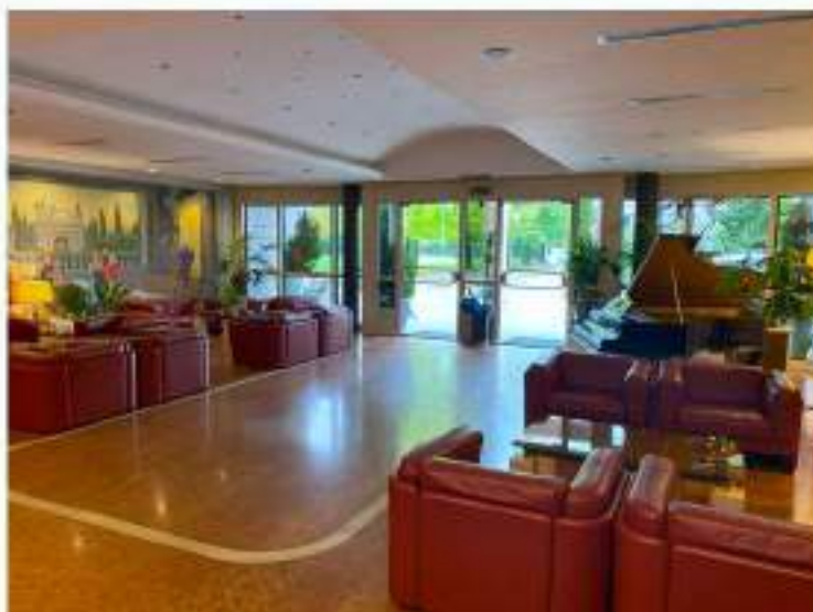
24_hall d'ingresso con area relax e conversazione