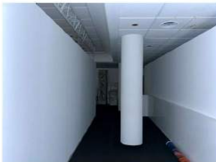
56_particolare sala centrale per riunioni e trattenimenti