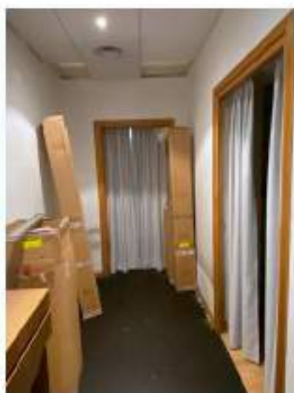
59_disimpegno attiguo alla sala di rappresentanza che porta al guardaroba ed ai servizi igienici