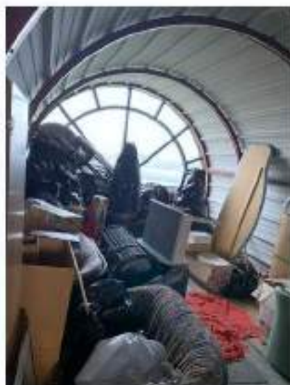
98_particolare del corpo centrale dello stabile