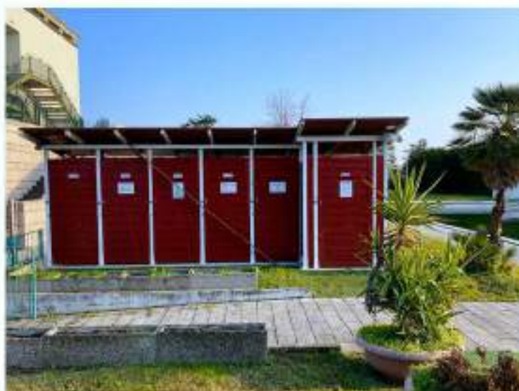
20_spogliatoi a servizio dell'area relax