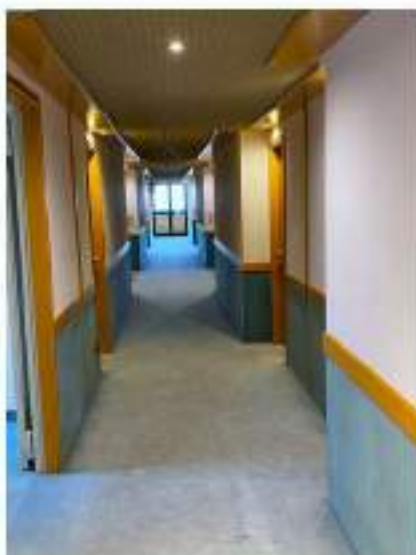
80_corridoio centrale, sul fondo l'uscita d'emergenza