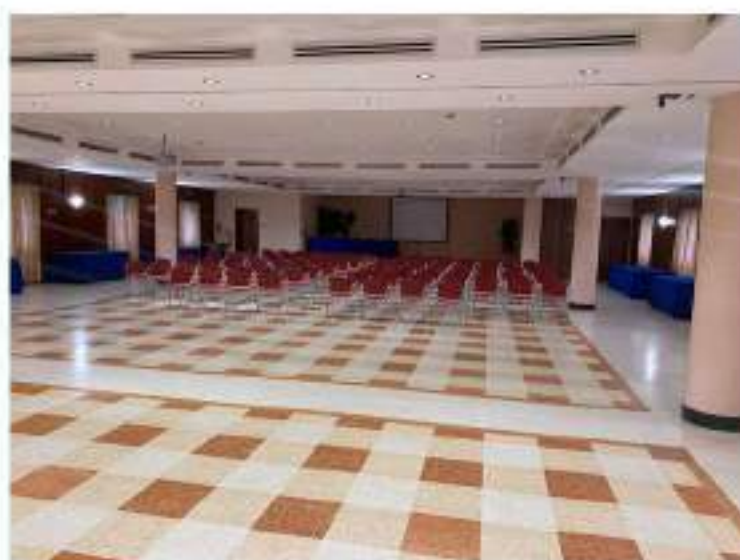
34_sala convegni, vista verso il lato Nord Est