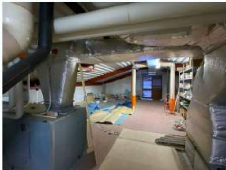
96_particolare del locale sottotetto