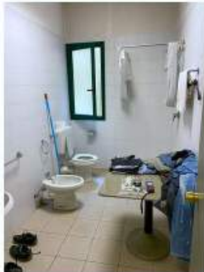
72_particolare bagno annesso a spogliatoio