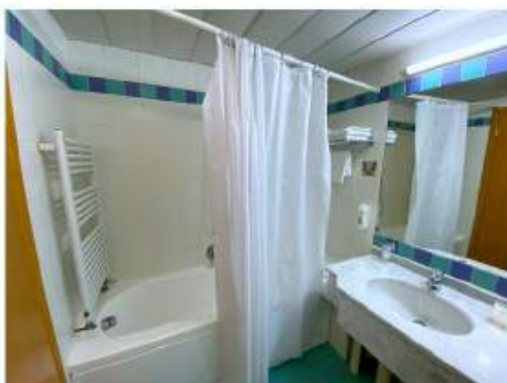
88_vasca bagno suite