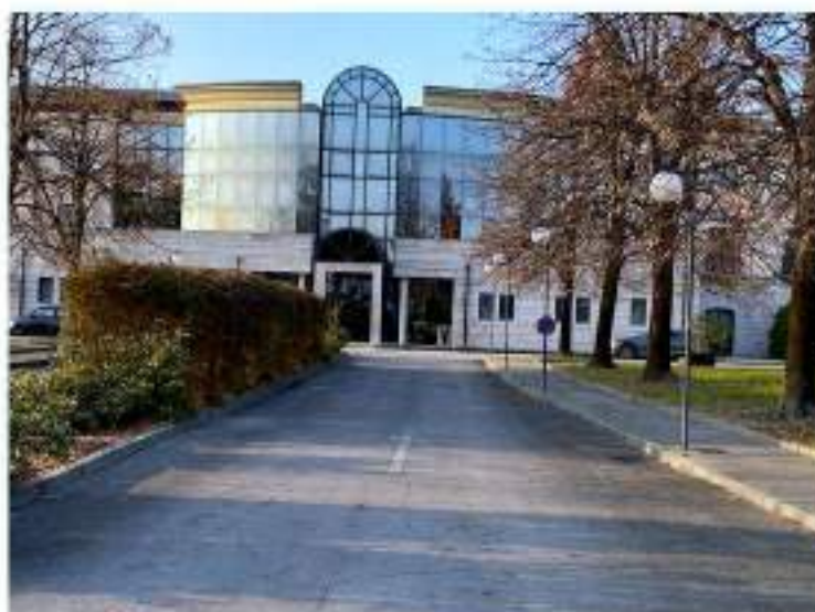
4_corsia veicolare in entrata alla struttura