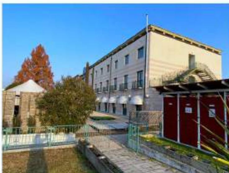
18_vialetto d'ingresso all'area relax