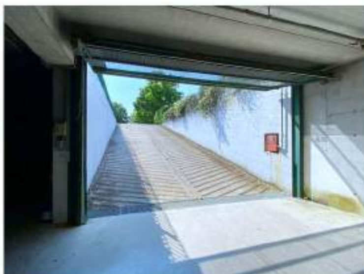
78_rampa carrabile d'accesso al parcheggio coperto interrato