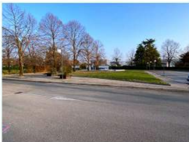
7_isola a verde prospiciente Ca'Brugnera e parte della viabilità interna