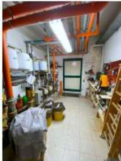
75_locale pompe giardinaggio