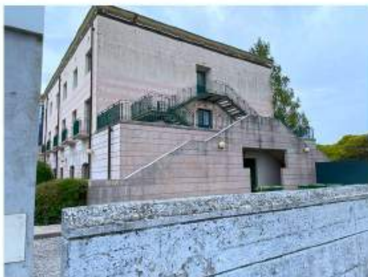
11_fianco Nord Est del fabbricato