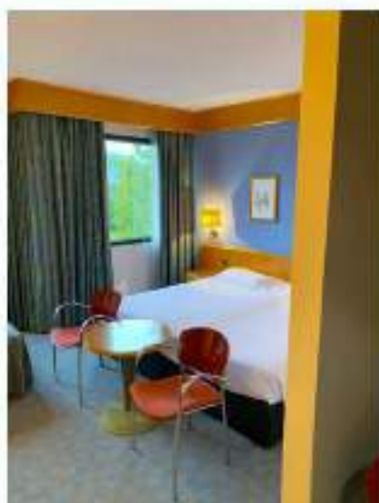
90_parte di zona letto camera tripla-disabili