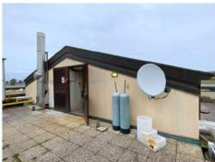
99_uscita terrazza verso lato Sud Ovest