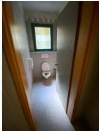
61_servizio igienico tipo