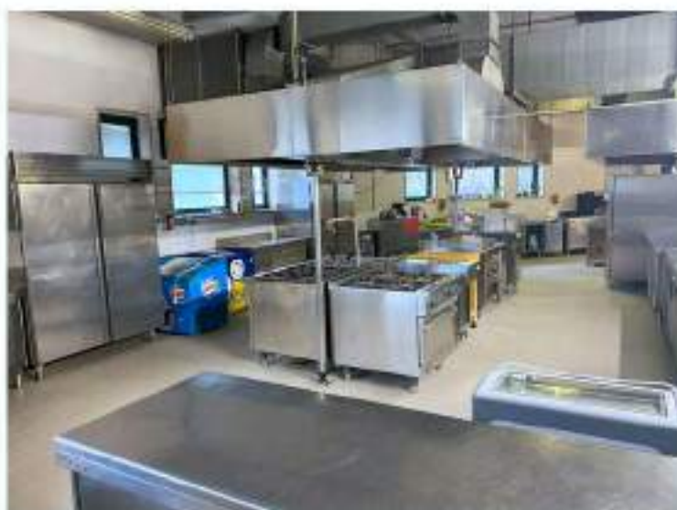
43_cucina zona cottura