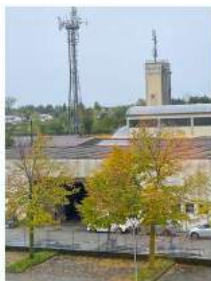
17_vista in direzione Nord Ovest su Via Giolitti