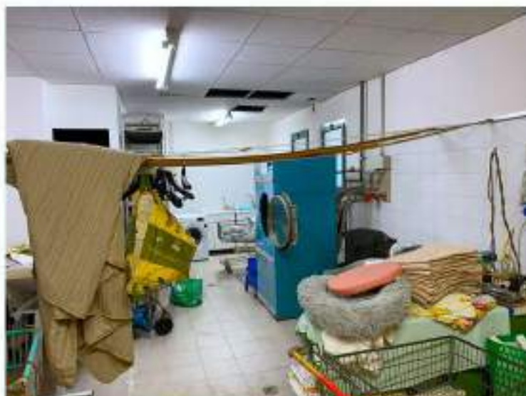
66_particolare locale lavanderia