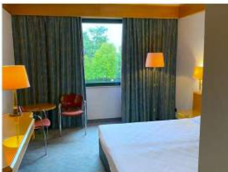
82_area posto letto camera standard