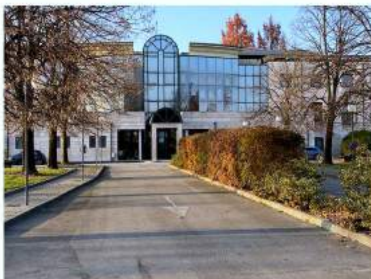
5_corsia veicolare in uscita dalla struttura