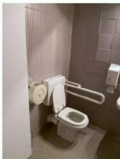
32_servizio igienico riservato a persone disabili, ala Nord Est