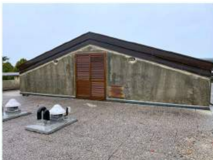
102_uscita terrazza verso lato Nord Est