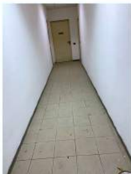
64_corridoio a servizio dei vani accessori