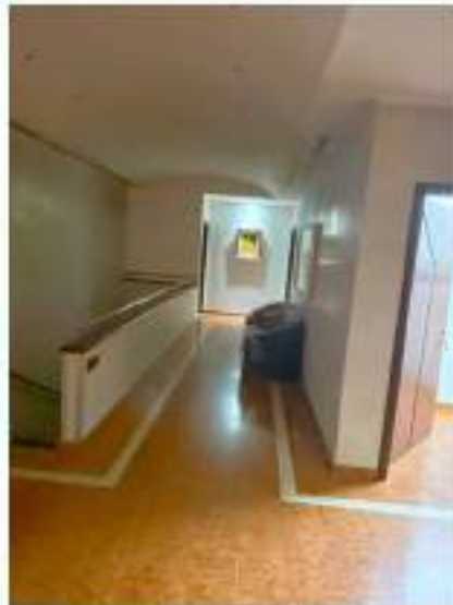
53_scala di collegamento tra piano terra ed interrato posizionata verso l'ala Nord Est