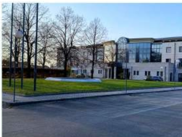
6_vista in direzione Est-Ovest, particolare del parcheggio esterno e dell'isola a verde antistante