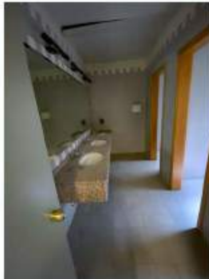
60_anti latrina tipo