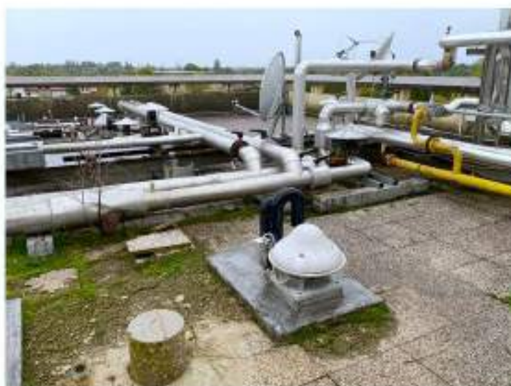
100_terrazza esterna con tubazioni impiantistiche