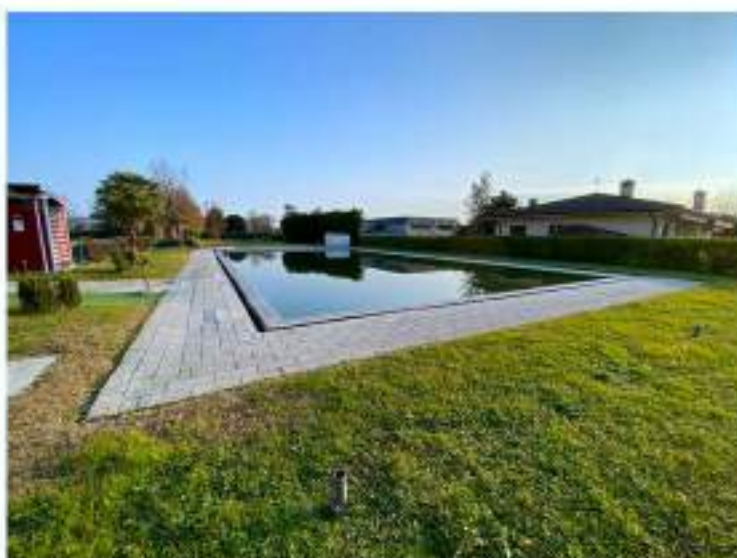
19_piscina mt. 12.50x25.00