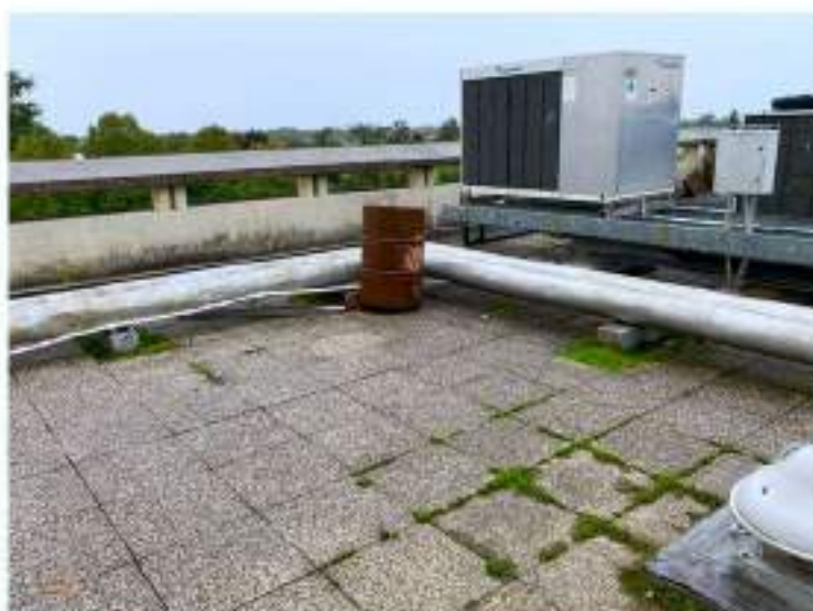
101_terrazza esterna e macchina frigorifera