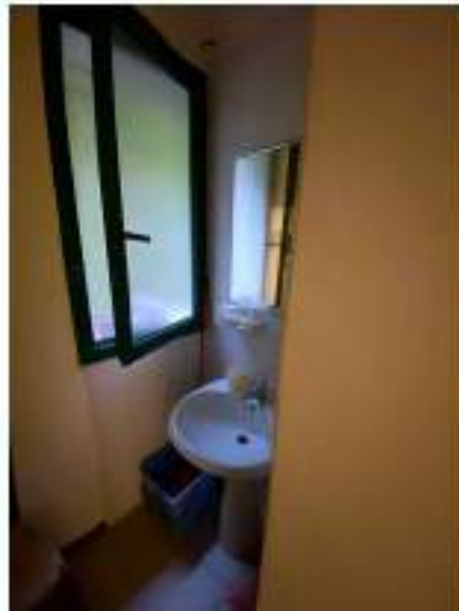
73_particolare anti bagno annesso a spogliatoio