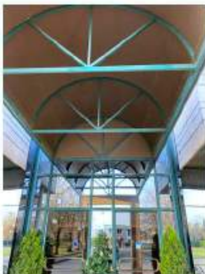
23_portale e accesso principale alla hall