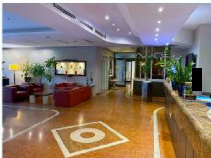
26_hall d'ingresso con vista sul corridoio in direzione Sud Ovest all'ala ristorazione