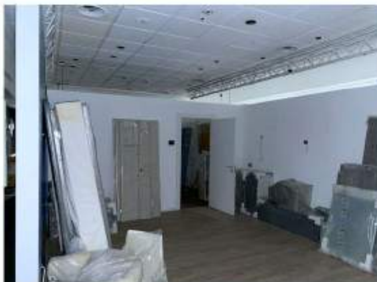
57_particolare sala centrale per riunioni e trattenimenti