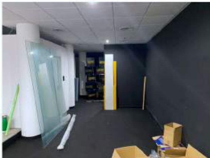
55_particolare sala centrale per riunioni e trattenimenti