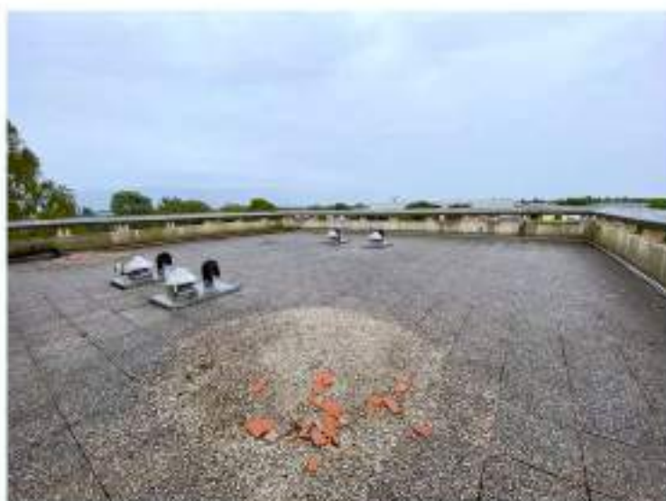
103_porzione di terrazza verso Nord Est