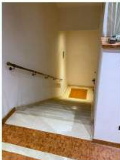
52_scala di collegamento tra piano terra ed interrato posizionata verso l'ala Sud Ovest