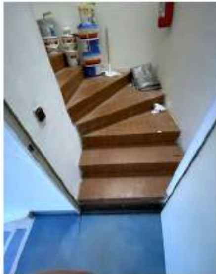
95_scala di collegamento tra piano secondo e terzo