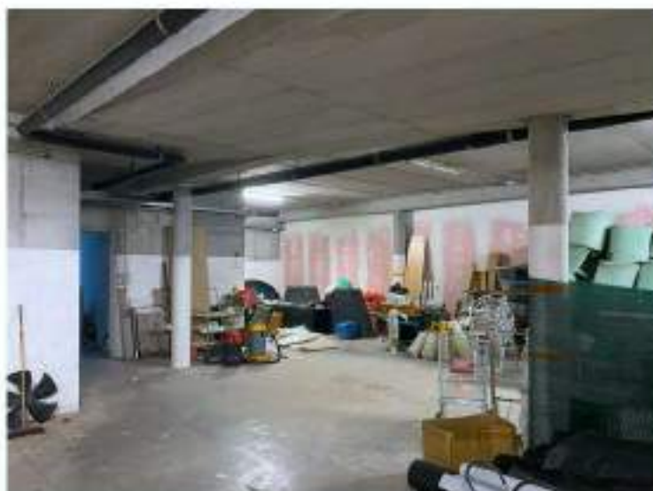
77_magazzino posto al di fuori della sagoma strutturale del fuori terra