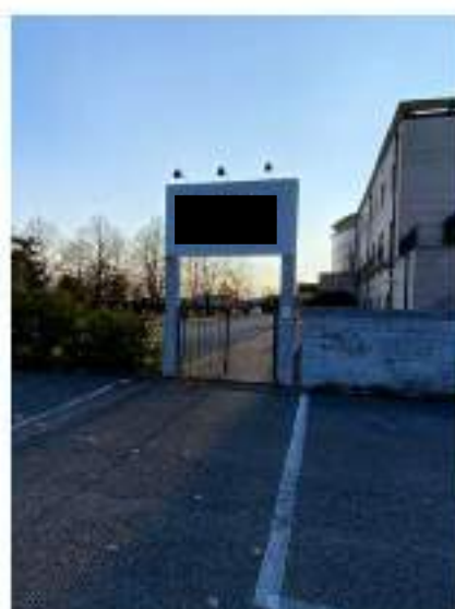
9_ingresso pedonale sul confine Nord Est