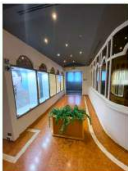
37_accesso indipendente ad uso della sola area ristorazione