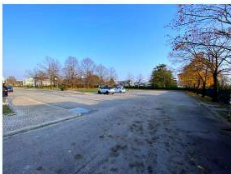
8_parcheggio esterno posizionato in direzione Nord Ovest