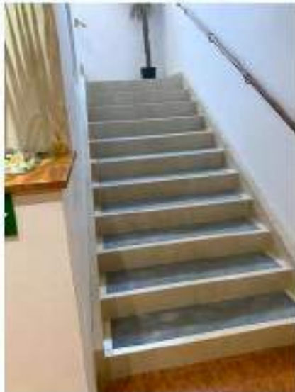
51_scala di collegamento tra piano terra e primo verso l'ala Sud Ovest