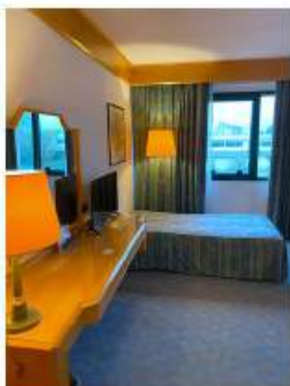
91_parte di zona letto camera tripla-disabili