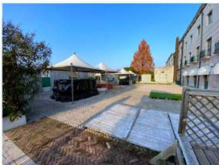
16_terrazza esterna retrostante verso il confine Nord Ovest