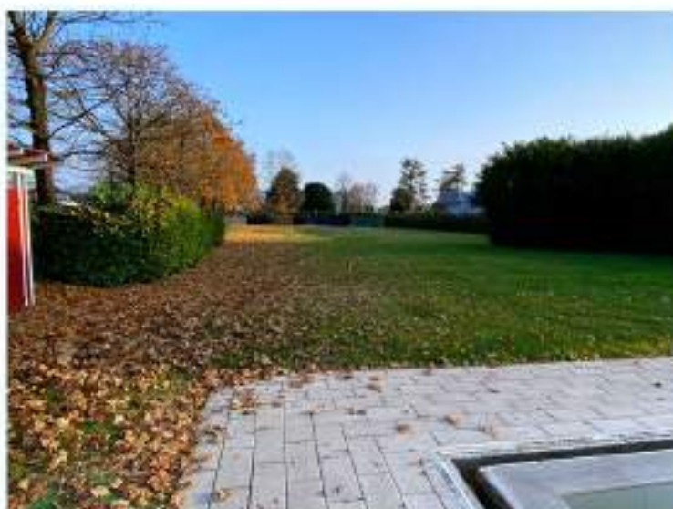
22_prato della zona relax