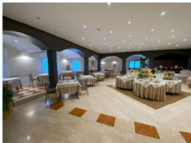
40_sala ristorante e prima colazione