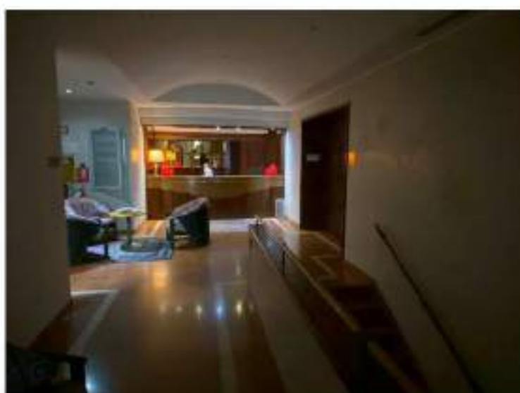
28_vista su corridoio ed angolo bar interposto tra hall d'ingresso e sala convegni, notasi la scala che conduce al piano interrato