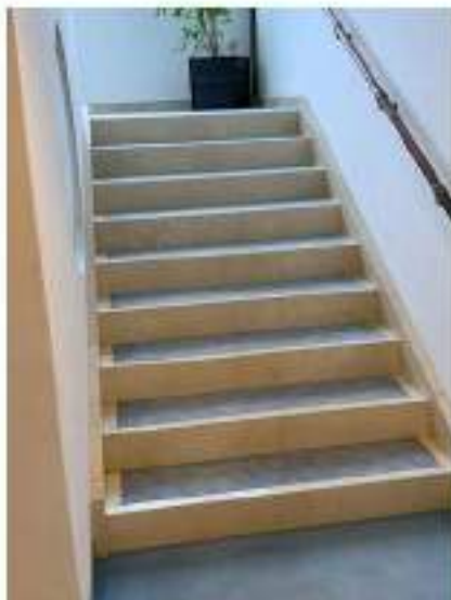
93_scale di collegamento tra piano primo e secondo