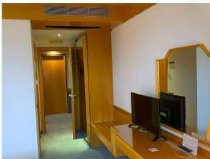
81_atrio d'ingresso tipo delle camere standard e triple-disabili