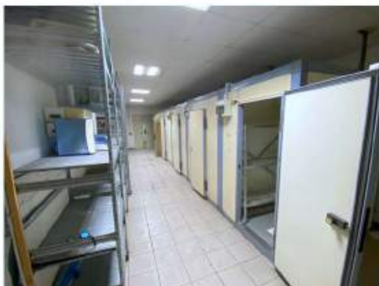
67_particolare magazzino con celle frigorifere