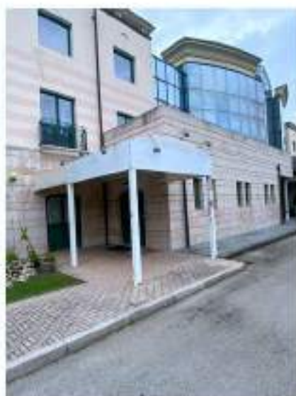
15_accesso autonomo alla sala ristorazione