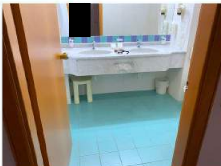
89_particolare doppio lavabo bagno suite