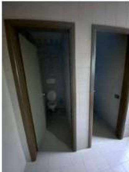
48_servizio igienico tipo, ala Sud Ovest