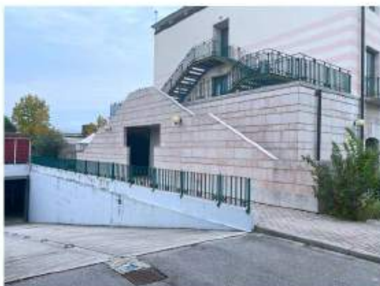
12_fianco Sud Ovest e rampa carrabile d'accesso al parcheggio interrato coperto