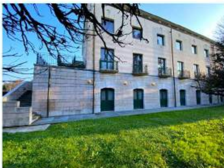
13_prospetto Nord Ovest del fabbricato