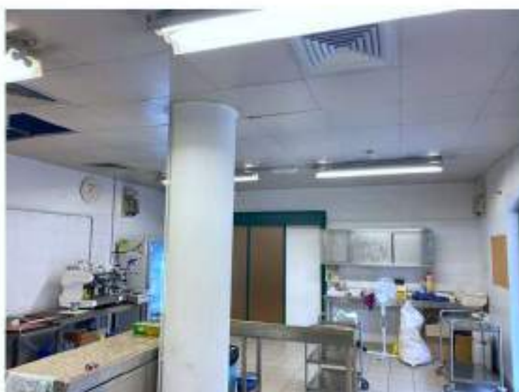
45_locale destinato alla preparazione della prima colazione