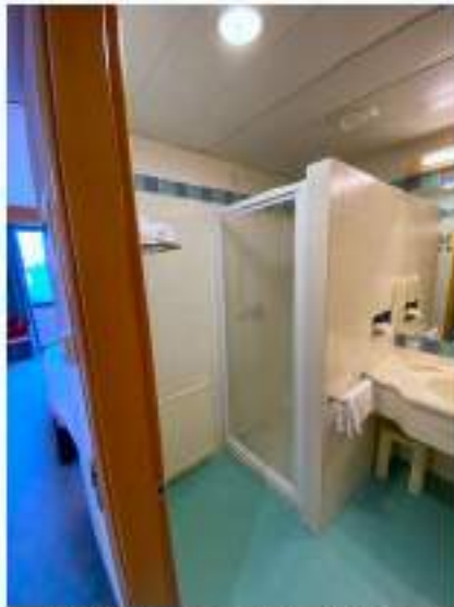
84_doccia bagno camera standard