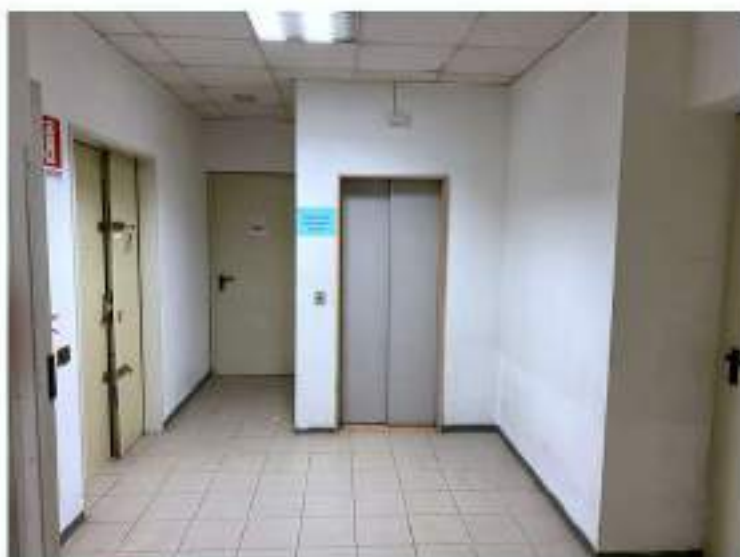
63_ascensore di servizio del personale