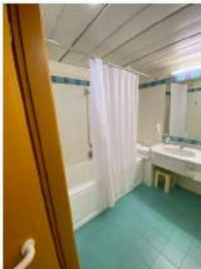
92_particolare bagno camera tripla-disabili