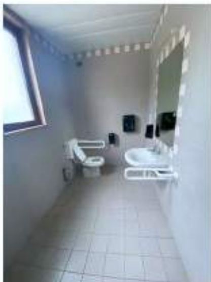
49_servizio igienico disabili, ala Sud Ovest