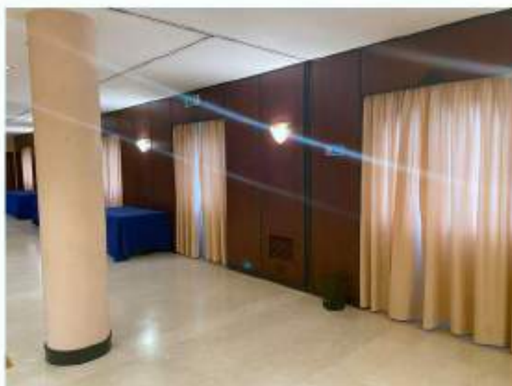
36_particolare lati perimetrali della sala convegni