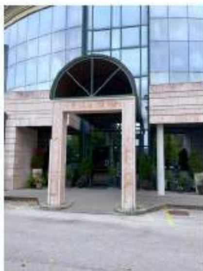
14_portico d'accesso di Ca' Brugnera