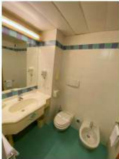
83_bagno camera standard