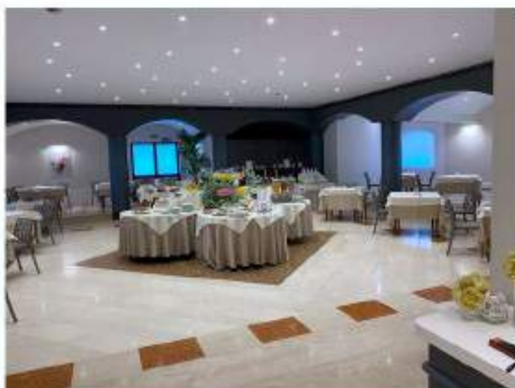
41_porzione centrale della sala ristorante e prima colazione