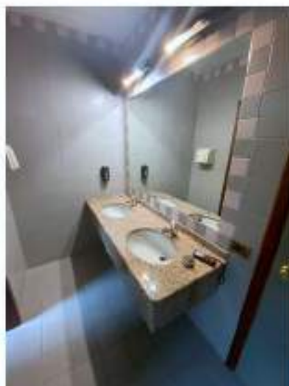
30_particolare antibagno, ala Nord Est