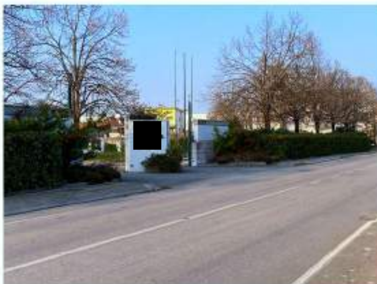
1_vista su Via Villa Varda in direzione Sud Ovest - Nord Est, particolare accesso alla struttura