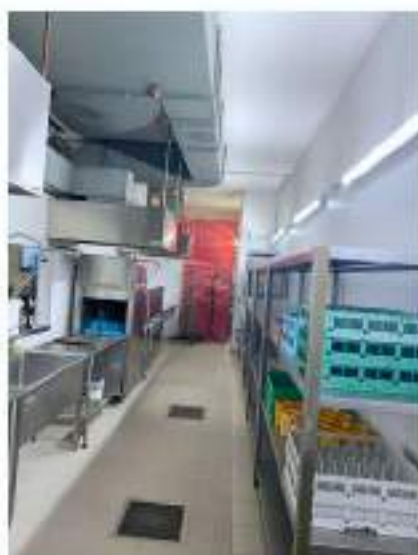
44_cucina zona lavaggio stoviglie