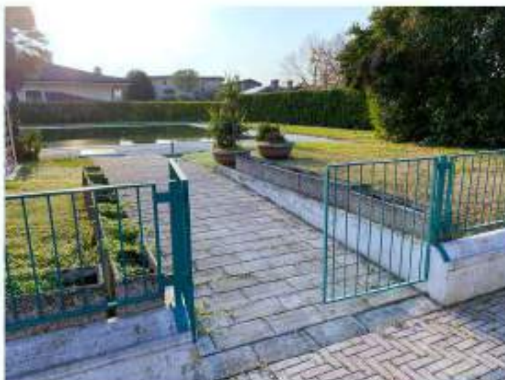
18_accesso all'area relax esterna