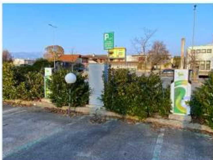
10_colonnine di ricarica auto elettriche poste sul parcheggio scoperto a Nord Est