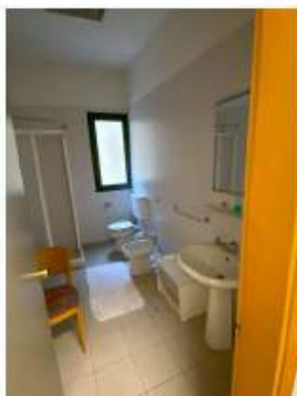
71_particolare bagno annesso a spogliatoio