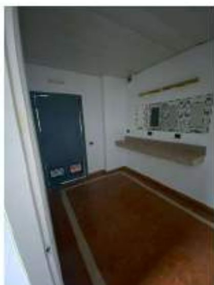
46_accesso ai servizi igienici ala Sud Ovest