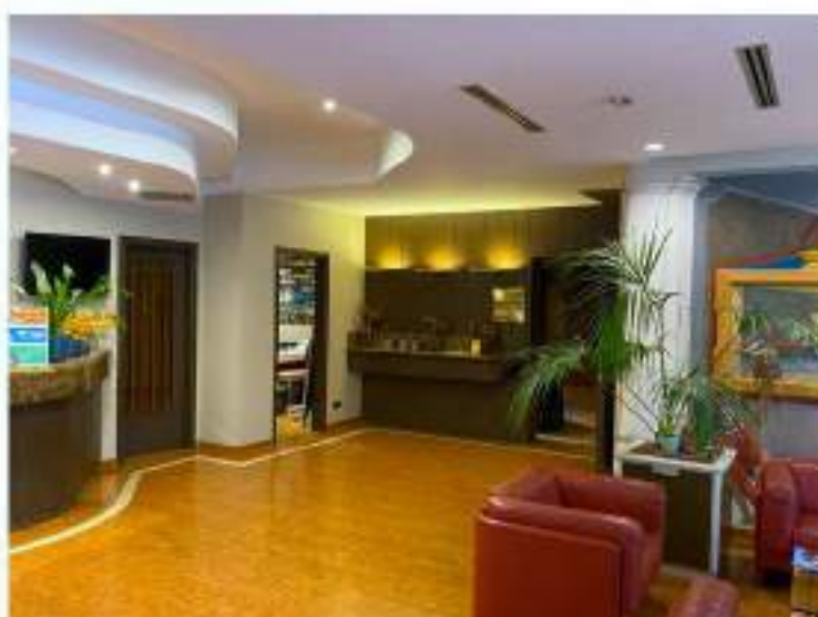
27_porzione a Nord Est della hall in direzione della sala convegni