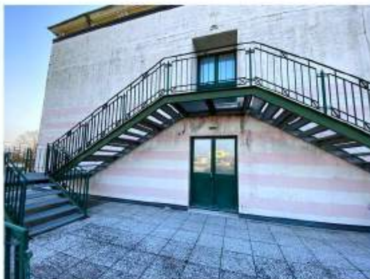
94_terrazza esterna con scale di emergenza