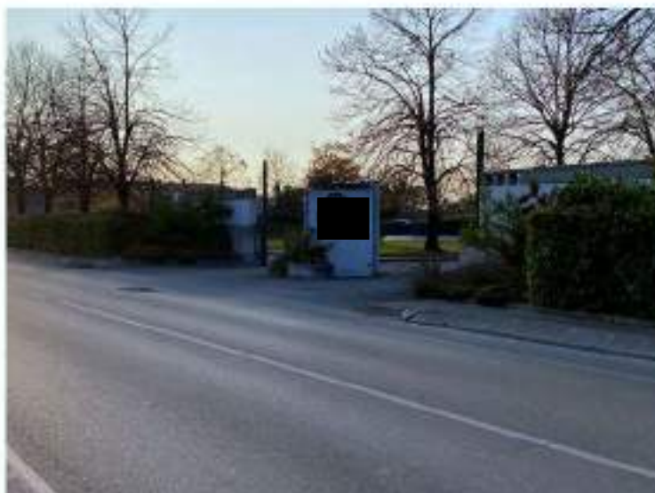
2_vista su Via Villa Varda in direzione Nord Est-Sud Ovest, particolare accesso alla struttura