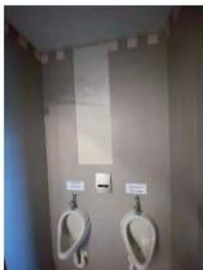
33_particolare orinatori, ala Nord Est