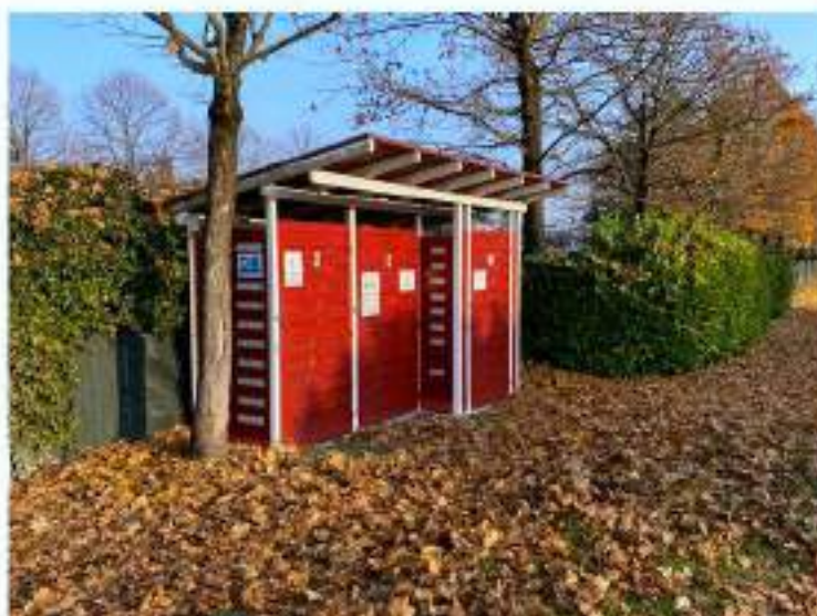
21_servizi igienici a servizio dell'area relax