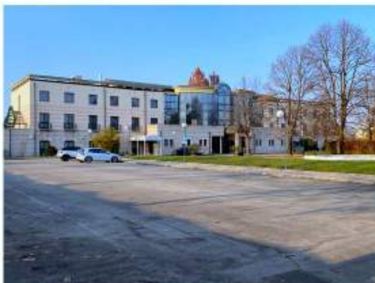
3_vista d'insieme del fronte principale di Ca' Brugnera