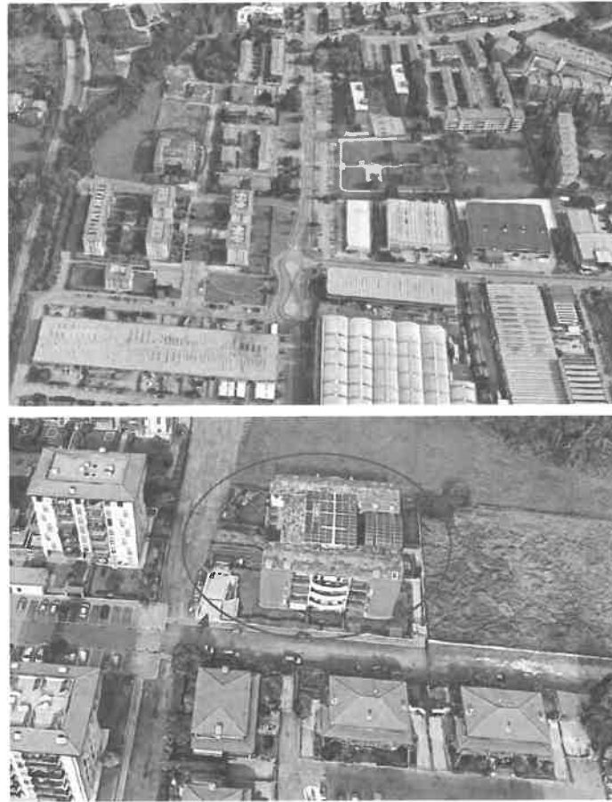
Inquadramento territoriale - vista dell'area e individuazione fabbricato e accesso carrabile