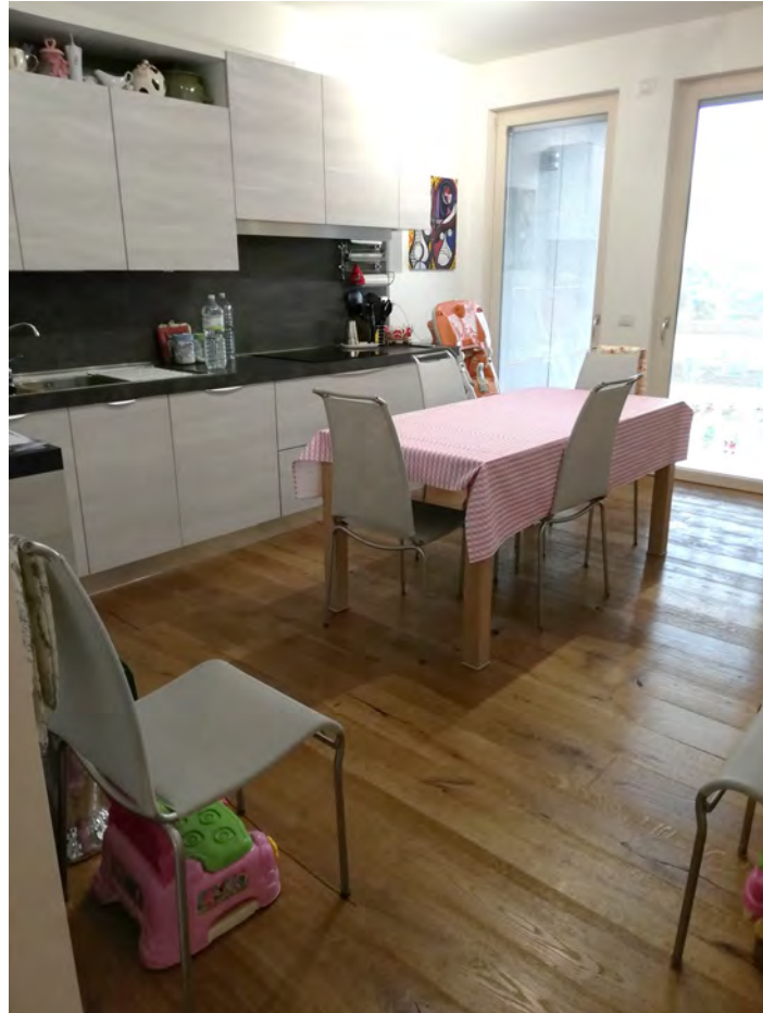
Cucina (da progetto: camera)