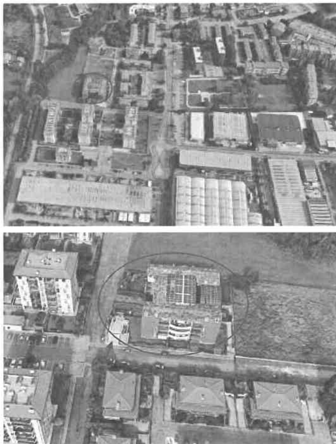
Inquadramento territoriale - vista dell'area e individuazione fabbricato e accesso carrabile