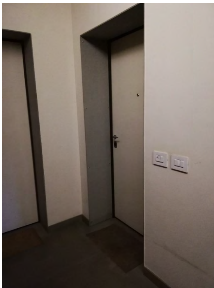
Accesso al deposito - piano terzo sottotetto