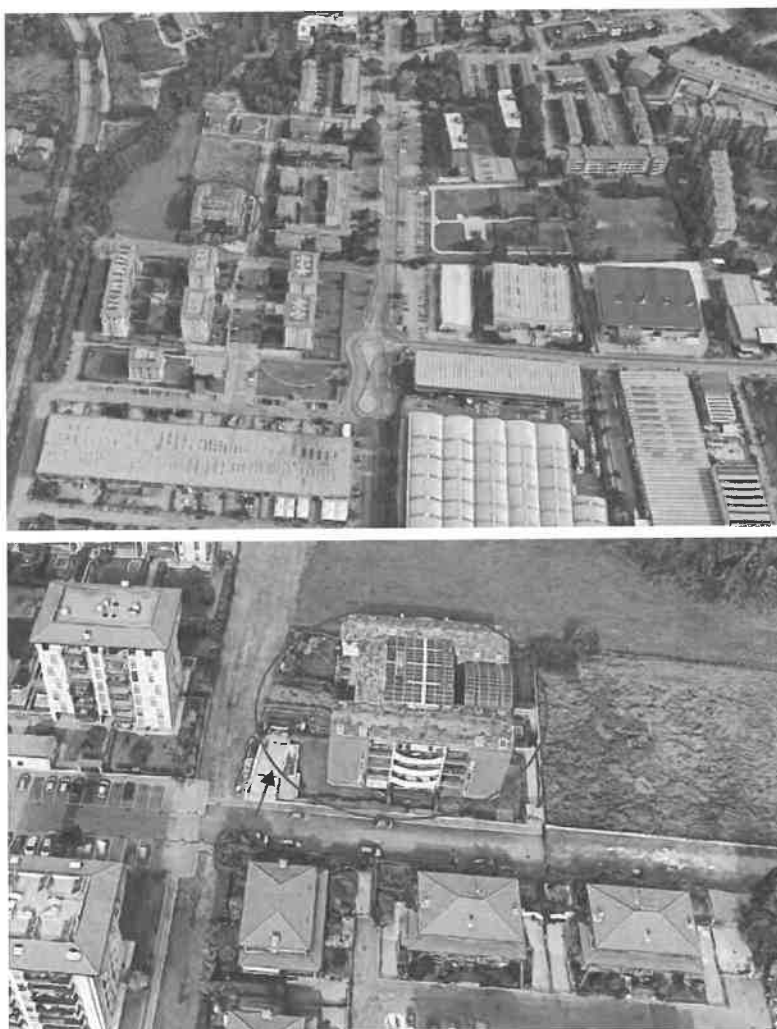
Inquadramento territoriale - vista dell'area e individuazione fabbricato e accesso carrabile

- strade: SP175 Via De Gasperi - distanza 450 m; SP119 Garbagnate/Nova Milanese - distanza 800 m.