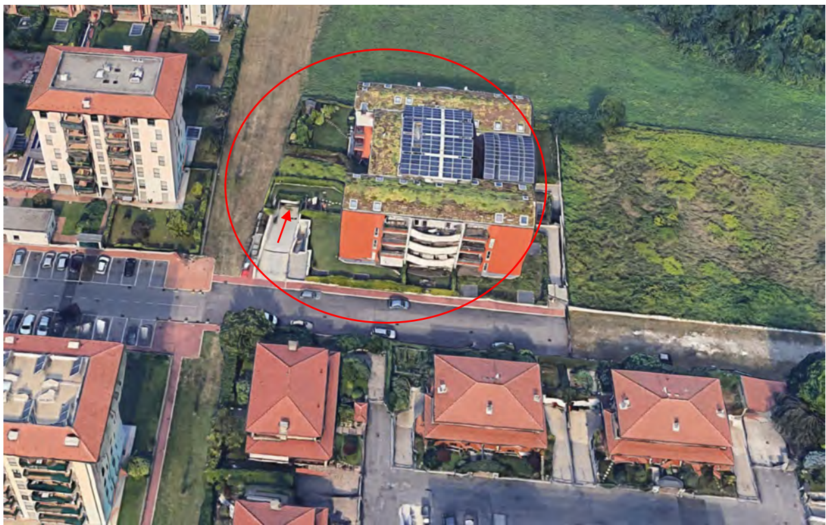
Inquadramento territoriale - vista dell'area e individuazione fabbricato e accesso carrabile