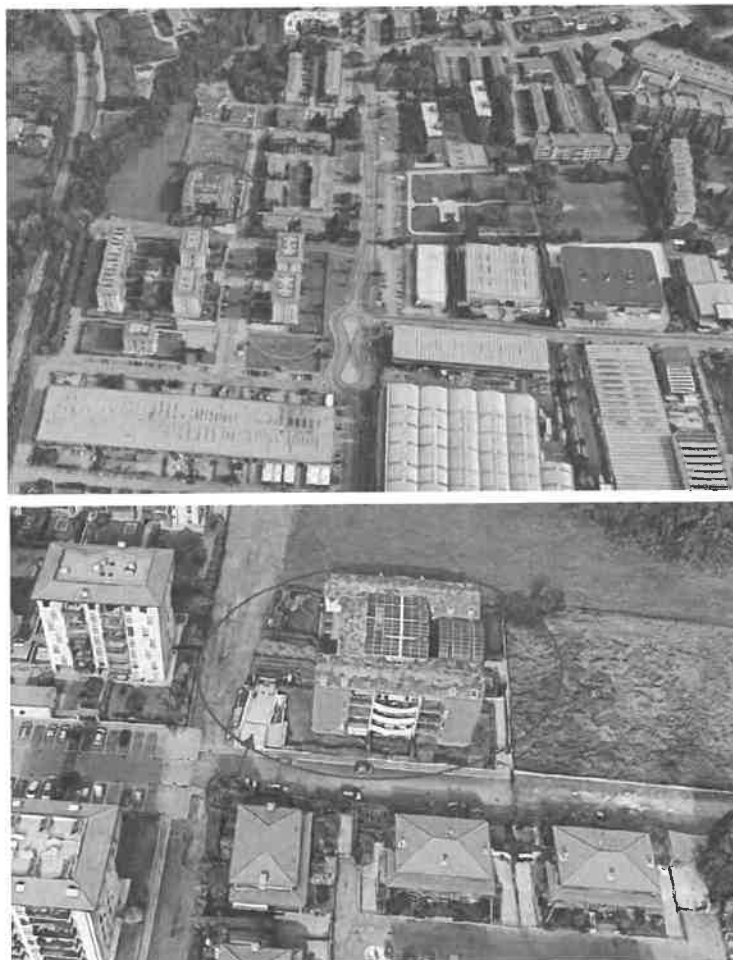
Inquadramento territoriale - vista dell'area e individuazione fabbricato e accesso carrabile