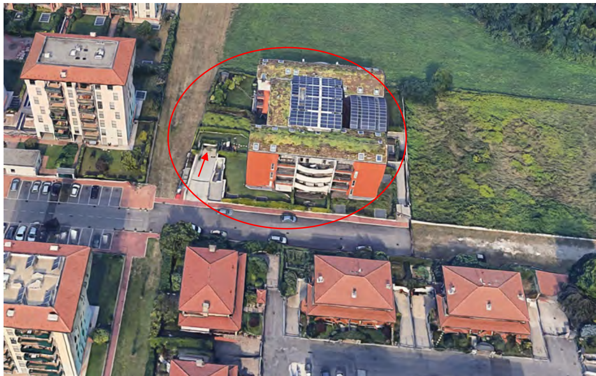
Inquadramento territoriale - vista dell'area e individuazione fabbricato e accesso carrabile