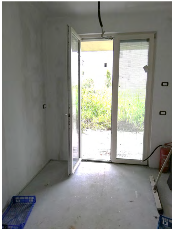
Soggiorno lato giardino