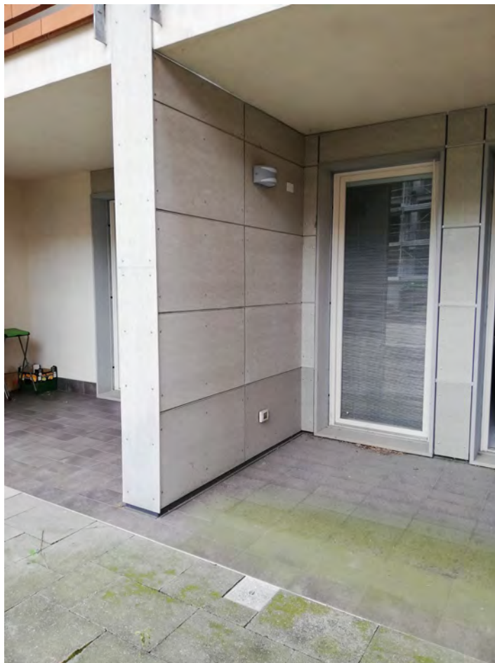
Portico pertinenza lato cortile