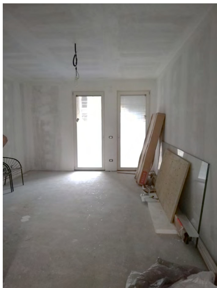
Soggiorno lato portico cortile