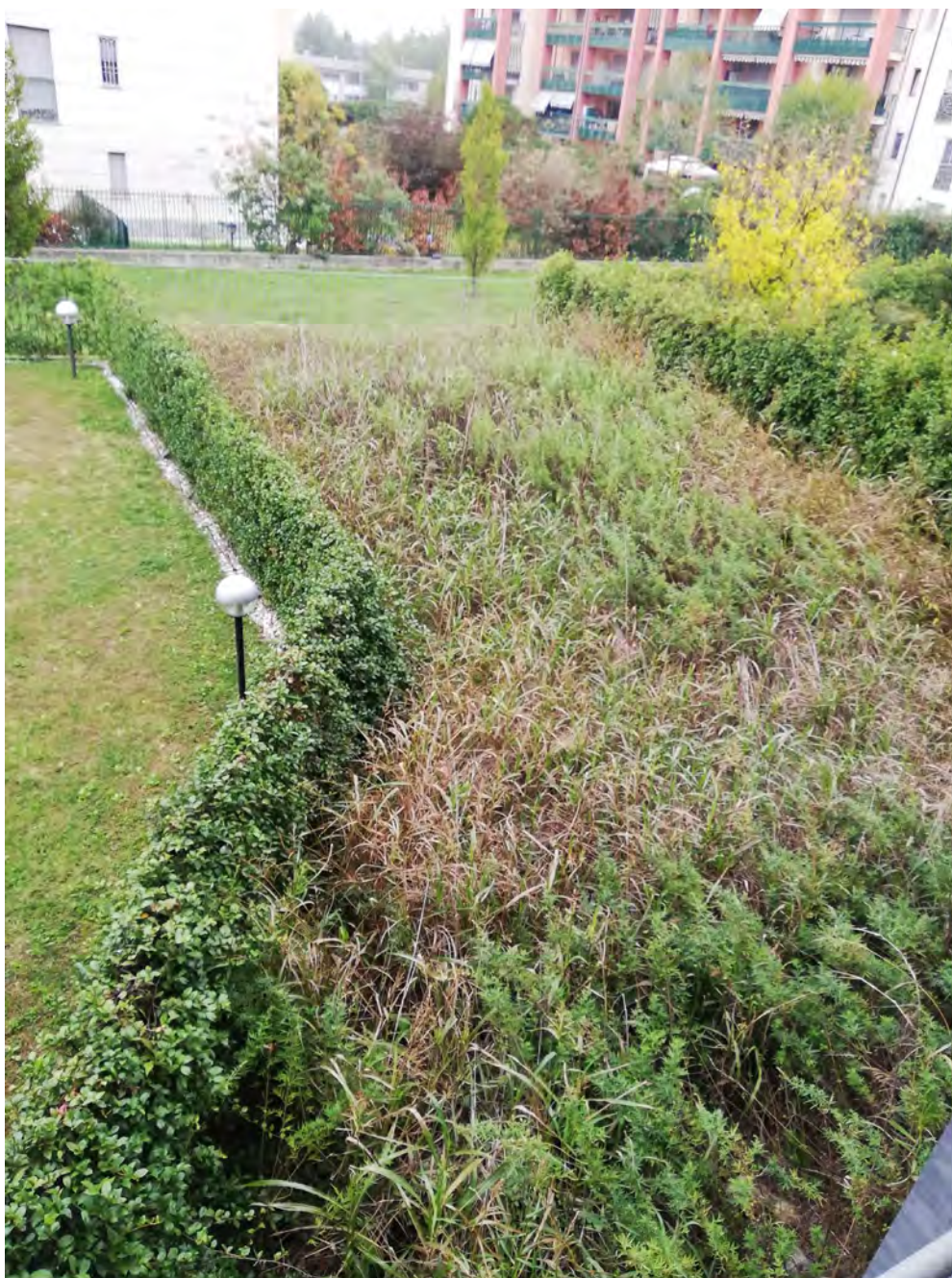
Vista del giardino di pertinenza