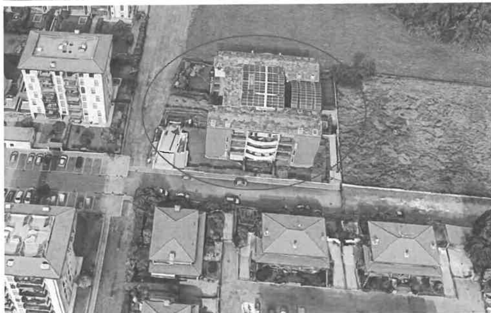
Inquadramento territoriale - vista dell'area e individuazione fabbricato e accesso carrabile