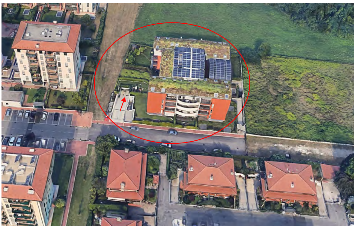
Inquadramento territoriale - vista dell'area e individuazione fabbricato e accesso carrabile