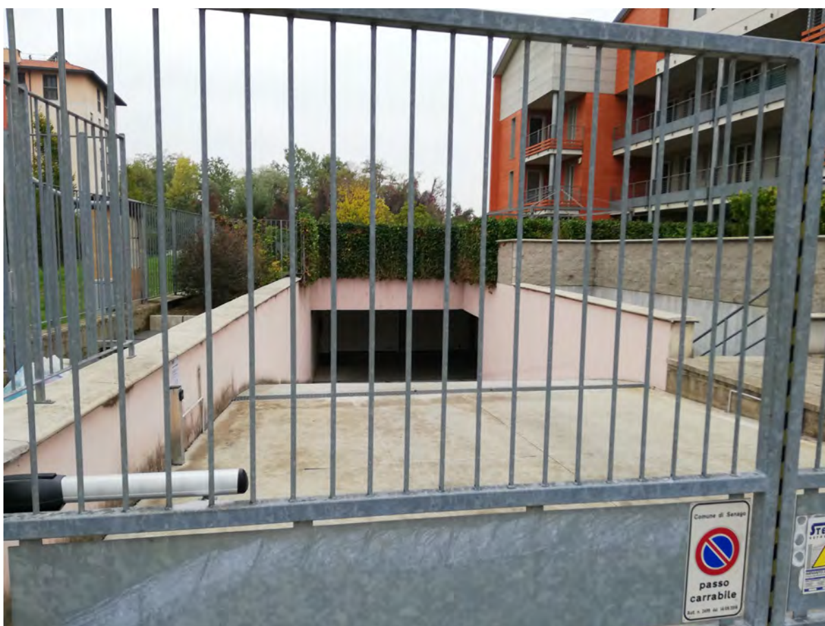
Accesso carrabile da via Londra