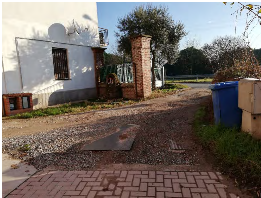
Ingresso da via dei Patrioti, 121