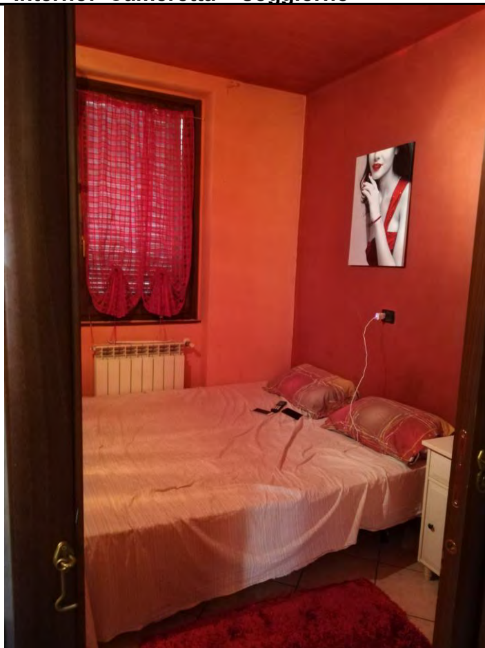
- Interno: Cameretta - soggiorno