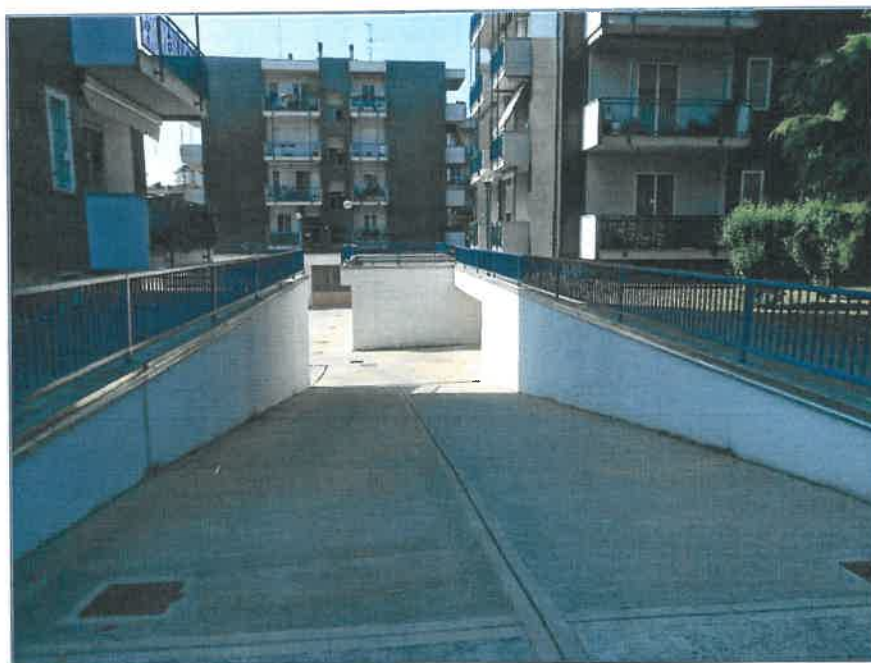
Foto 1 rampa carrabile