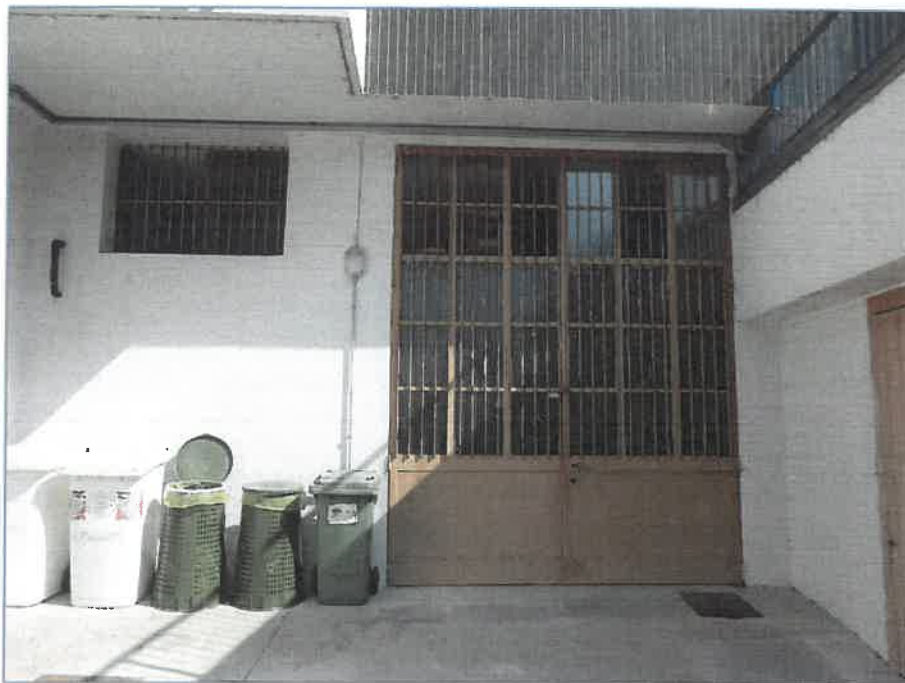
Foto 3 ingresso al magazzino