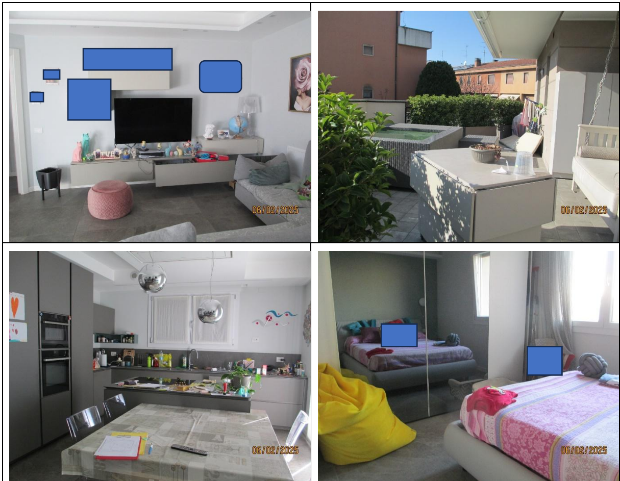
Alcune immagini esemplificative dell'appartamento e si rimanda all'allegato Rilievo Fotografico per ulteriori immagini

Si evidenzia che l'appartamento è in Classe Energetica A4, dotato ventilazione meccanizzata, riscaldamento a pavimento e raffrescamento