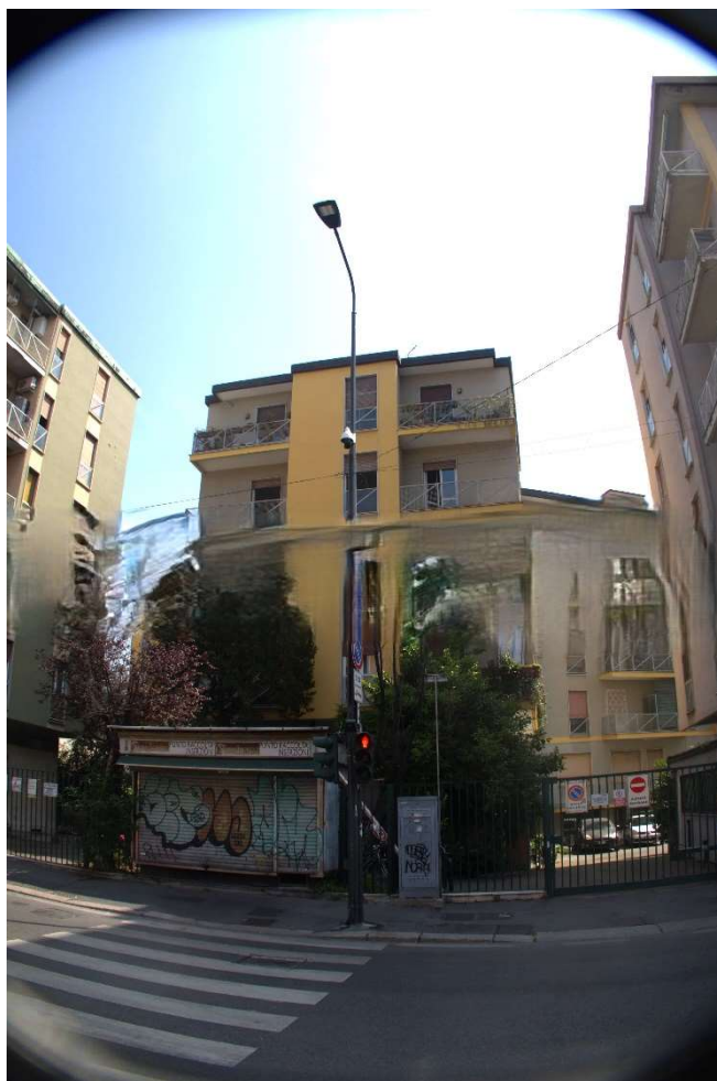
STABILE DI VIA PELLEGRINO ROSSI 42