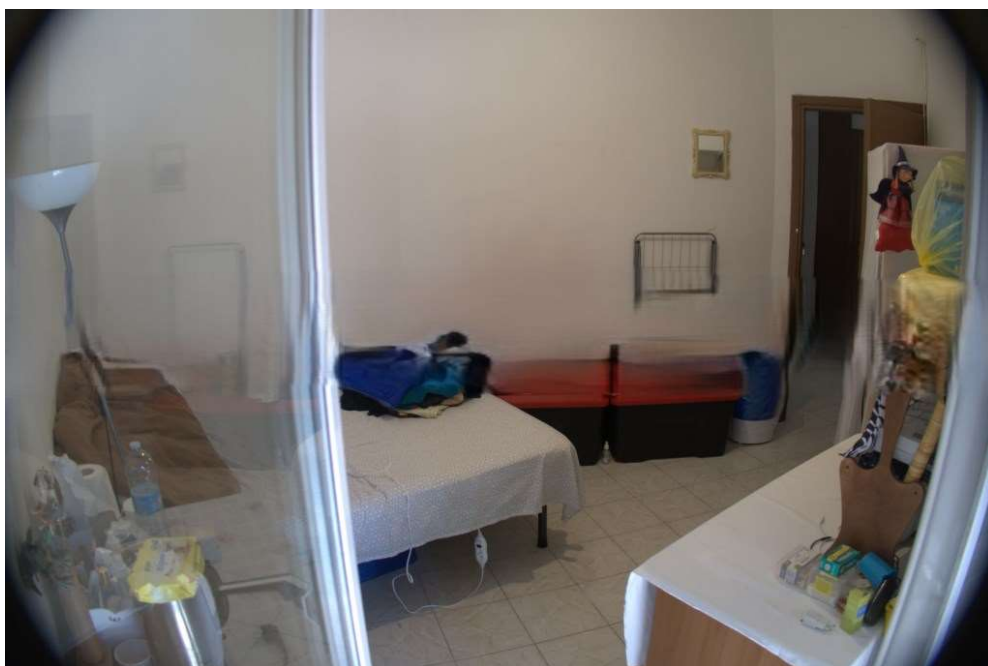
CAMERA CON BALCONE