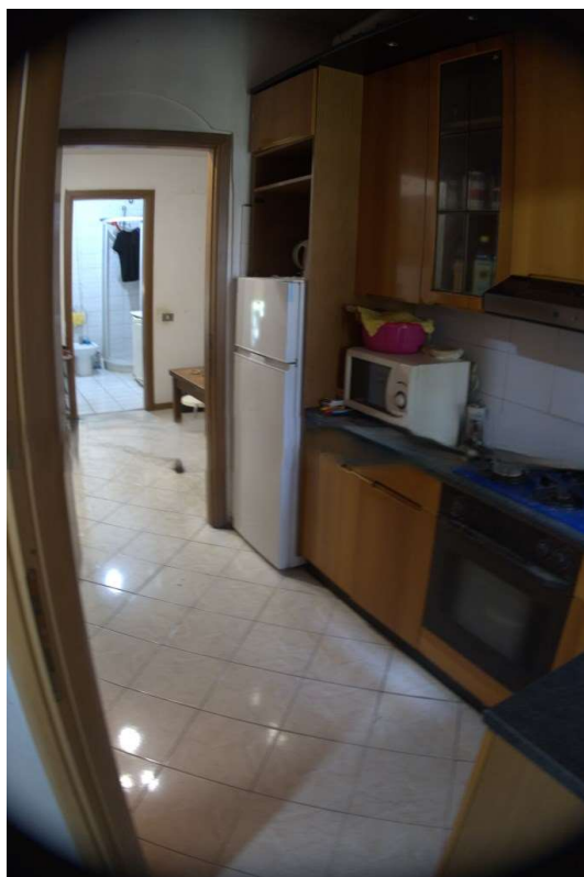
SPAZIO DI COTTURA