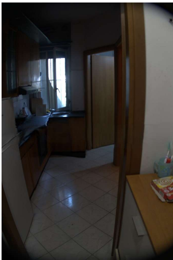
SPAZIO DI COTTURA