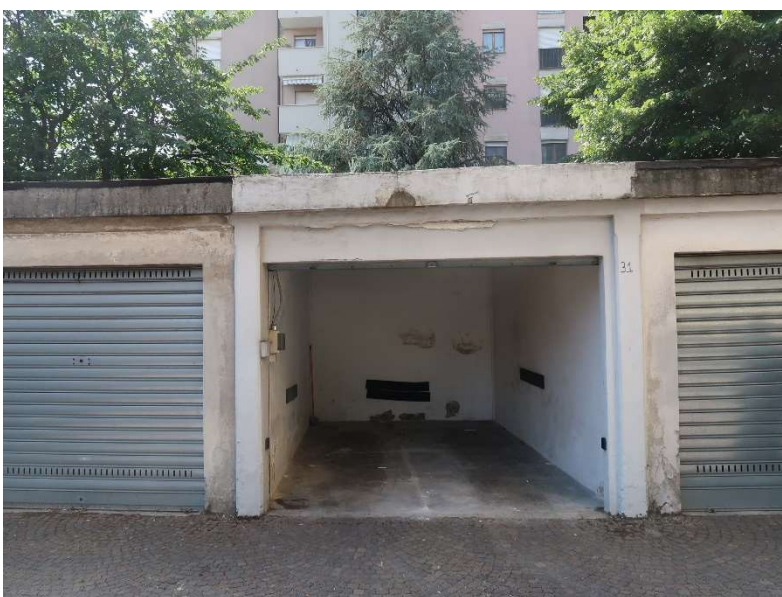
BOX SUB. 31