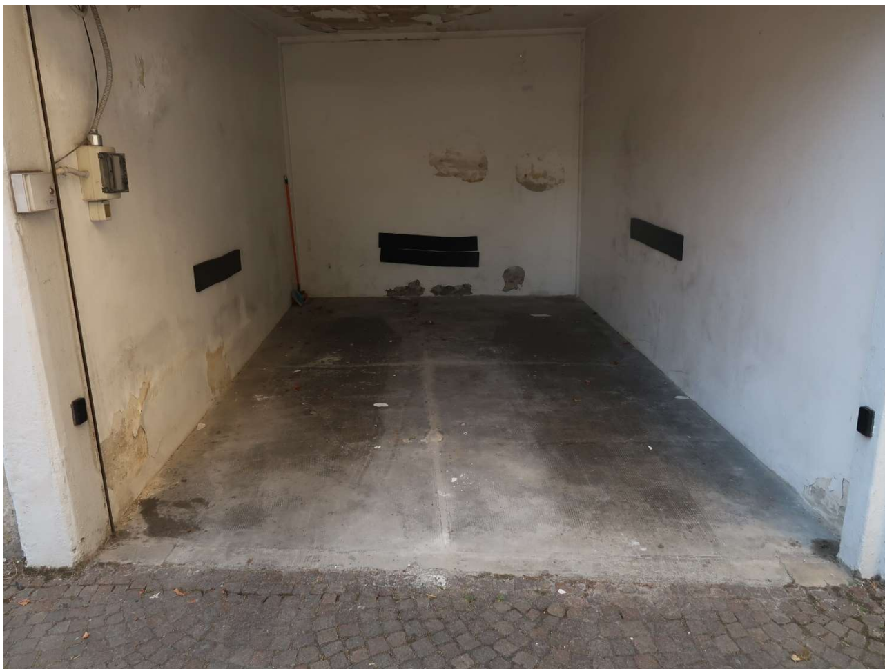
INTERNO BOX SUB. 31