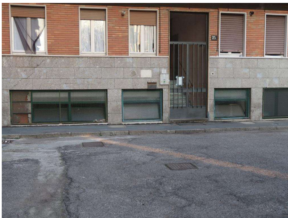
FINESTRE SU CORTILE AL PIANO TERRA