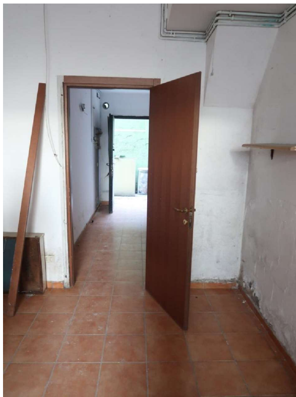
DISIMPEGNO D' INGRESSO