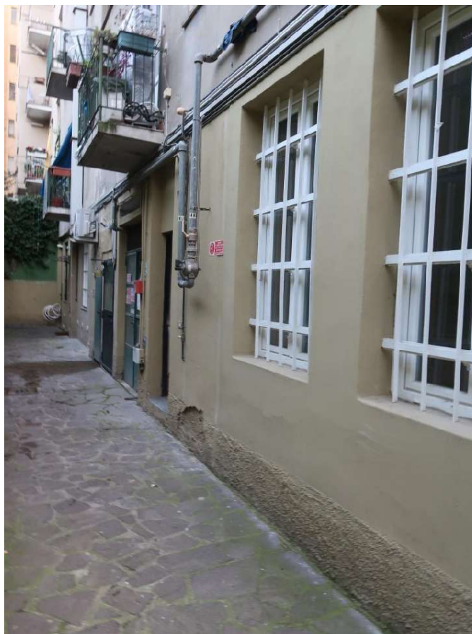
FACCIATA SU CORTILE AL P. SEMINTERRATO