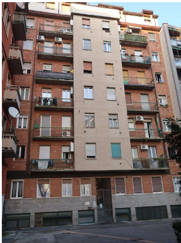
FACCIATA CONDOMINIO SU CORTILE AL P. TERRA