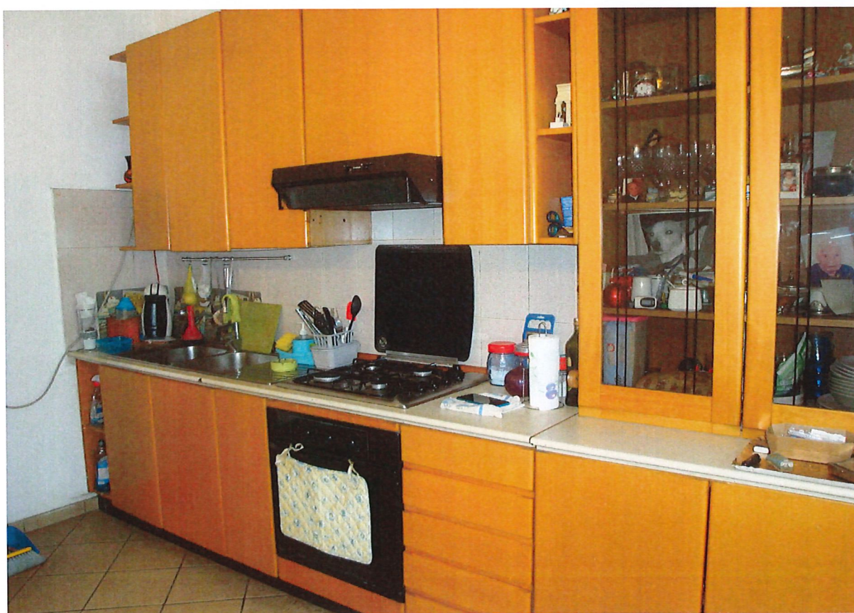
R.G.E. 687/2024 G. E. Dott.ssa M. Galioto Limbrate, Via Macchiavelli n.°19, piano 1°-S1, Foglio 38, mapp. 113, sub. 5 Prospetti interni: la cucina con il balcone che affaccia sulla Via Macchiavelli