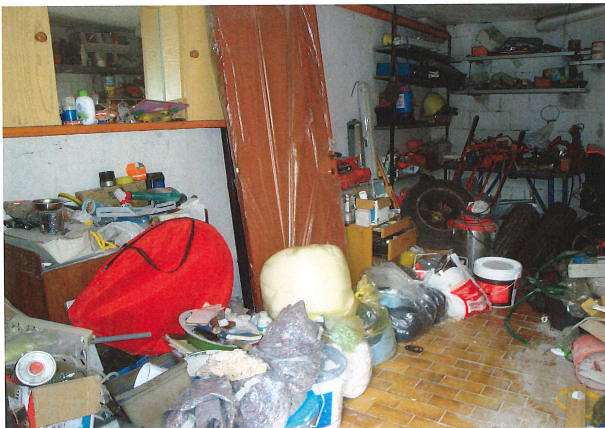
R.G.E. 687/2024 G. E. Dott.ssa M. Galioto Limbate, Via Macchiavelli n.°19, piano S1, Foglio 38, mapp. 113, sub. 517 Prospetti esterni e interni: il box con accesso dal cortile condominiale