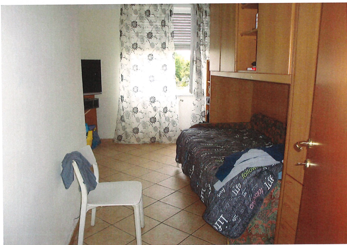
R.G.E. 687/2024 G. E. Dott.ssa M. Galioto Limbrate, Via Macchiavelli n.°19, piano 1°-S1, Foglio 38, mapp. 113, sub. 5 Prospetti interni: il locale con balcone e la camera singola con affaccio sul cortile interno