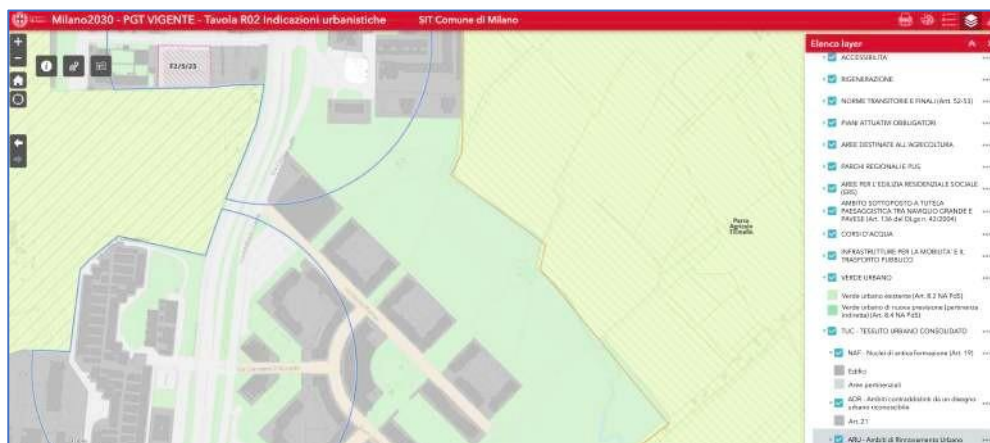
Img. 6 _ Stralcio del PGT _ Comune di Milano