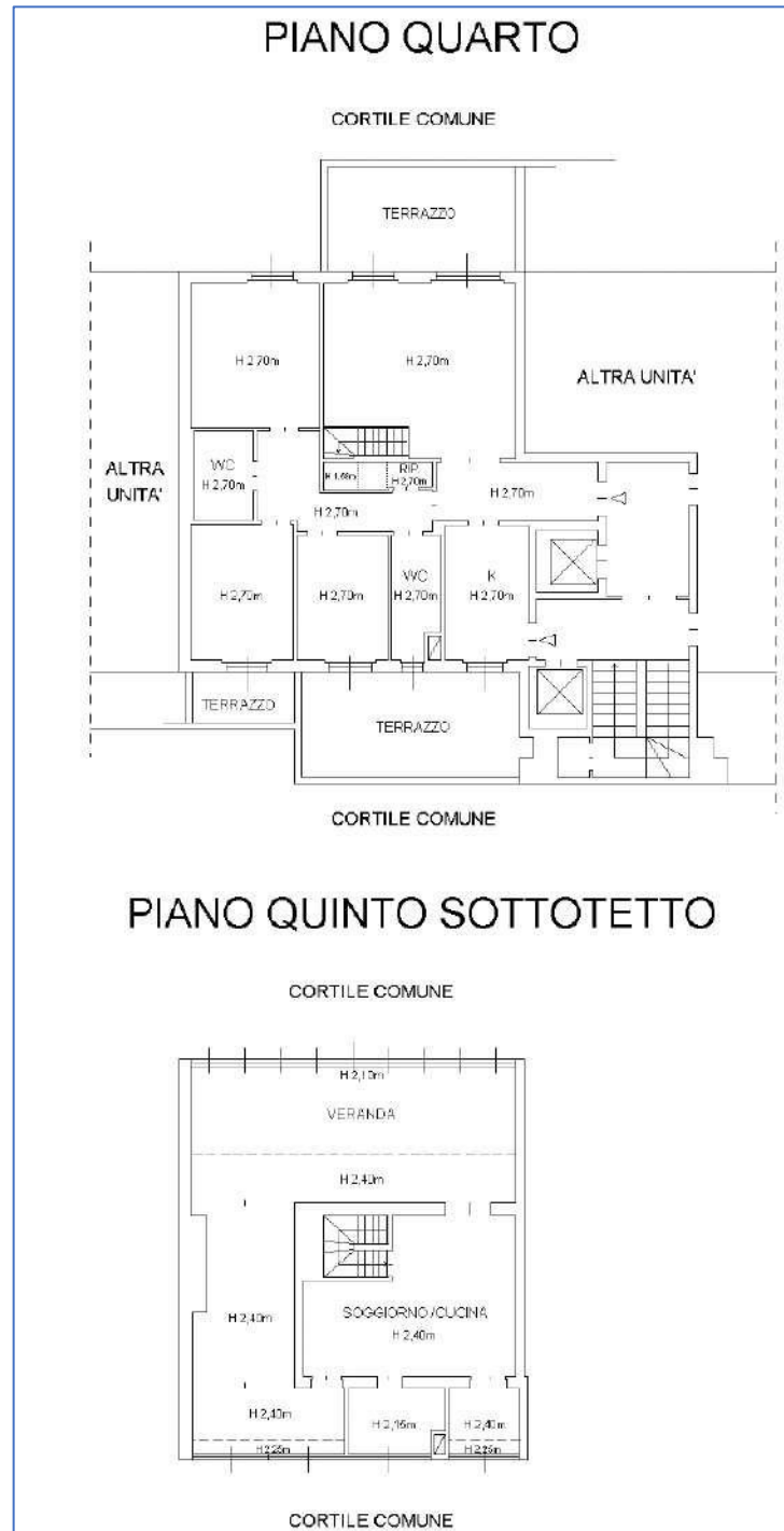
Img. 1 _ rappresentazione grafica della planimetria catastale