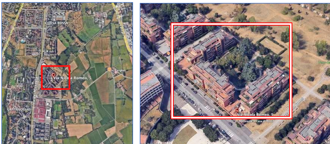
Img. 3 - 4 _ Individuazione tramite l'ausilio di Google earth