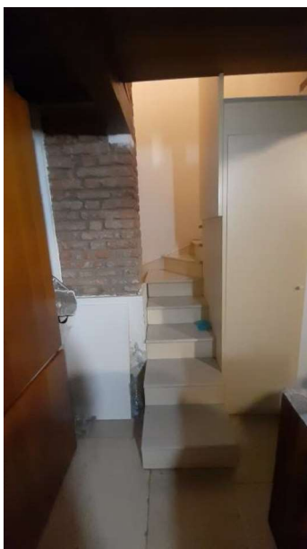
SCLA DI COLLEGAMENTO TRA P.T. E RIPOSTIGLIO IN QUOTA