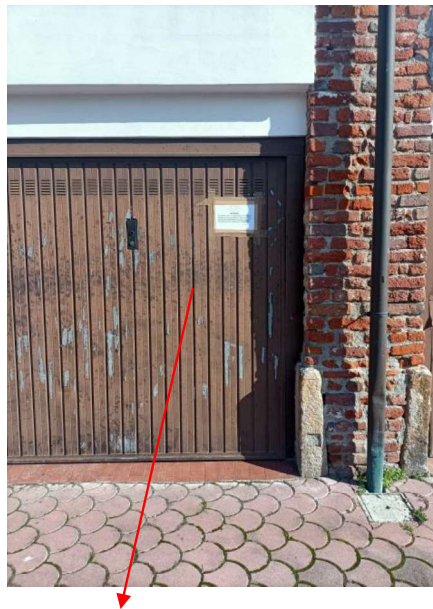
SUB 796 SARACINESCA INGRESSO