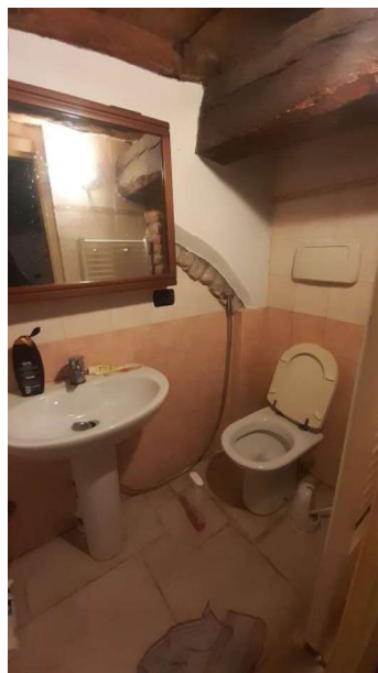
RIPOSTIGLIO IN QUOTA ATTREZZATO A WC ABUSIVO