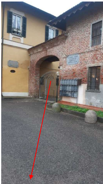
VIA BUDRIO 40

MILANO (MI) – VIA BUDRIO , 40/42 – DATA SOPRALLUOGO 17/10/2024 LABORATORIO P.T - FG. 367, PART. 1, SUB. 709