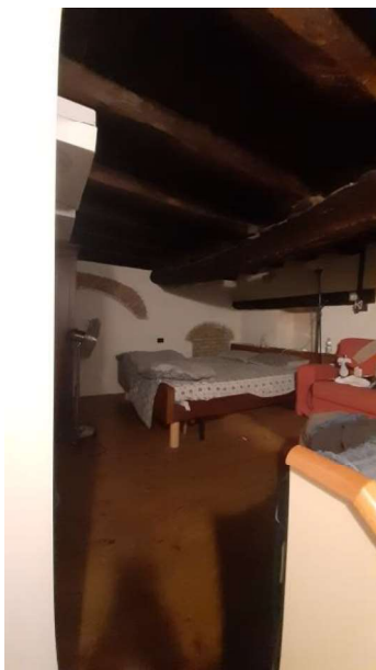
RIPOSTIGLIO IN QUOTA USATO ABUSIVAMENTE COME CAMERA