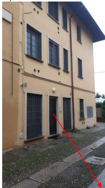
INGRESSO LABORATORIO SUB 709