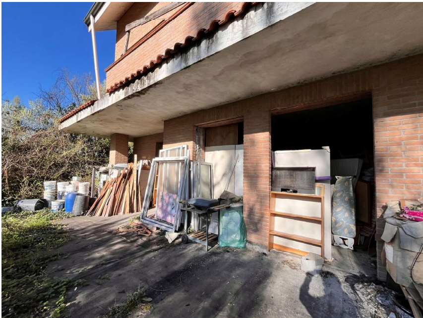
Immagine 40. La zona del piano terra e gli affacci predisposti verso il giardino