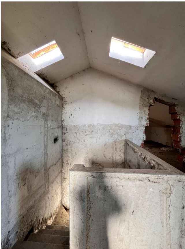
Immagine 48, Immagine 49. Immagine 50. Dal primo piano si sviluppa una seconda rampa di scale che porta al secondo piano – sottotetto.