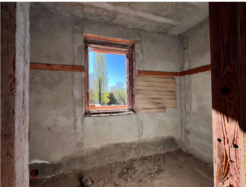
Immagine 46. Piccolo locale al primo piano, verosimilmente pensato come secondo bagno.