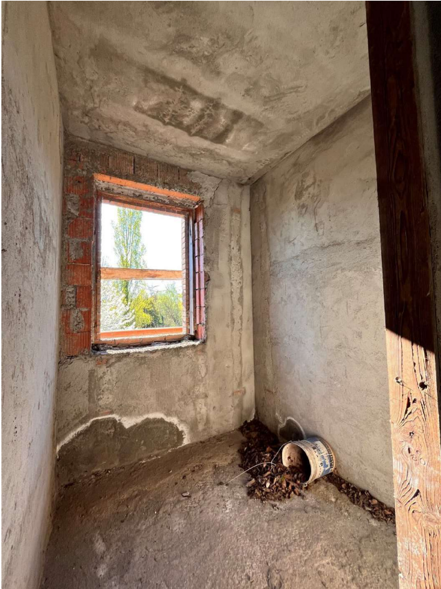
Immagine 45. Piccolo locale al primo piano, verosimilmente pensato come bagno.