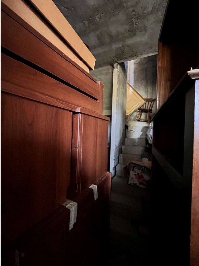
Immagine 41. Vista interna del locale a cui si accede direttamente dal giardino. Attualmente il locale risulta al rustico e ingombro di cose. Sul fondo si nota la rampa di scale che consente di sbarcare al primo piano.