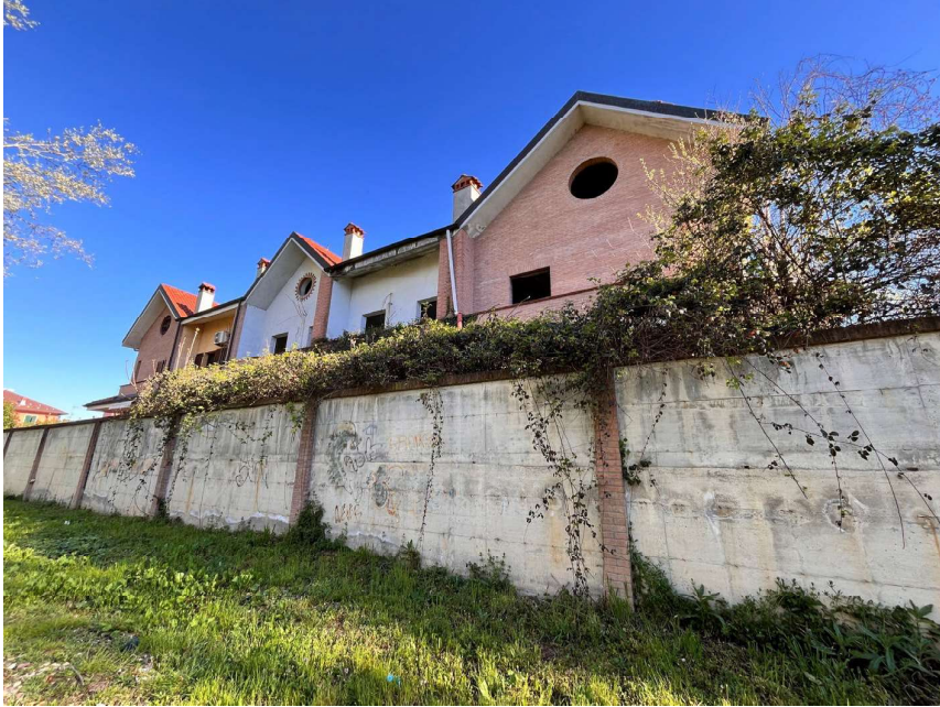
Immagine 39. Vista dal retro.