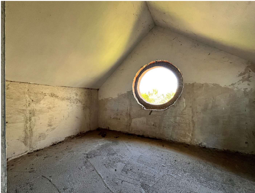
Immagine 52. Lo spazio al piano sottotetto. Il secondo locale.

Lotto 2, Corpo 2, Mappale 94, Subalterno 702. Non visionato.