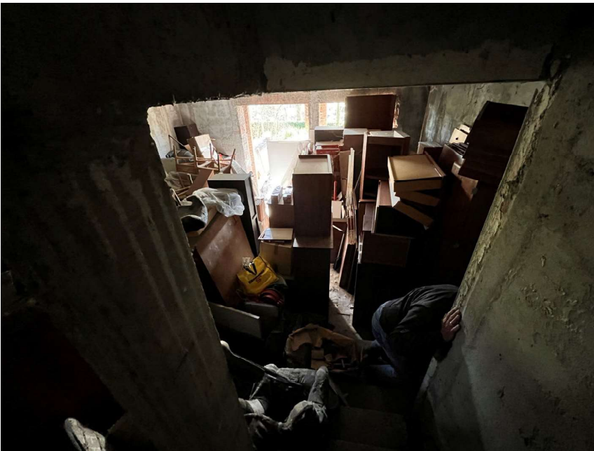
Immagine 42. Vista dello stesso locale dalla rampa di scale.