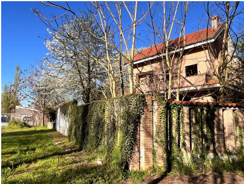
Immagine 37. Nell'ambito delle villette a schiera di via Rozzano a Assago ve ne sono alcune, tra cui quella oggetto di rilievo fotografico, che, allo stato attuale, risultano non finite. Vista della villetta di testa sul lato opposto del lotto rispetto all'unità 1.

Lotto 2, Corpo 1, Mappale 94, Subalterno 701.