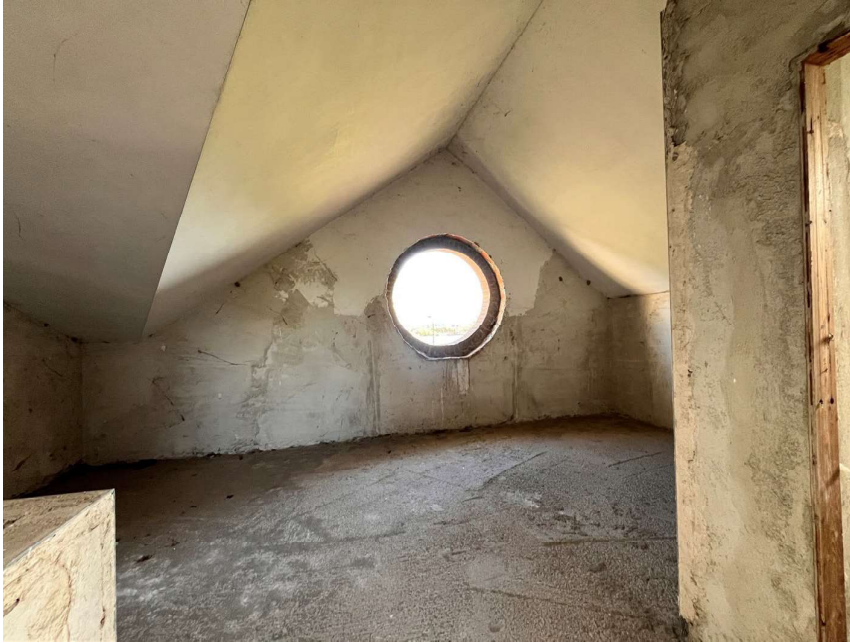
Immagine 51. Lo spazio al piano sottotetto. Uno dei locali.