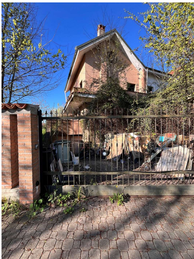
Immagine 38. Vista del cancello di ingresso.

Immagine 37. Nell'ambito delle villette a schiera di via Rozzano a Assago ve ne sono alcune, tra cui quella oggetto di rilievo fotografico, che, allo stato attuale, risultano non finite. Vista della villetta di testa sul lato opposto del lotto rispetto all'unità 1.