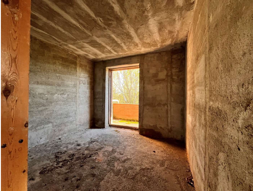
Immagine 43. Il primo piano suddiviso in locali si presenta al rustico e, compatibilmente con lo stato attuale, si presenta in buone condizioni e vuoto.