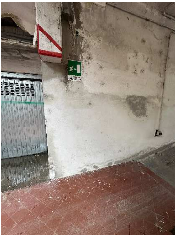
12. Vista dei segni lasciati dalla presenza di acqua nelle parti comuni.