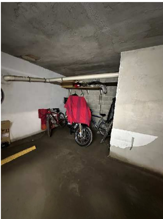
11. Vista interna.