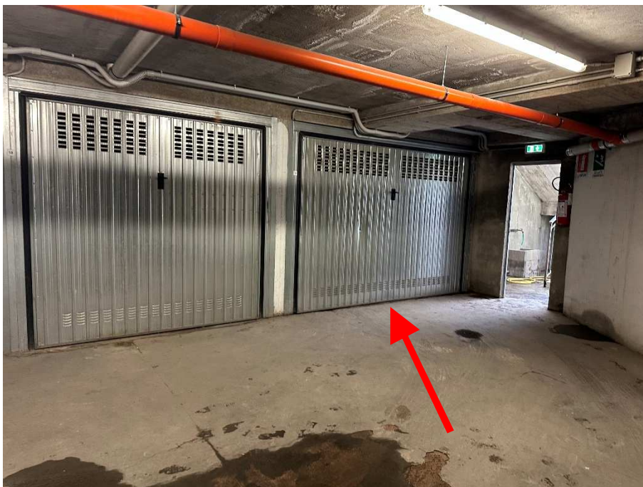
9. Individuazione dell'autorimessa.