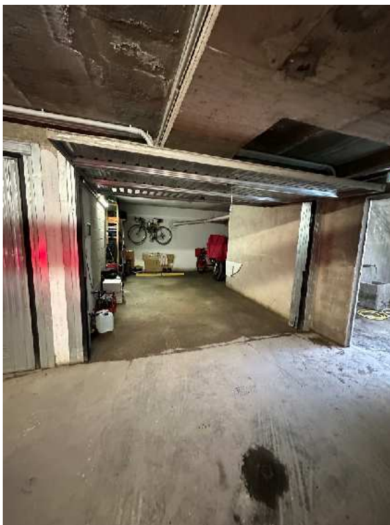
10. Vista interna.