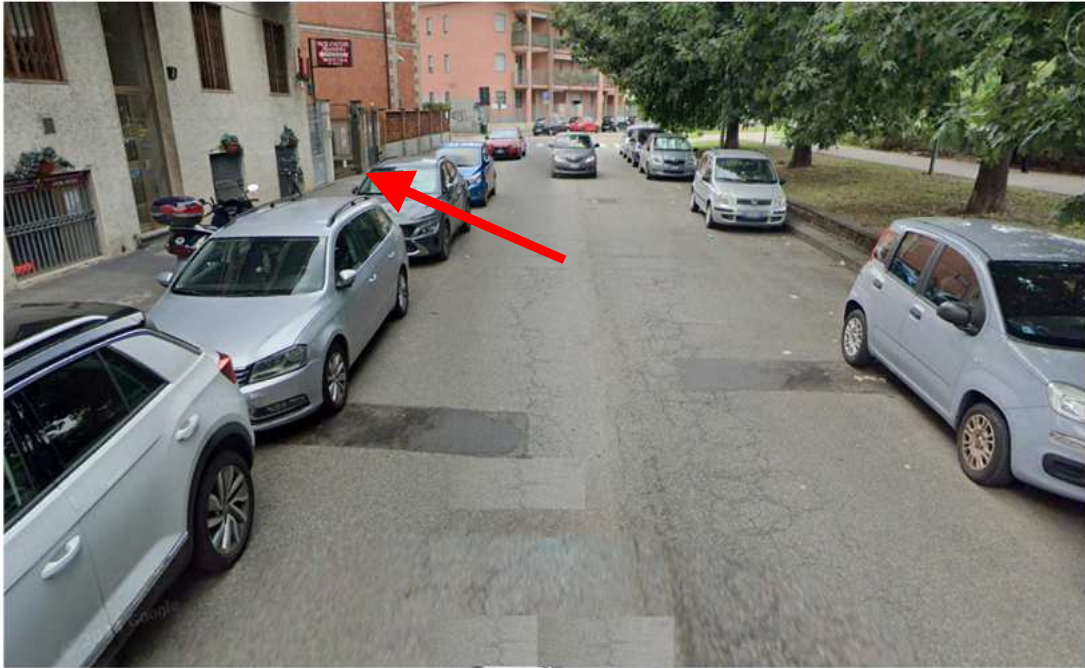
1. Rilievo fotografico del contesto. Individuazione dell'accesso carrabile sulla via Trescore.