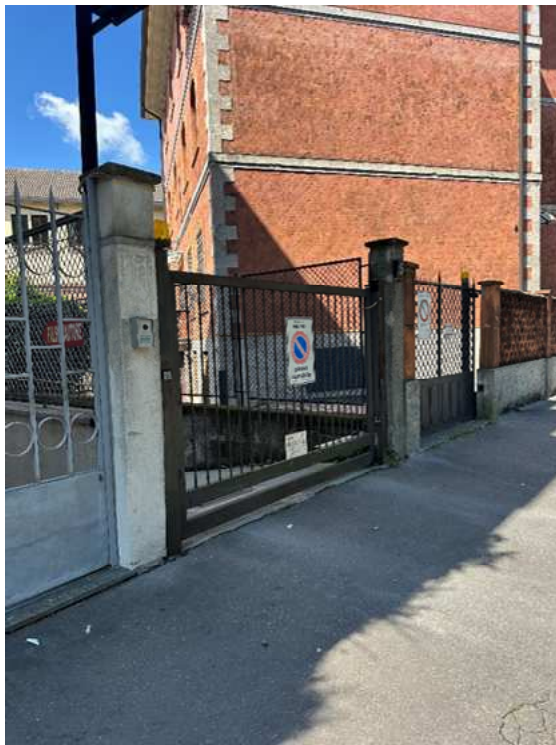
2. Dettaglio dell'accesso carrabile.