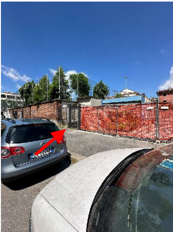
5. Rilievo fotografico del contesto. Individuazione dell'accesso pedonale sulla via Taormina.