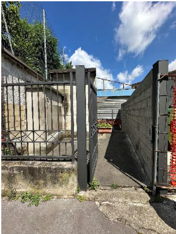
6. Dettaglio dell'accesso pedonale.