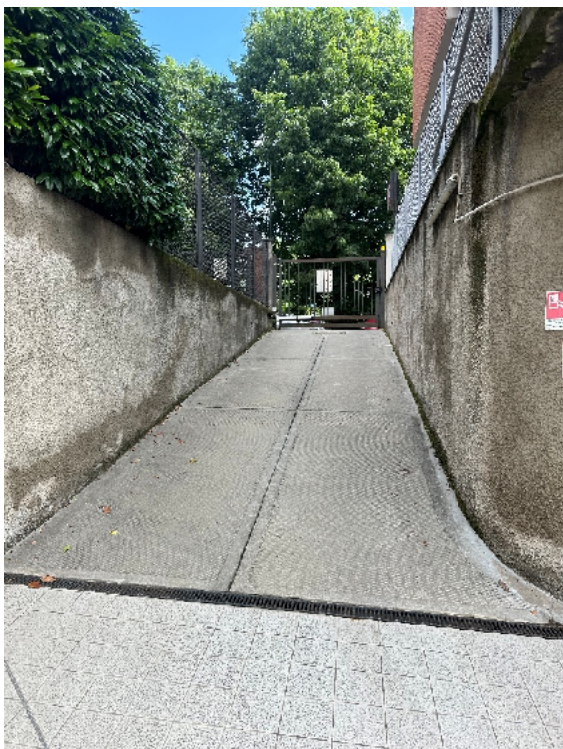
3. Dettaglio della rampa.