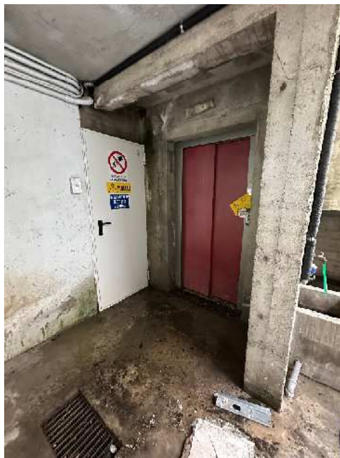
8. Dettagli dell'ascensore comune, a piano strada e nell'interrato.