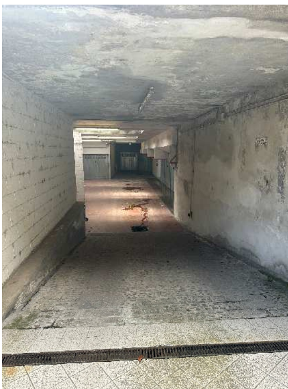
4. Dettaglio della rampa.