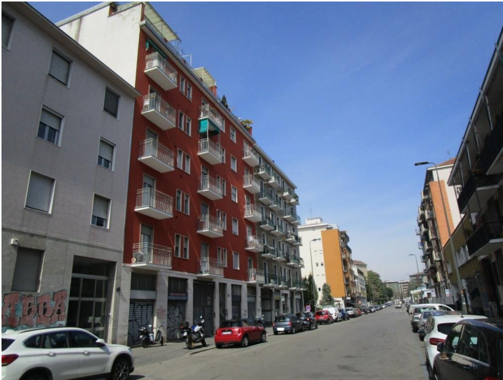
Foto 1 – Vista da via Zuretti dello stabile in cui è ubicata l'unità immobiliare