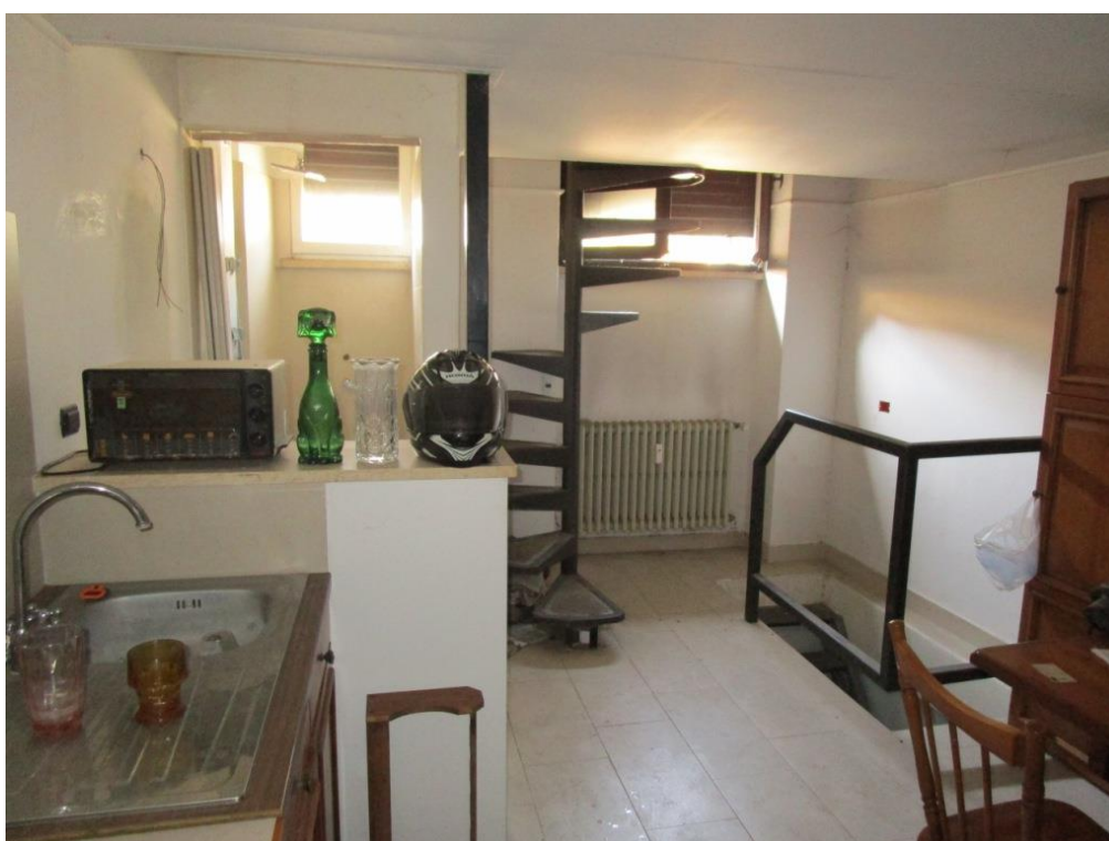
Foto 9 – Vista del negozio verso il servizio igienico e la scala di accesso al soppalco e la scala di accesso alla cantina di pertinenza