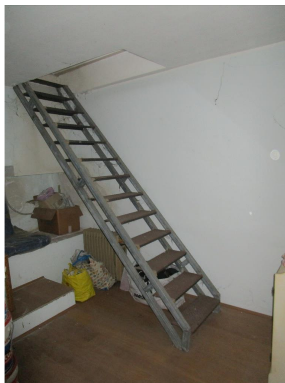
Foto 14/15 – Scala interna di collegamento tra negozio al piano terra e cantina al piano interrato