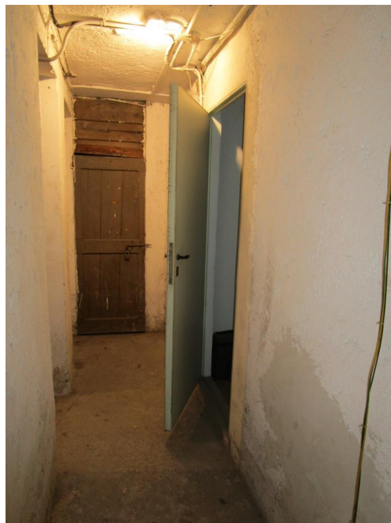
Foto 17 – Ingresso alla cantina dal corridoio comune al piano interrato