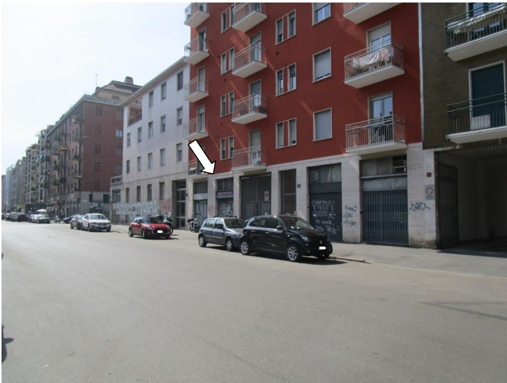
Foto 2 – Vista e indicazione dello stabile in cui è ubicata l'unità immobiliare