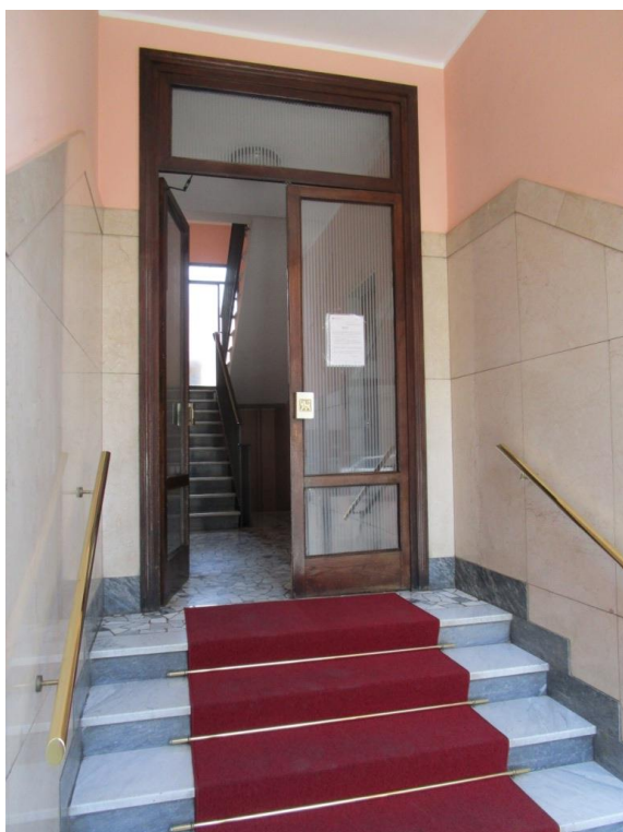
Foto 3 – Vista e inquadramento da via Zuretti, dell'unità immobiliare