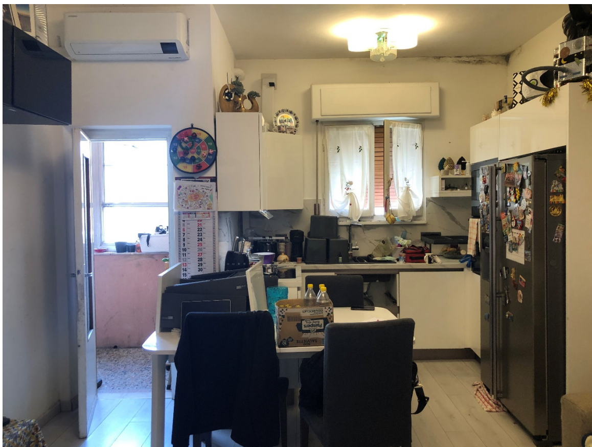
Foto 11 - Soggiorno con cucina a vista