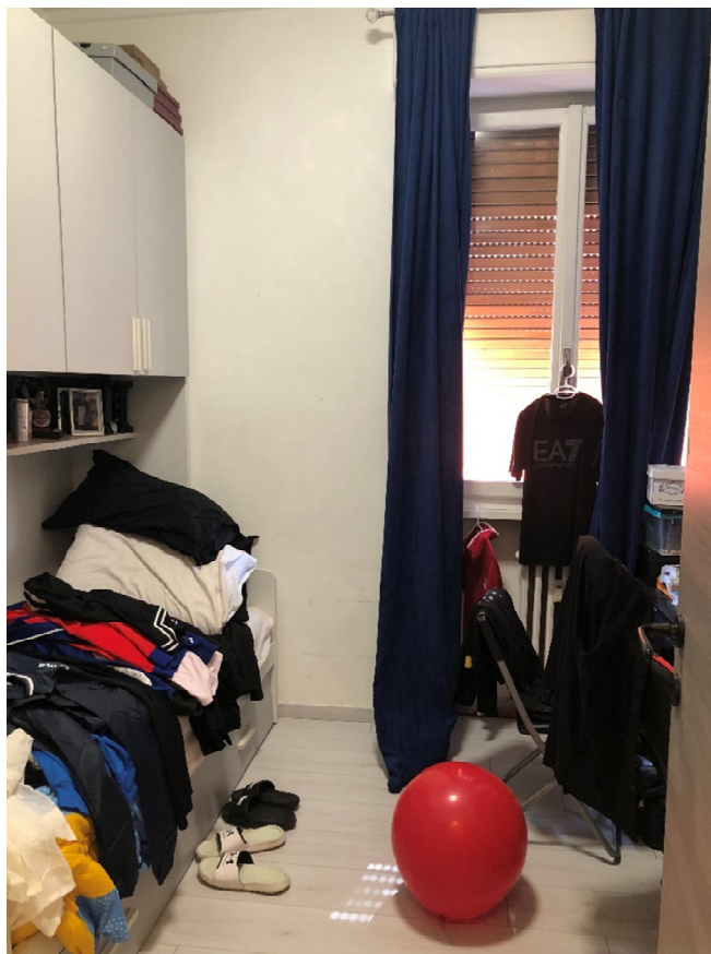
Foto 16 - Camera