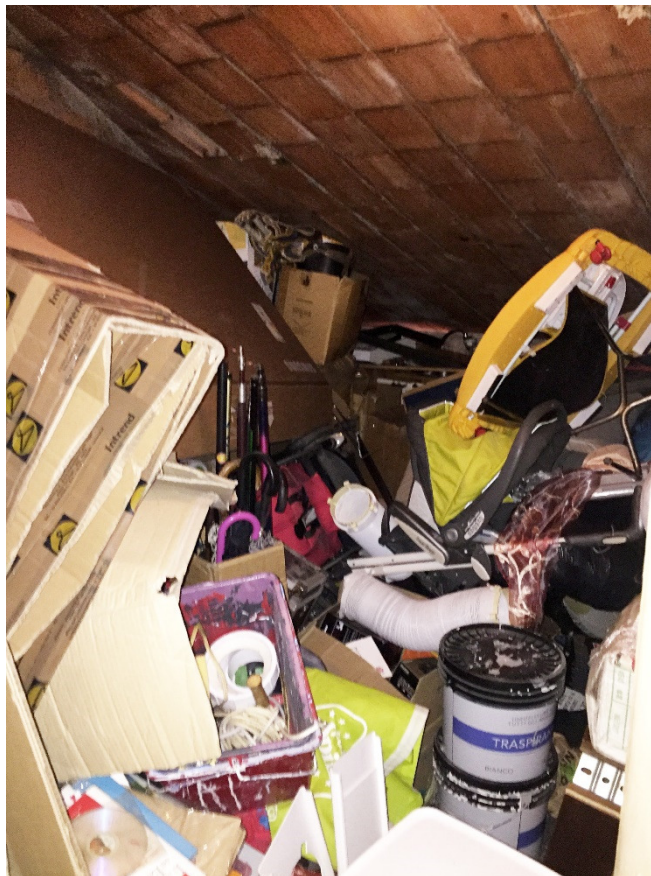
Foto 22 - Solaio