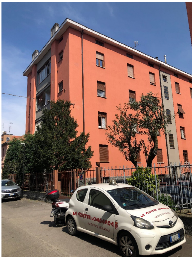
Foto 03 - Il fabbricato su via Arno 19