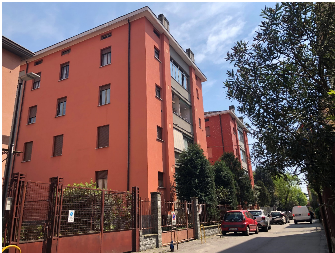
Foto 01 - Il fabbricato in via Arno al civico 19