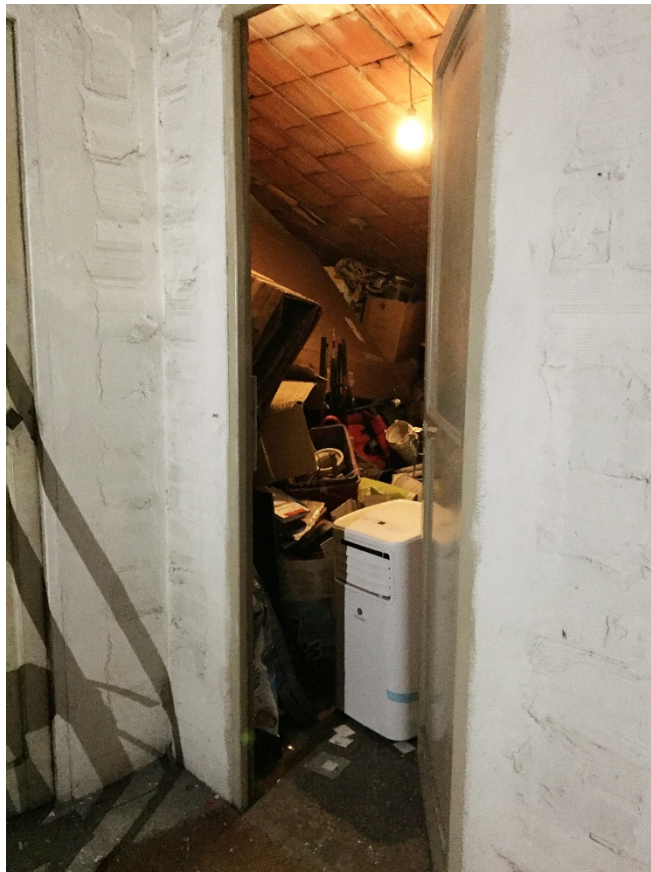
Foto 21 - Solaio