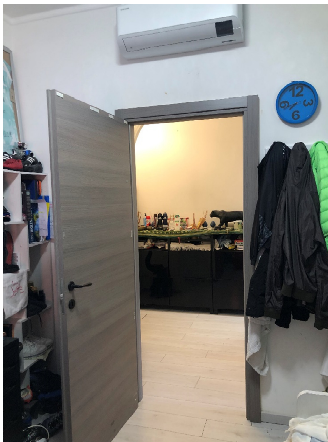
Foto 15 - Camera