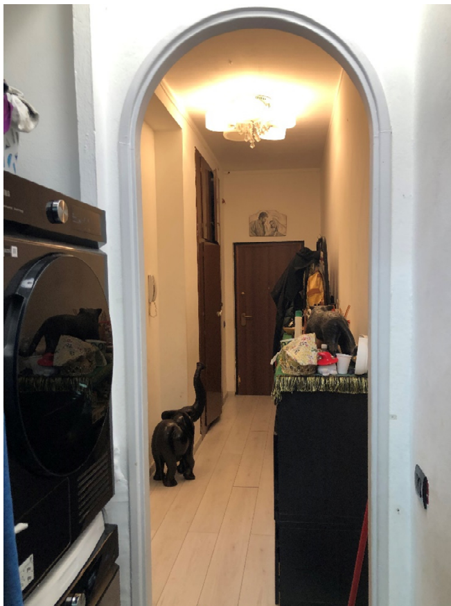
Foto 10 - Antibagno e corridoio