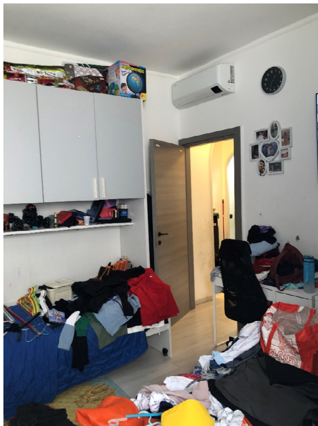
Foto 18 - Camera