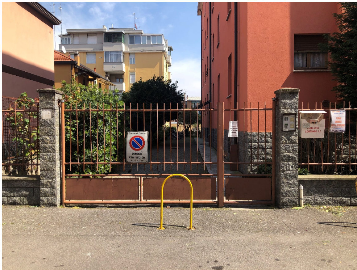
Foto 02 - Accesso al fabbricato da via Arno al civico 19