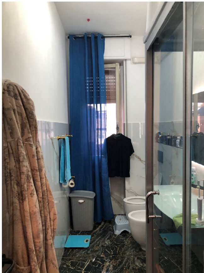
Foto 19 - Bagno