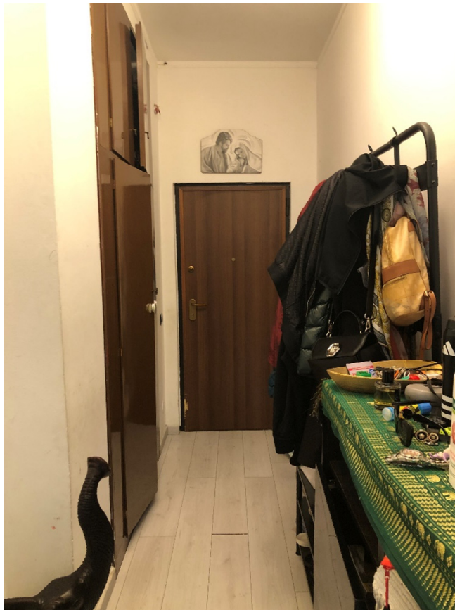
Foto 07 - Ingresso