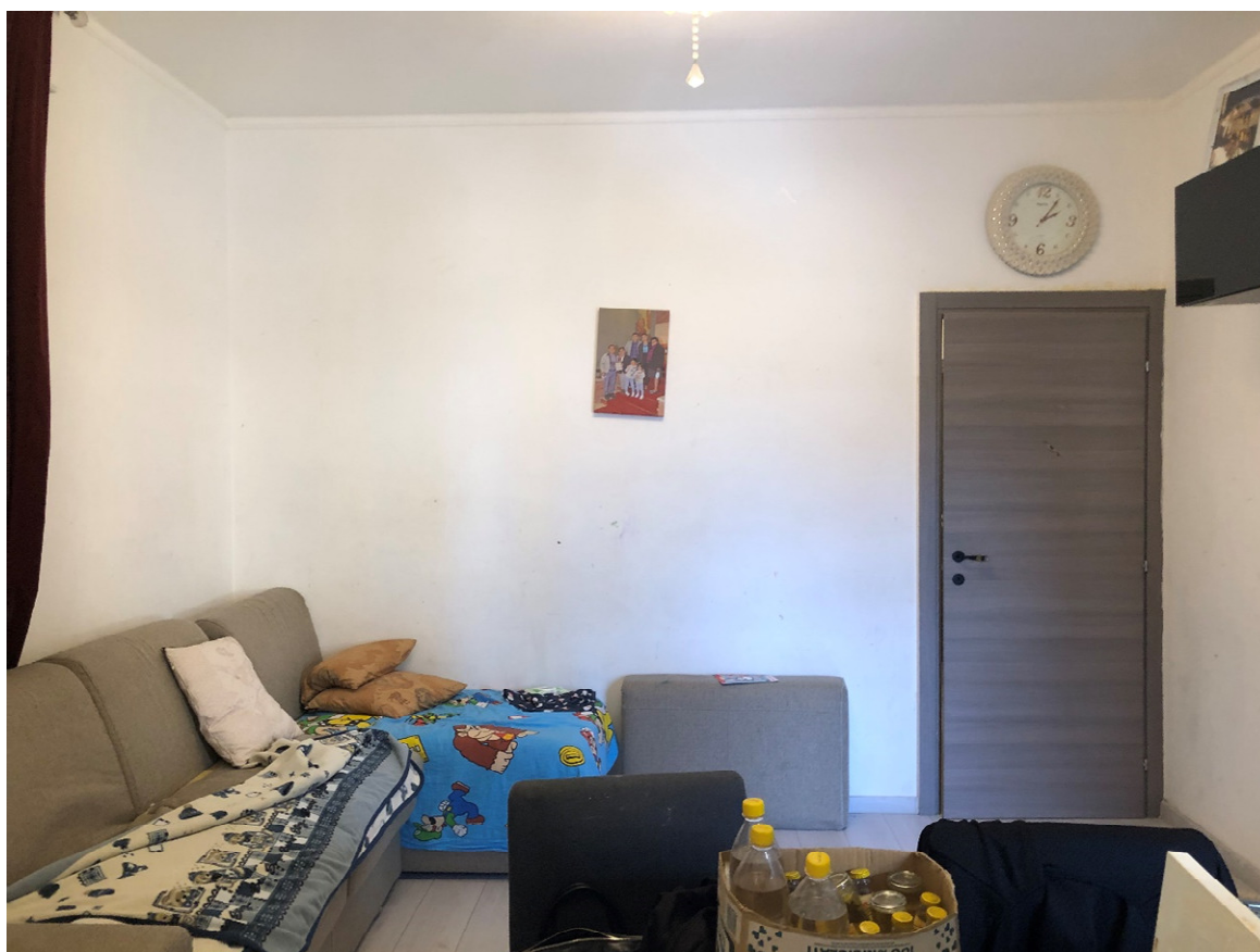
Foto 12 - Soggiorno con cucina a vista