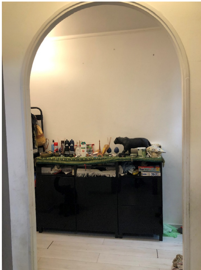
Foto 09 - Disimpegno