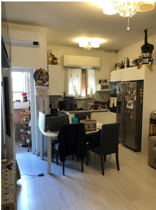
Foto 13 - Soggiorno con cucina a vista