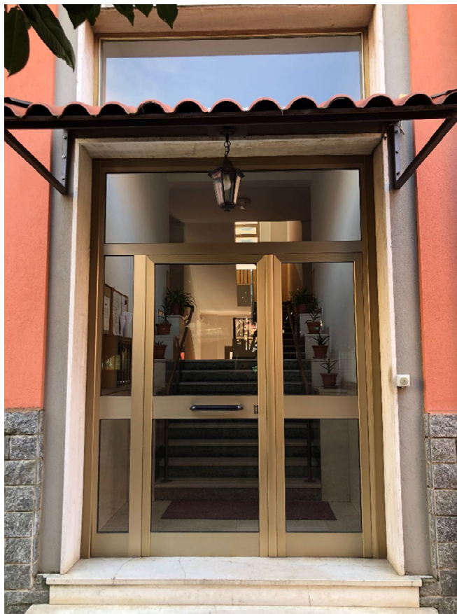
Foto 05 - Accesso al fabbricato dal cortile comune