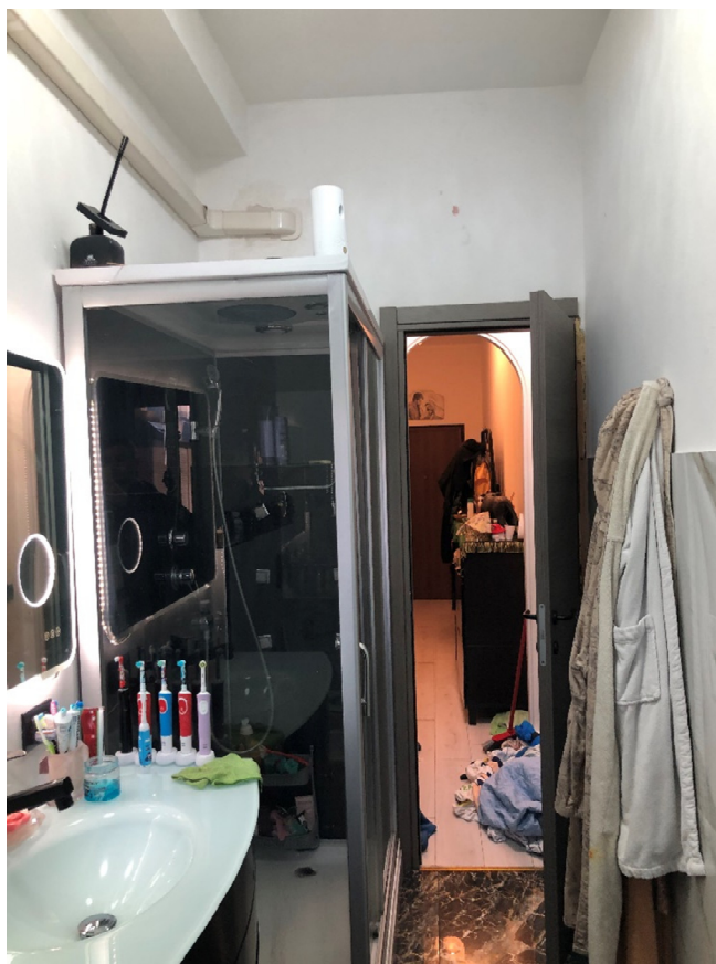
Foto 20 - Bagno