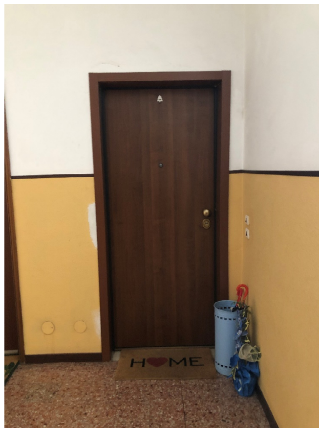
Foto 06 - Ingresso all'unità dal pianerottolo comune