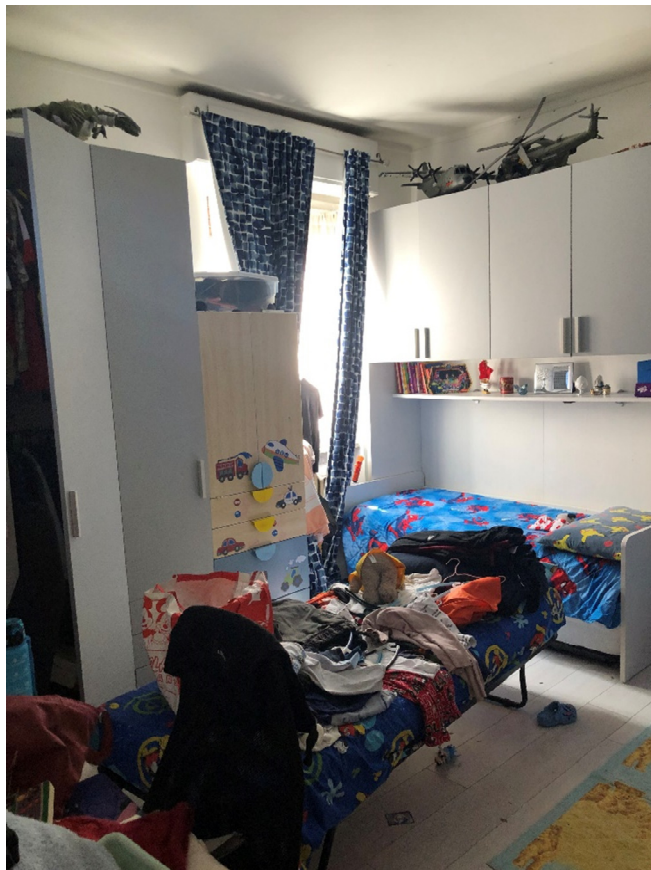
Foto 17 - Camera