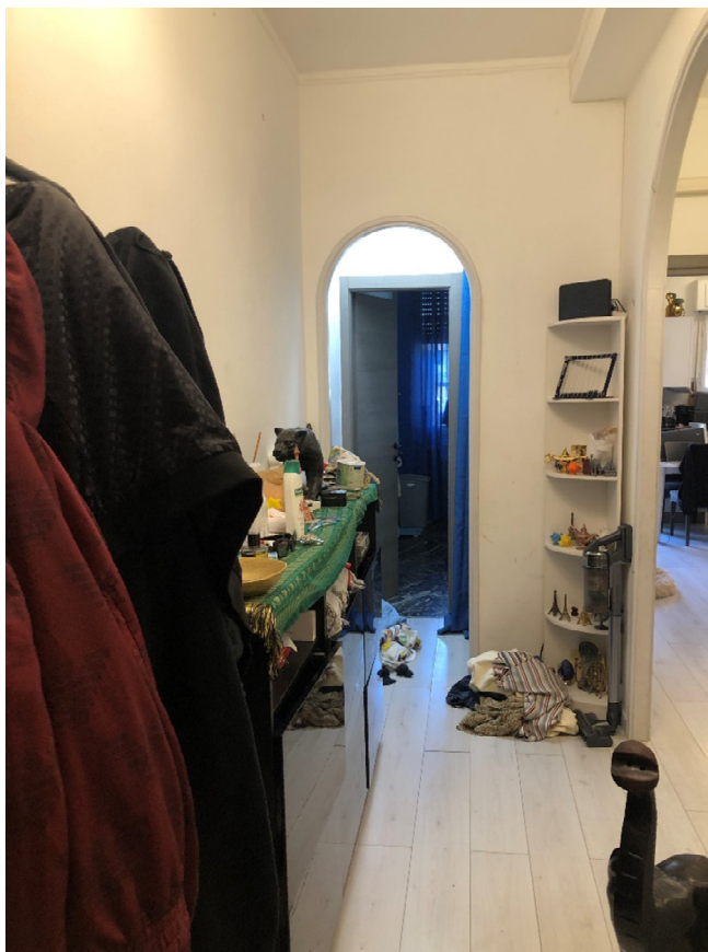
Foto 08 - Corridoio e disimpegno