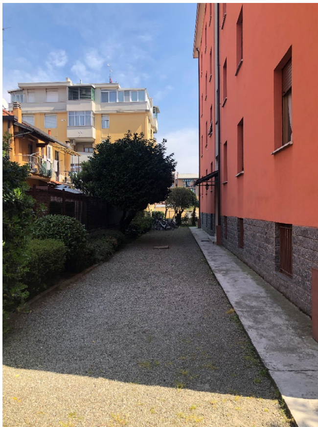
Foto 04 - Il cortile interno del fabbricato