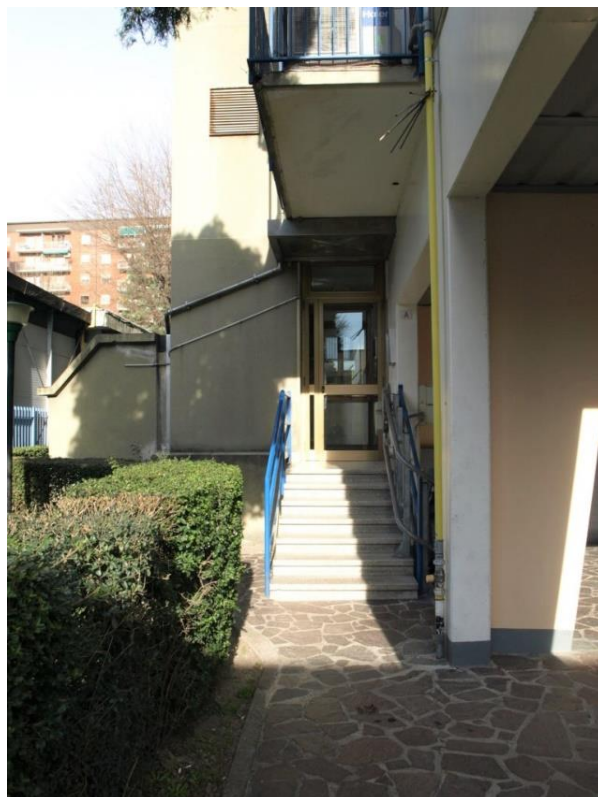
INGRESSO SCALA A

R.G.E. n°996/2019 CORSICO (MI) Via Niccolò Copernico n°9 Appartamento piano 3° +cantina piano S1°