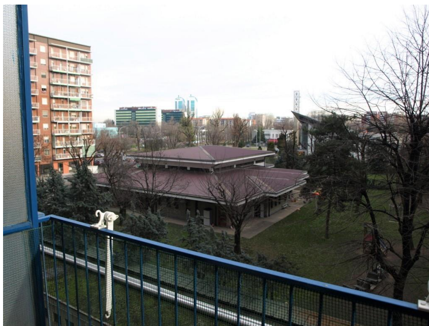
VISTA DA BALCONE

R.G.E. n°996/2019 CORSICO (MI) Via Niccolò Copernico n°9 Appartamento piano 3° +cantina piano S1°