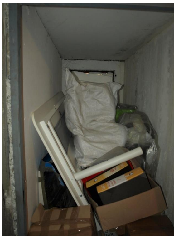
INTERNO LOCALE CANTINA