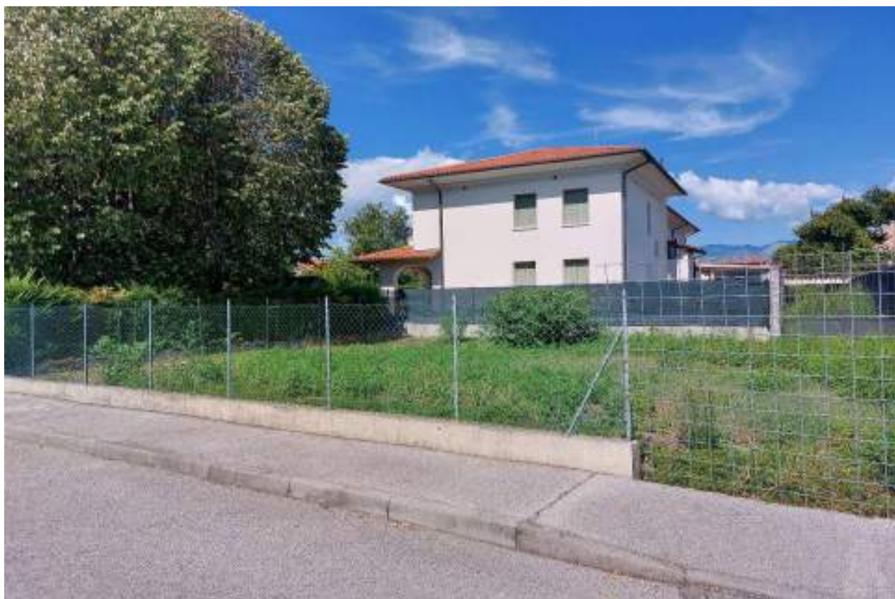
Lotto 2 – 22/08/2022 - Comune di Porcia – Foglio 13 – mappale 715 – Veduta, da via G. da Verrazzano, della porzione ovest del terreno, completamente recintato e attualmente incolto.