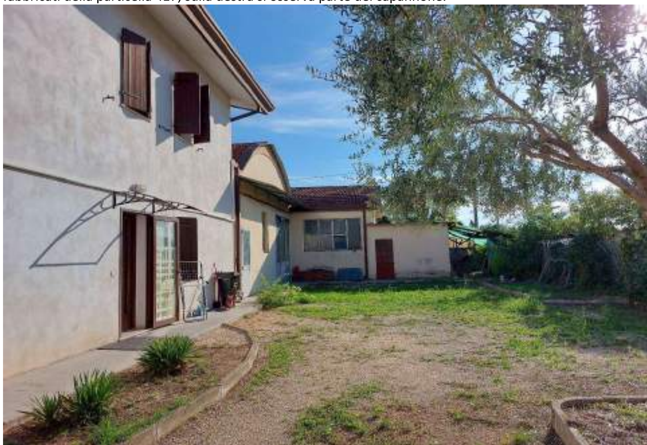
Lotto 1 - Comune di Pordenone (PN) – Frazione Rorai Grande – Via Conegliano n°4. Particolare dell'accesso carrabile ai fabbricati della particella 417 e dell'area comune, nella porzione sud della proprietà.