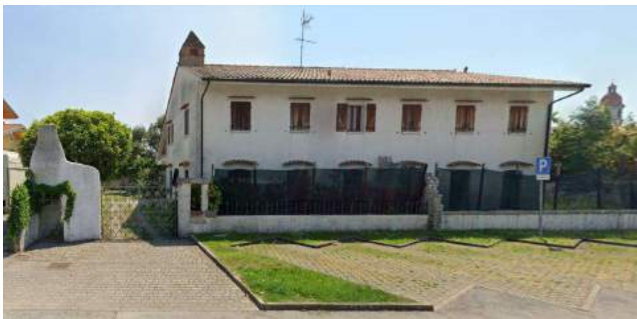
Lotto 2 – Comune di Porcia – Foglio 13 – mappale 700 – Veduta dell'abitazione pignorata da Via C. Colombo.