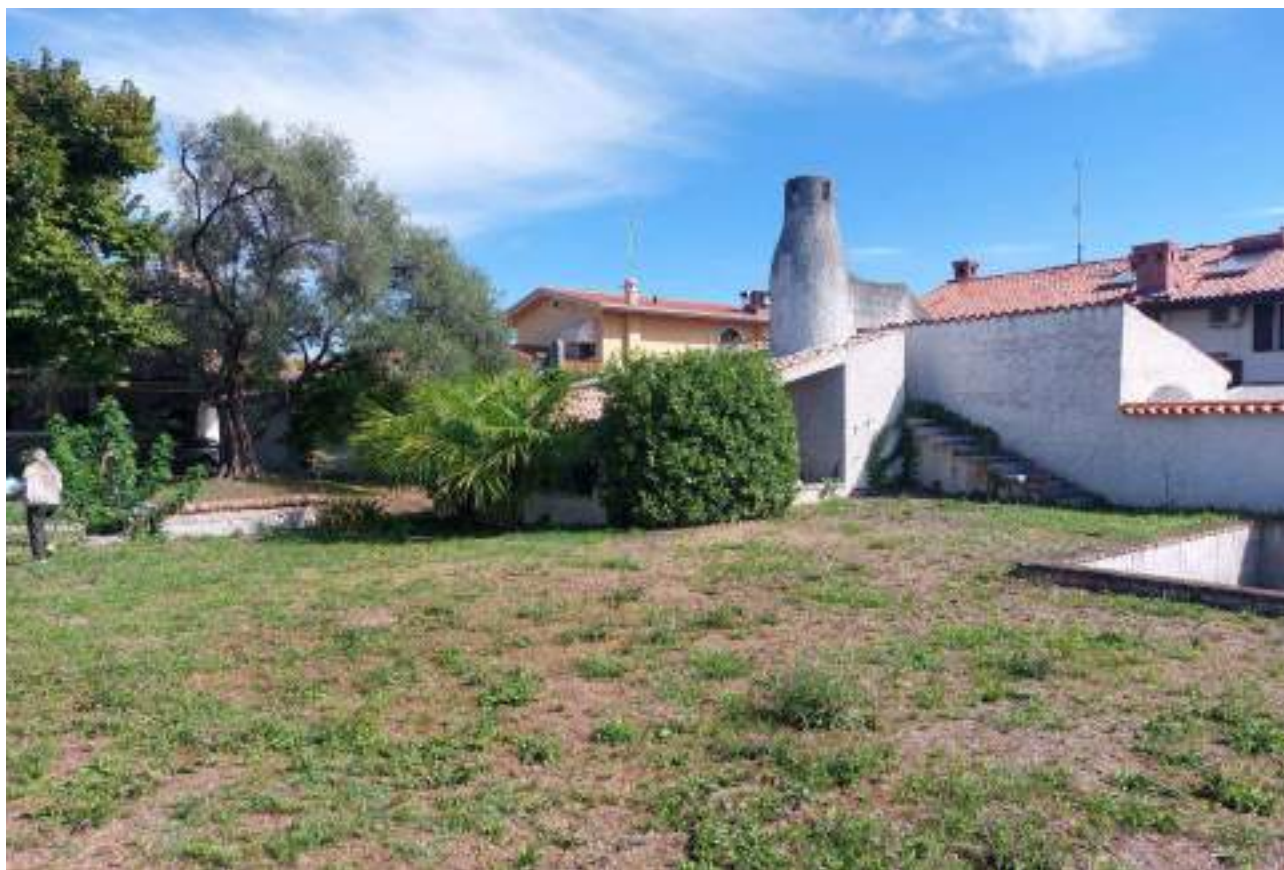
Lotto 2 – Comune di Porcia – Foglio 13 – particella 755 – Veduta, dall'interno della proprietà, della tettoia con deposito e pertinenza che insistono sulla particella.