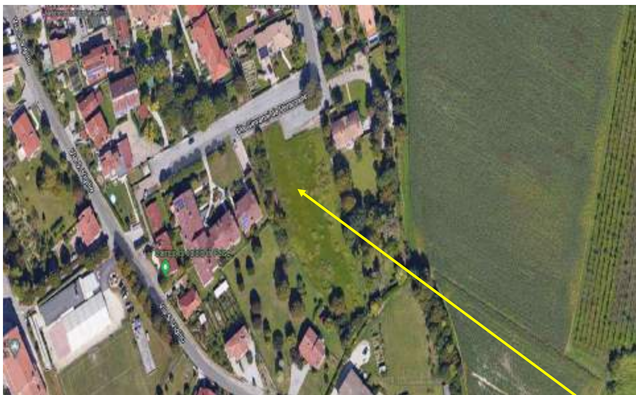
E.I. 132/2021 - LOTTO 3 - Porcia (PN) – Frazione Palse – Foglio 13 – Via G. Da Verrazzano: particella 716, localizzazione approssimativa.