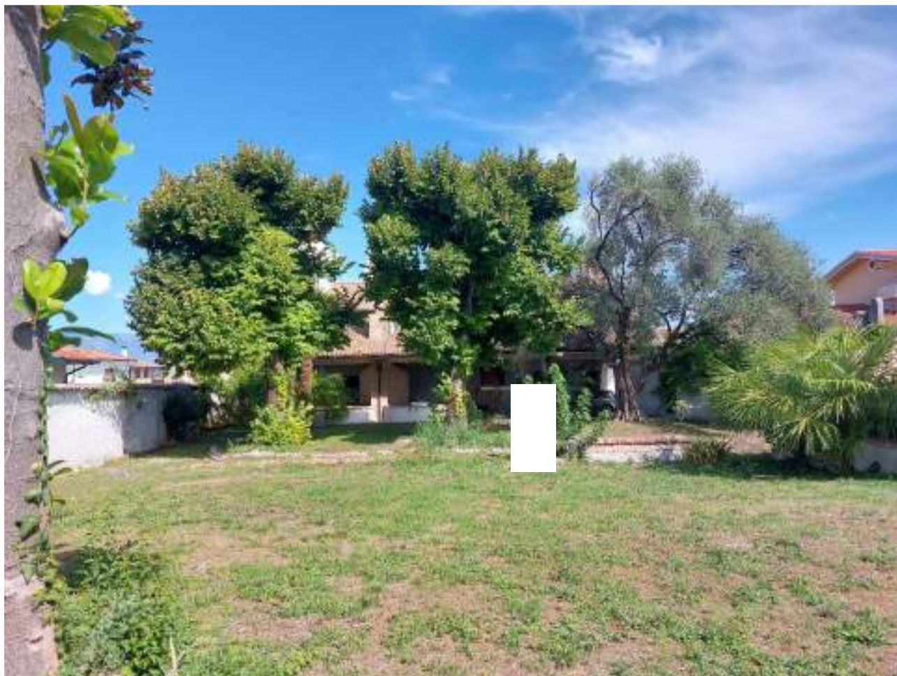
Lotto 2 – Comune di Porcia, fraz. Palse – Foglio 13 – mappale 700 – Veduta dell'abitazione pignorata dal giardino interno.