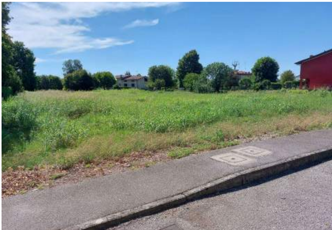
Lotto 3 – 22/08/2022 - Comune di Porcia – Foglio 13 – mappale 716 - Veduta, da posizione nord-est, del terreno edificabile pignorato.