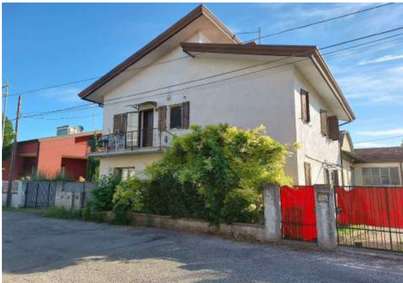
Lotto 1 - Comune di Pordenone (PN) – Frazione Rorai Grande – Via Conegliano n°4. Veduta generale dei fabbricati della particella 417; sulla destra si osserva parte del capannone.