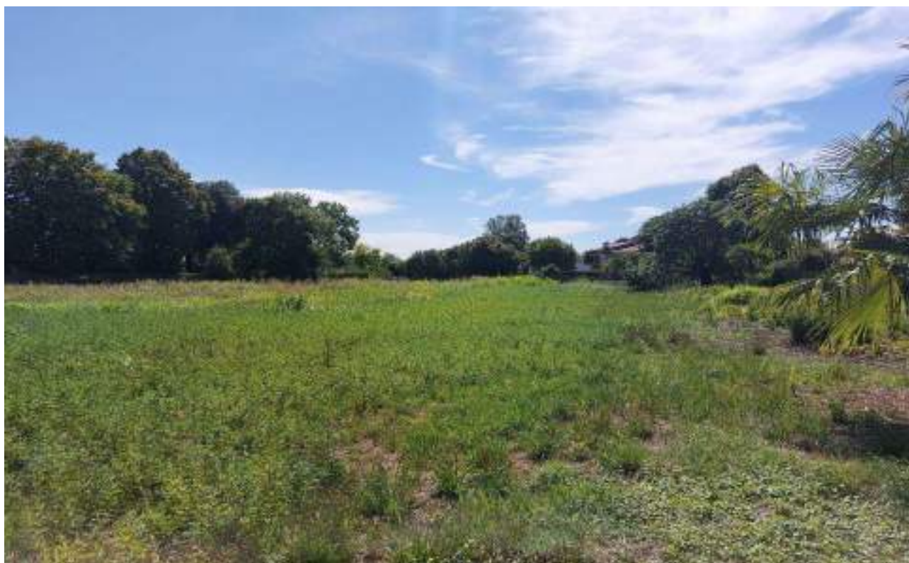
Veduta, da posizione nord-ovest, dello stesso terreno.