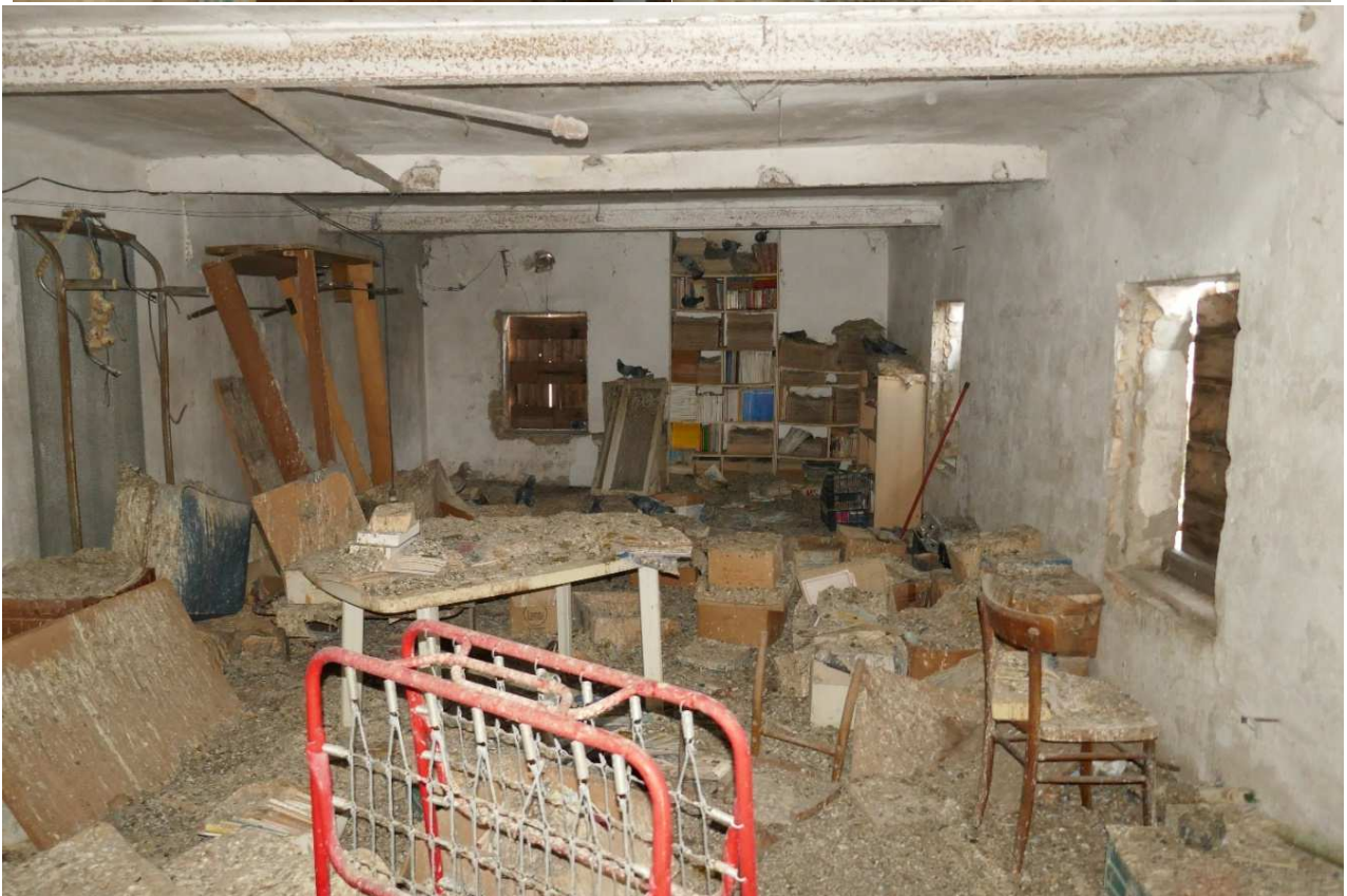
La soffitta è impregnata di guano di colombo. Alcuni si intravedono sullo sfondo come sagome scure.