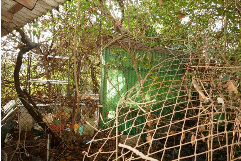
Si intravede, verso il basso a sx, la vasca del pozzo artesiano