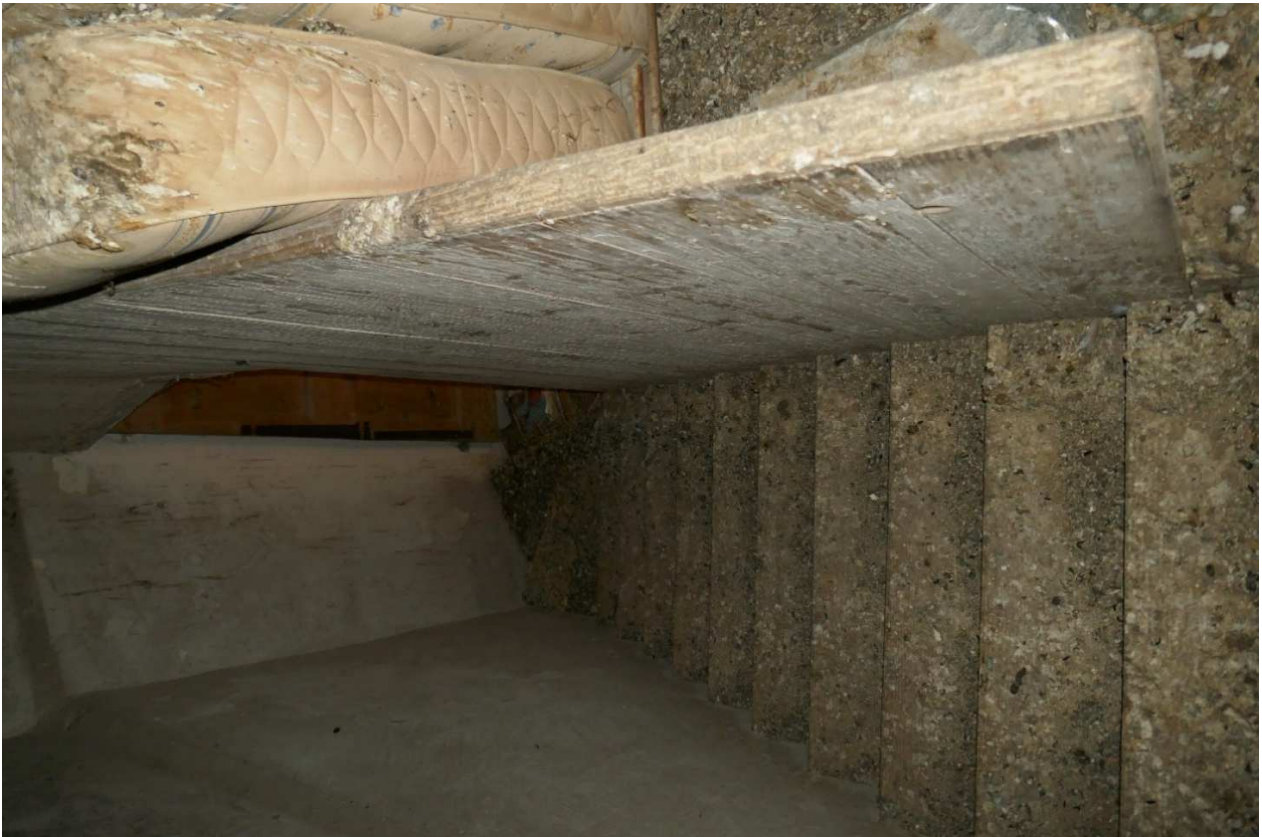
Le scale della soffitta viste dall'alto. Si nota il copioso strato di guano, perlopiù ormai secco.