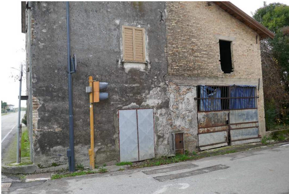
FOTO – E.I. 89/2023 - San Michele al Tagliamento (VE), Via Malafesta 2.