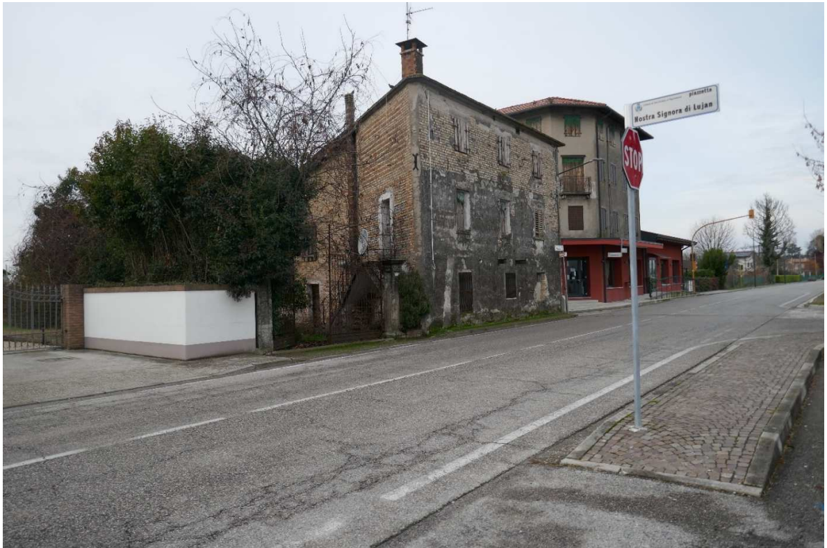
Vista dalla “Piazzetta Nostra Signora di Lujan”, che in realtà corrisponde ad un parcheggio. In primo piano la strada provinciale n. 75 – Via Malafesta (oltre l’incrocio assume la denominazione “Via Scuole – La strada della quale si intravede l’imbocco a dx è la Via Carso)