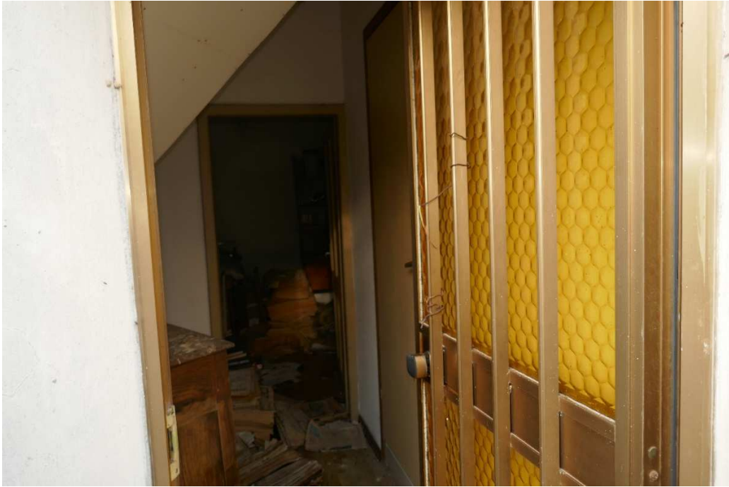
Porta d'ingresso alle stanze del 1° piano. Vi si accede tramite le scale esterne e dal relativo pianerottolo.