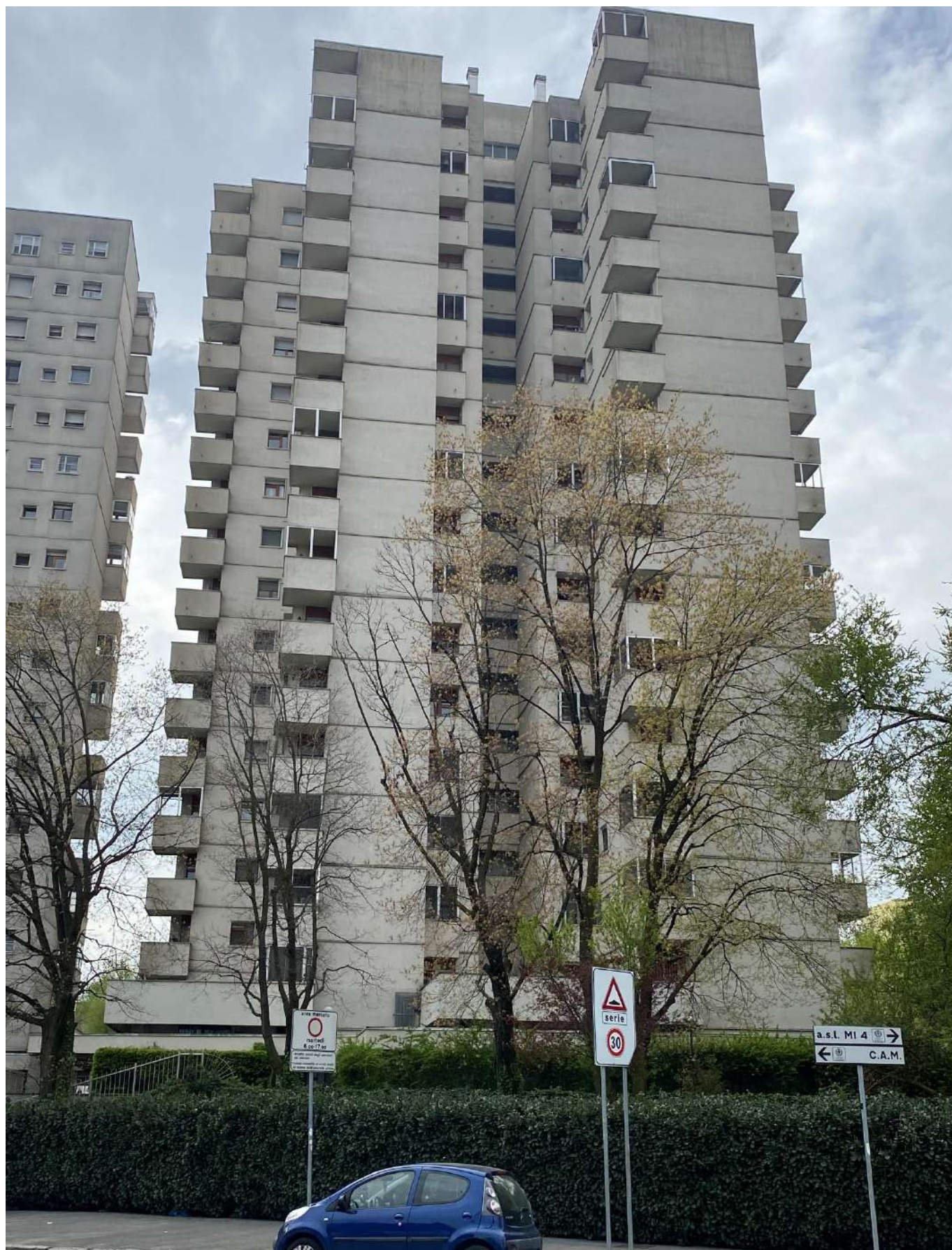
Edificio di Via Saponaro 18