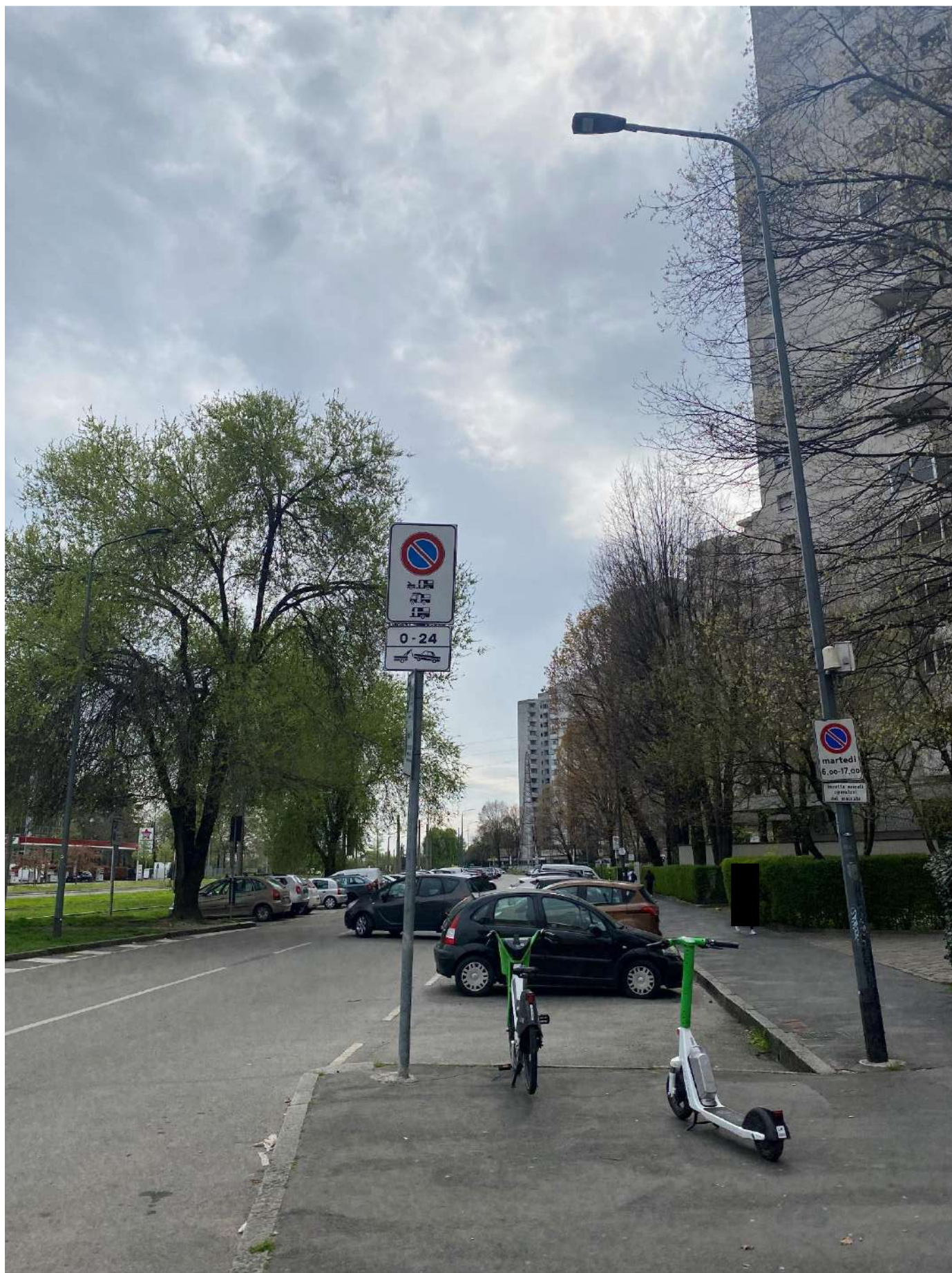
Vista Via Saponaro