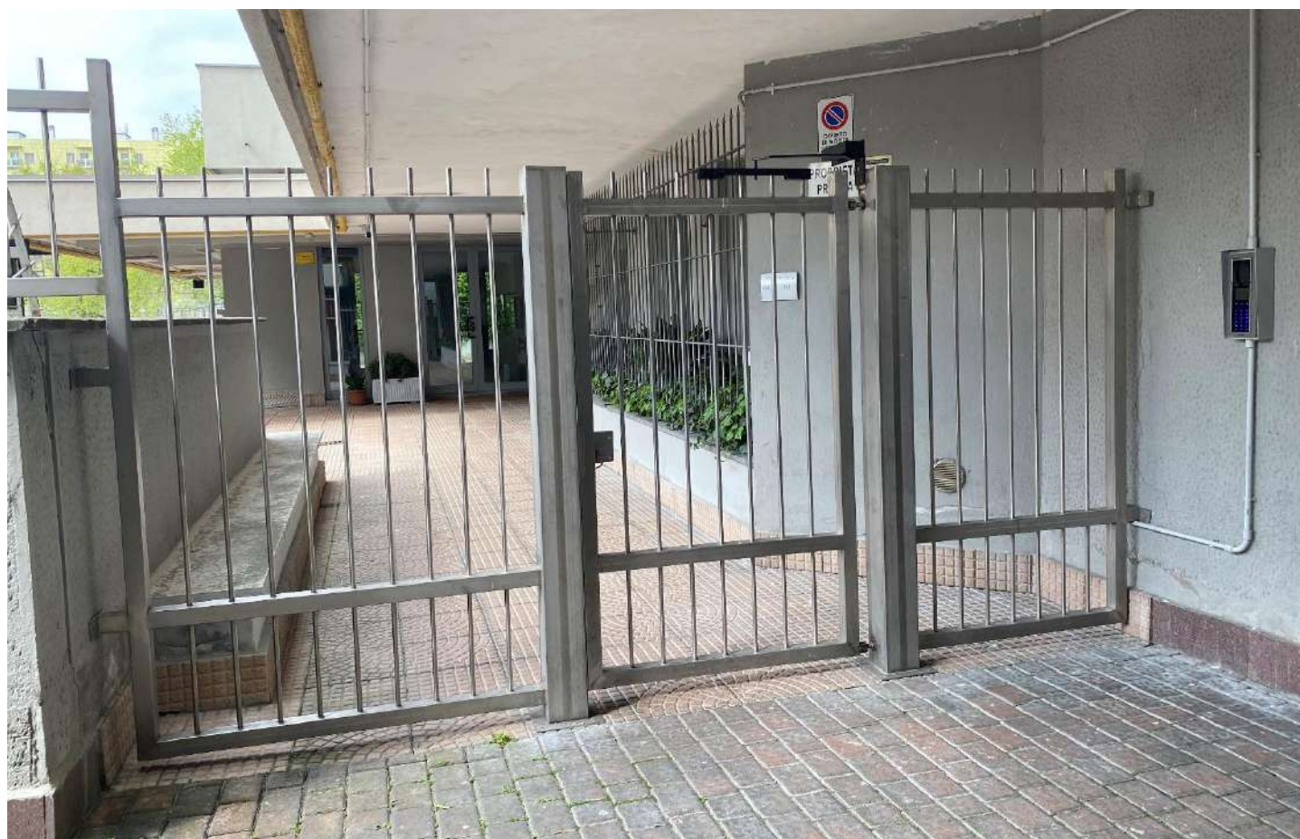
Cancello di accesso all'edificio