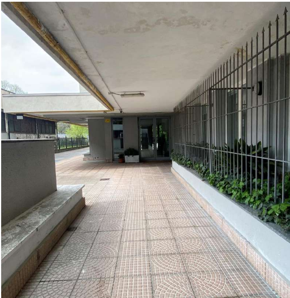
Vista portone di accesso all'edificio