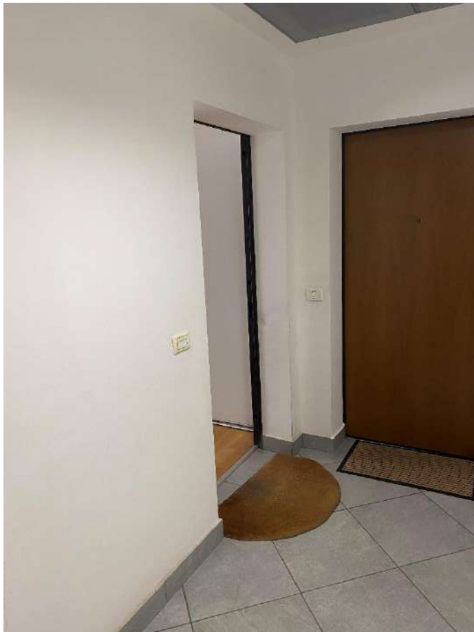
Vista porta ingresso all'appartamento