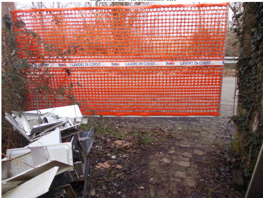
Ingresso da via Rozzano snc

Immobile ubicato in Comune di ASSAGO (MI) via Rozzano snc Esecuzione Immobiliare N. 948-2024 - Tribunale di Milano