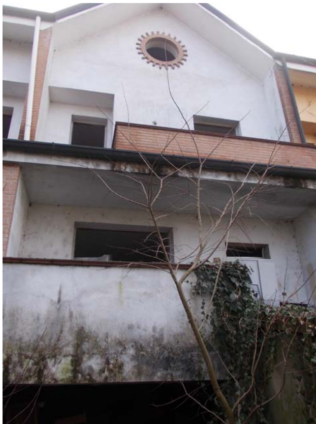
Area esterna fronte strada

Immobile ubicato in Comune di ASSAGO (MI) via Rozzano snc Esecuzione Immobiliare N. 948-2024 - Tribunale di Milano