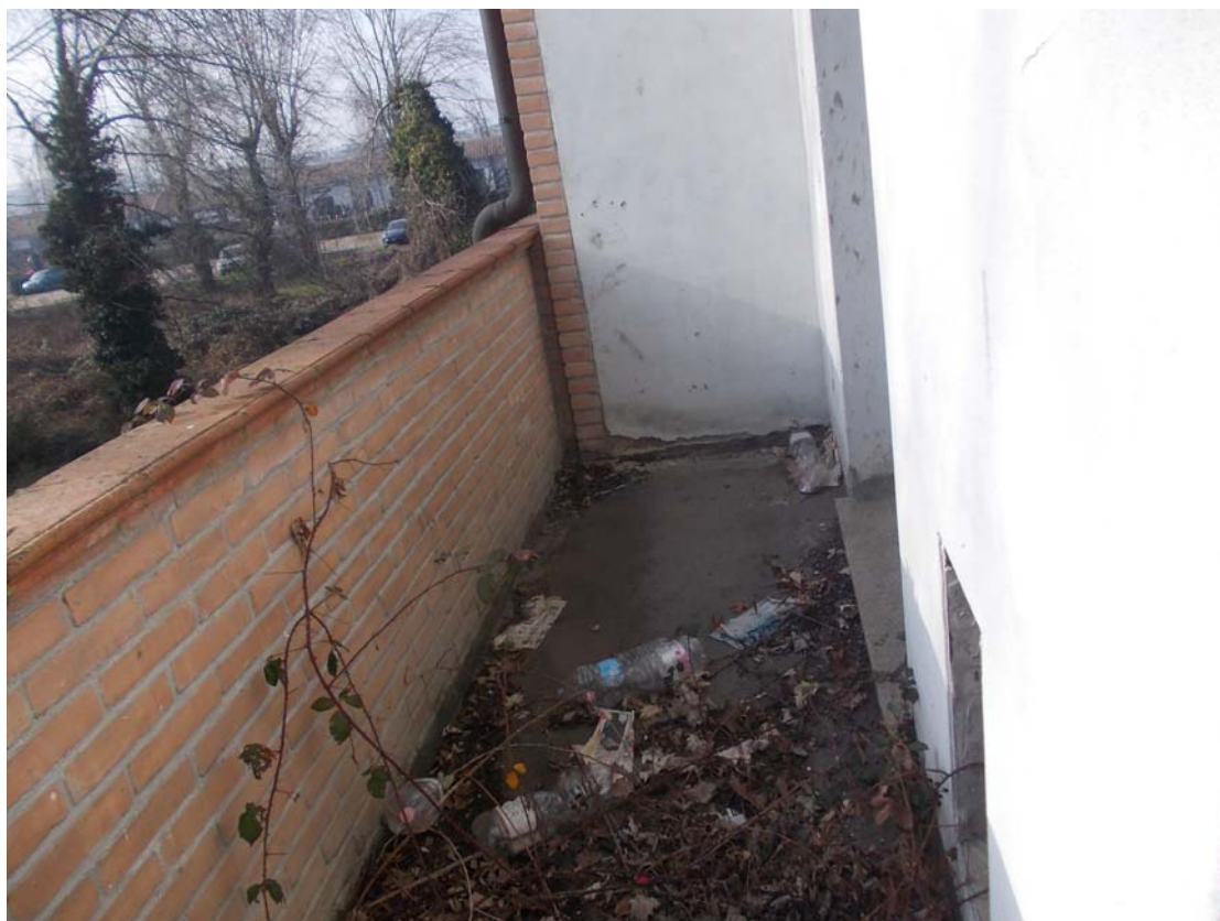
Vista area esterna dal piano primo

Immobile ubicato in Comune di ASSAGO (MI) via Rozzano snc Esecuzione Immobiliare N. 948-2024 - Tribunale di Milano