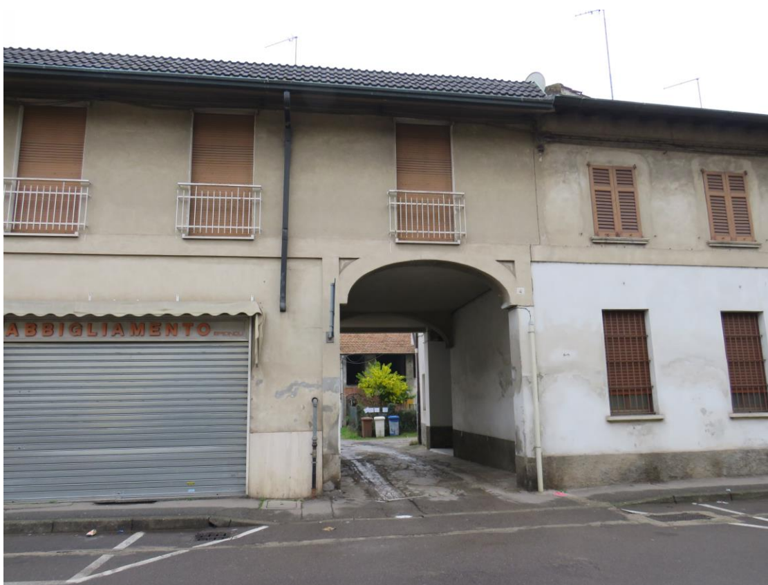
INGRESSO COMPLESSO IN VIA FRATELLI CASATI