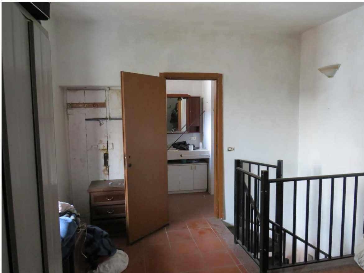
CAMERA PRIMO PIANO