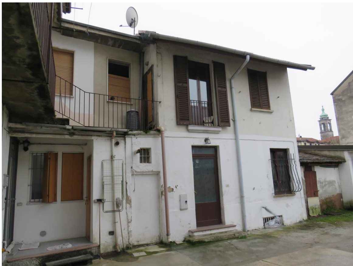
IMMOBILE IN ESAME CON FACCIATA SU CORTILE INTERNO