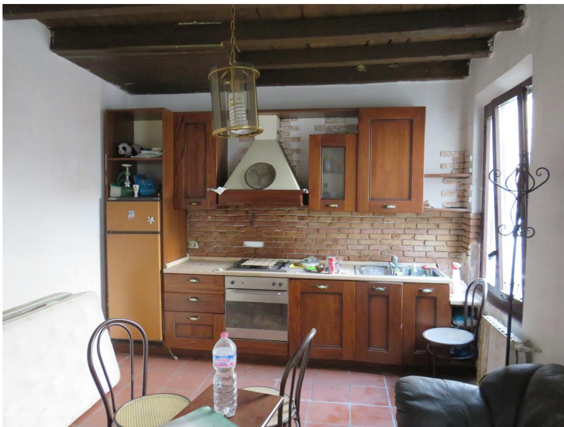
CAMERA PIANO TERRENO LATO ATTREZZATO CUCINA