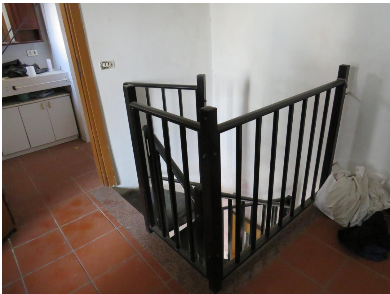
SCALA CHIOCCIOLA INTERNA