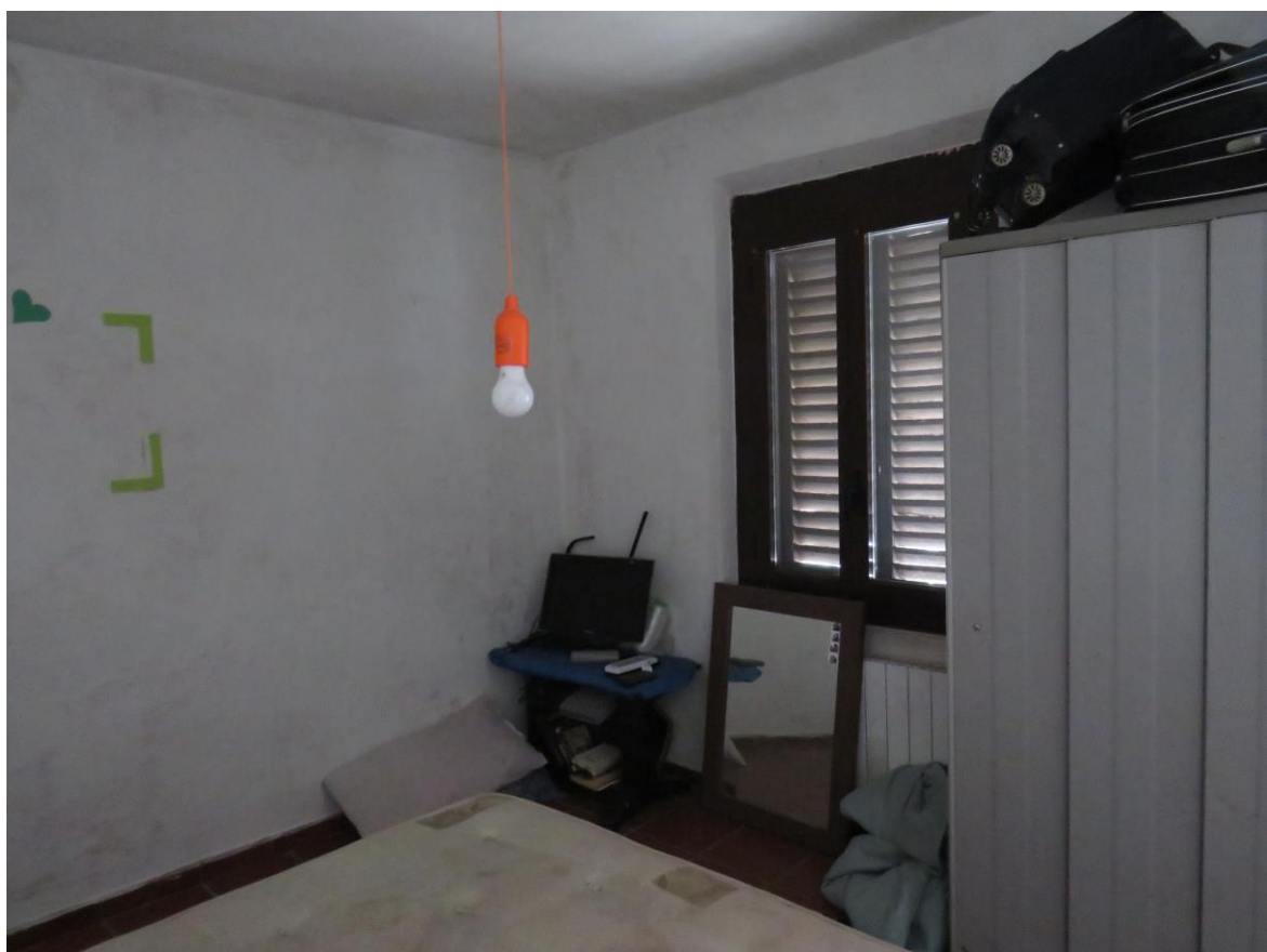
CAMERA PRIMO PIANO