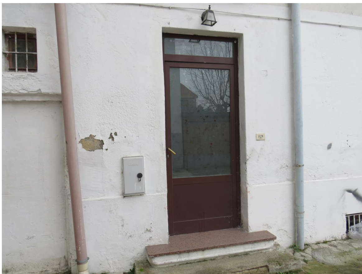
PORTONCINO DI INGRESSO