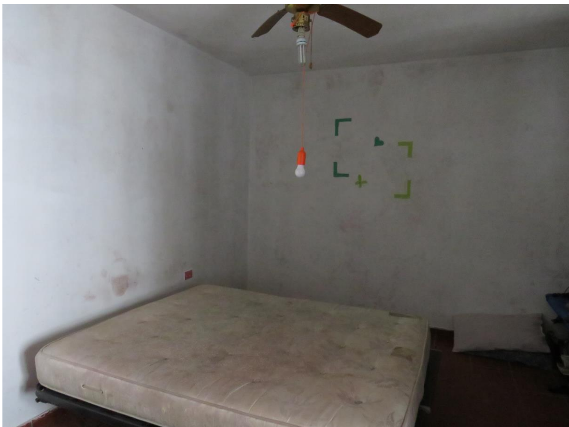
CAMERA PRIMO PIANO