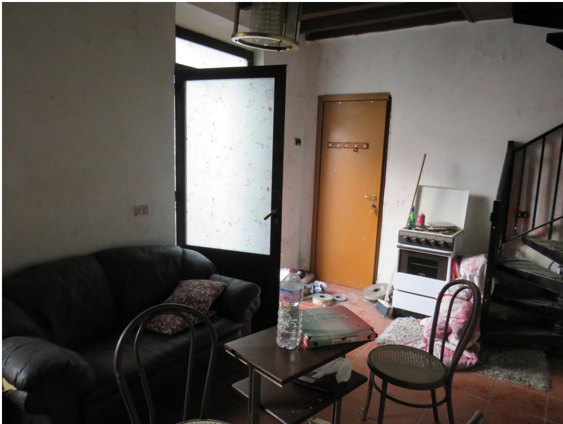
CAMERA PIANO TERRENO