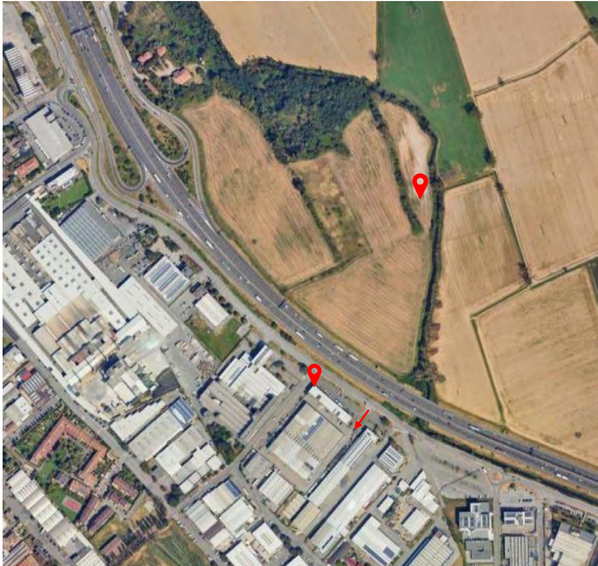
Inquadramento territoriale - vista dell'area e individuazione fabbricato e accesso

Indirizzo e piano: _____ Trezzano sul Naviglio (MI), via N. Copernico 54, p T Categoria: _____ C/6 autorimesse