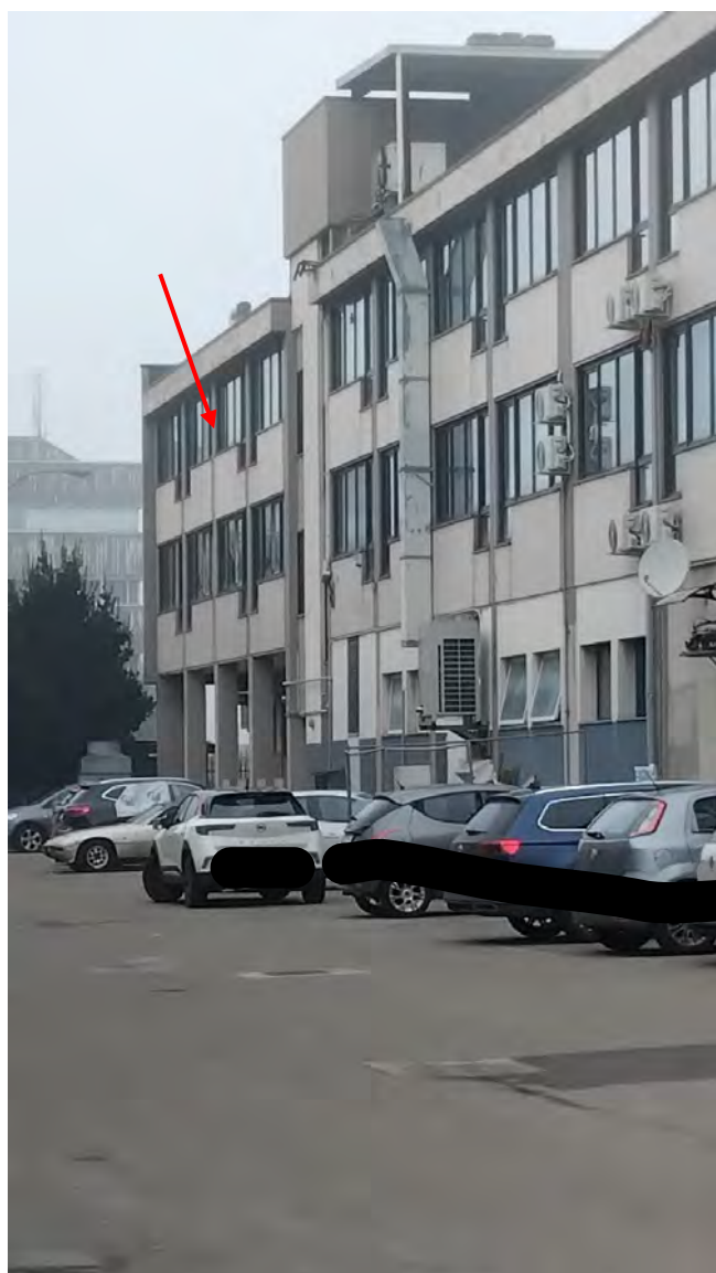
Prospetto verso il cortile interno