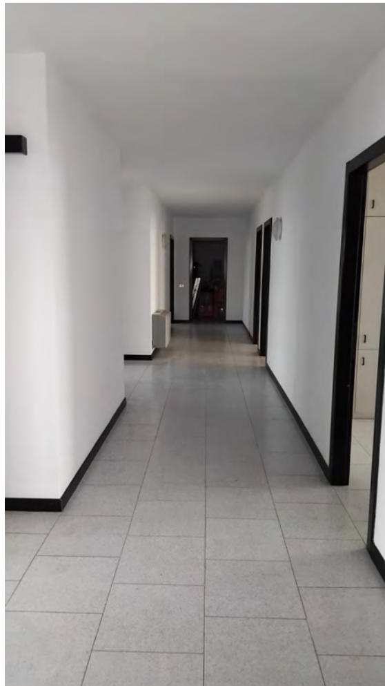
Corridoio e uscita di sicurezza