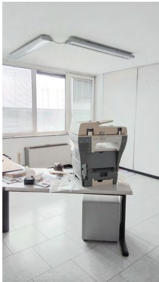
Vista degli uffici