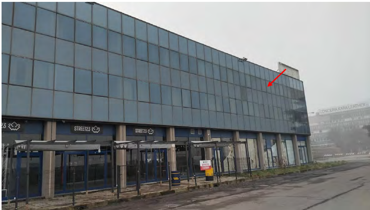
Prospetto su via Copernico