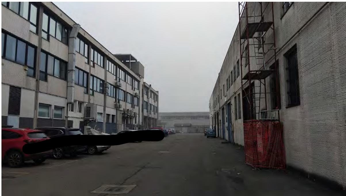
Vista cortile interno, ingresso alla scala interna