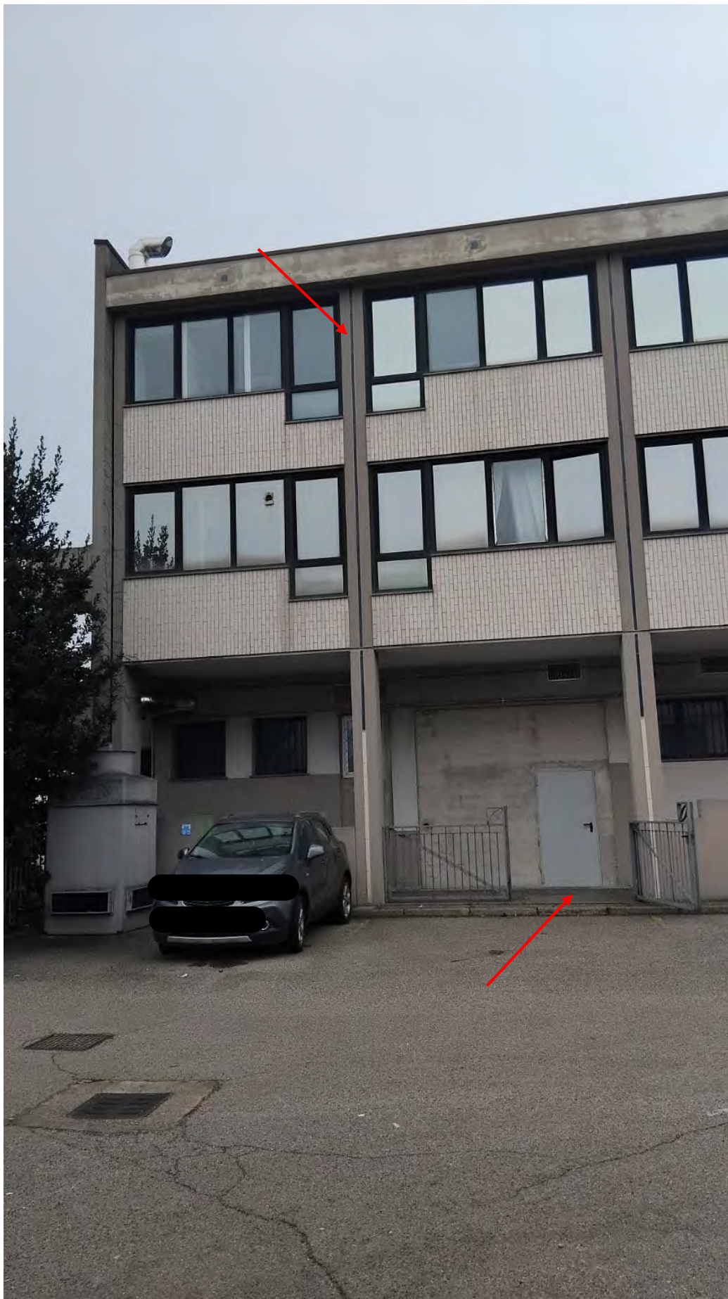
Prospetto verso il cortile interno con indicazione di accesso e posizione ufficio